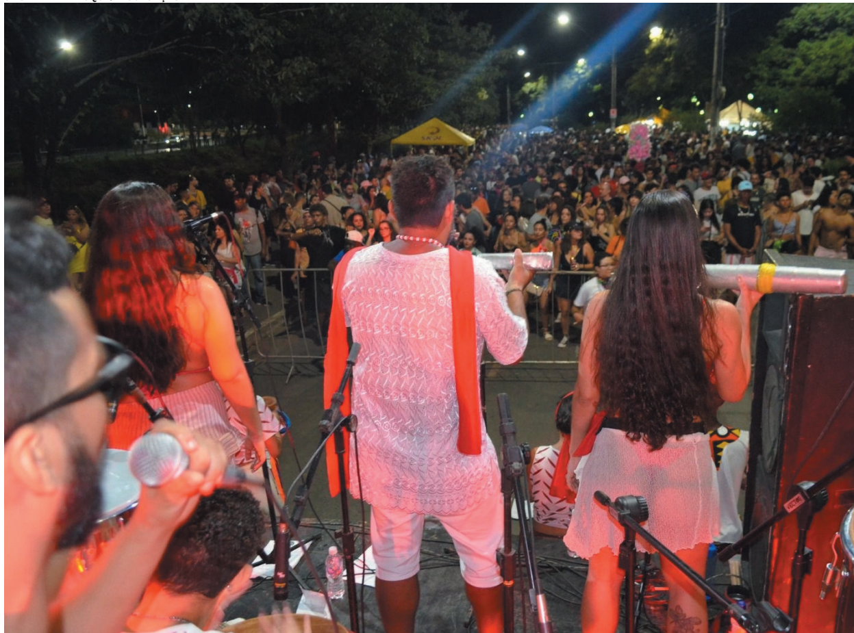
A maior cidade do Norte do Estado terá 20 blocos carnavalescos para todos os tipos de gostos