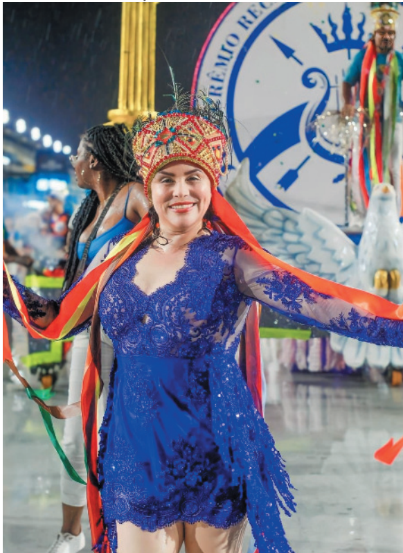
A cantora Leila Britto