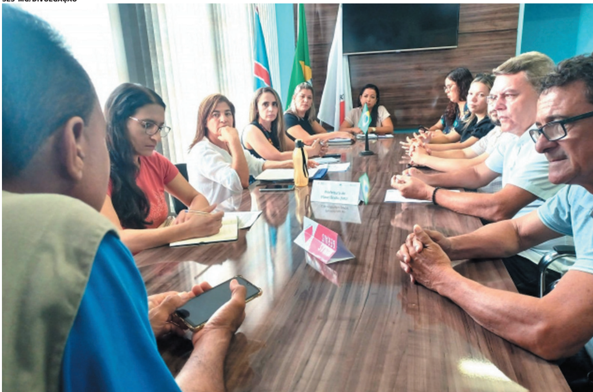
Orientações foram reforçadas pela Superintendência Regional de Saúde (SRS) de Montes Claros junto com representantes locais