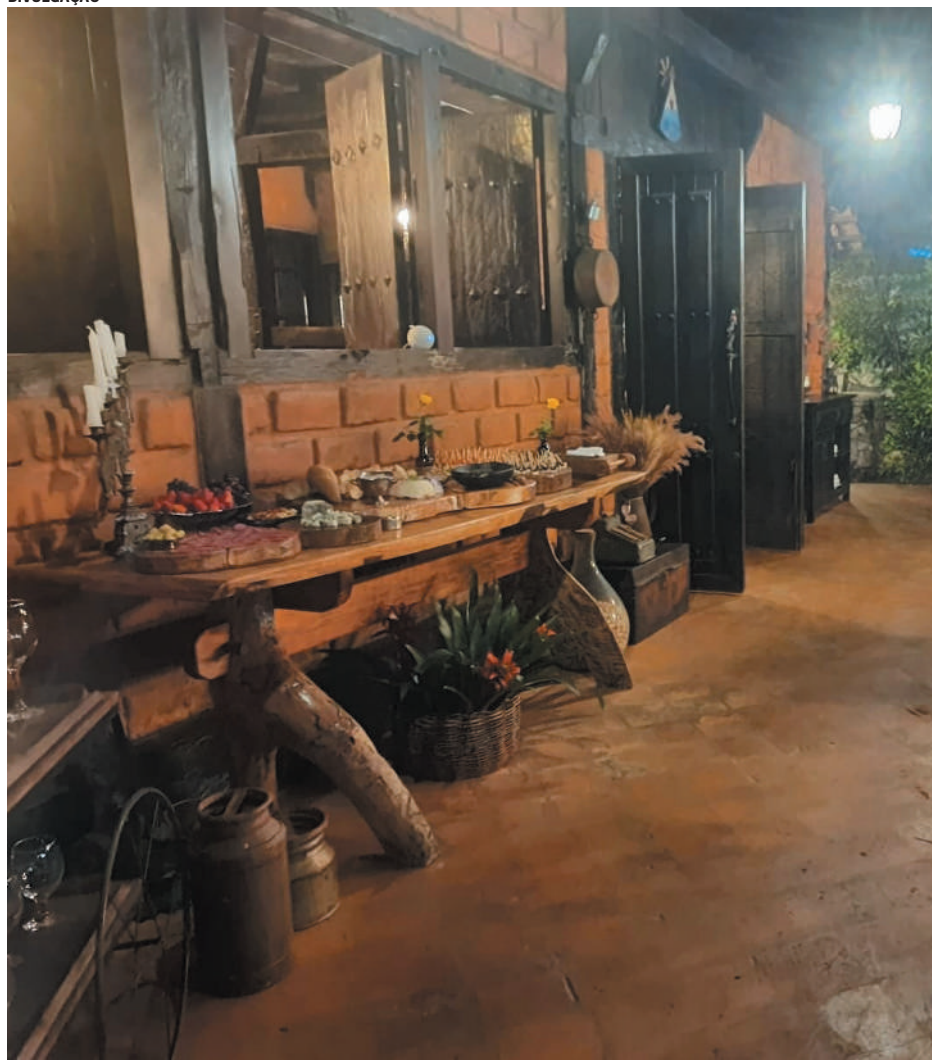
Grão Mogol, ambientes acolhedores para degustação de vinhos e queijos