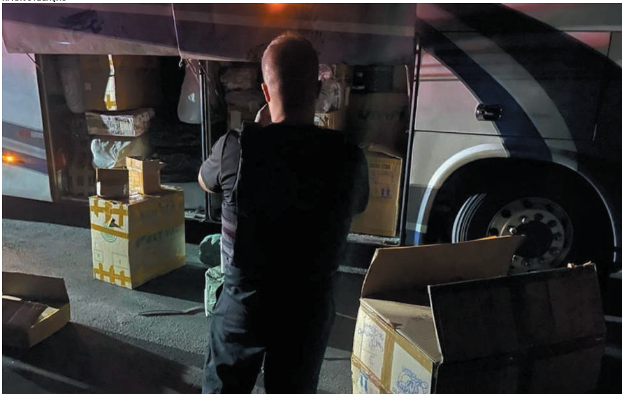
Durante semana de fiscalização, ônibus lotado de mercadorias foi abordado pela Receita Federal