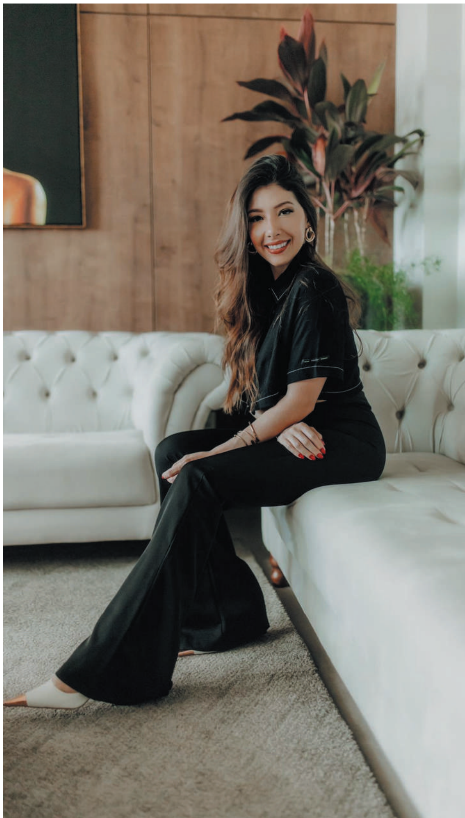
“Através da nutrição impacto positivamente a vida das pessoas, levando saúde”

Desde os meus 17 anos comecei a me apaixonar pelo mundo da alimentação saudável. Com isso, e cada vez mais tendo a plena certeza de que a alimentação constitui fator primário para uma qualidade de vida, tomei a iniciativa de me graduar na área com