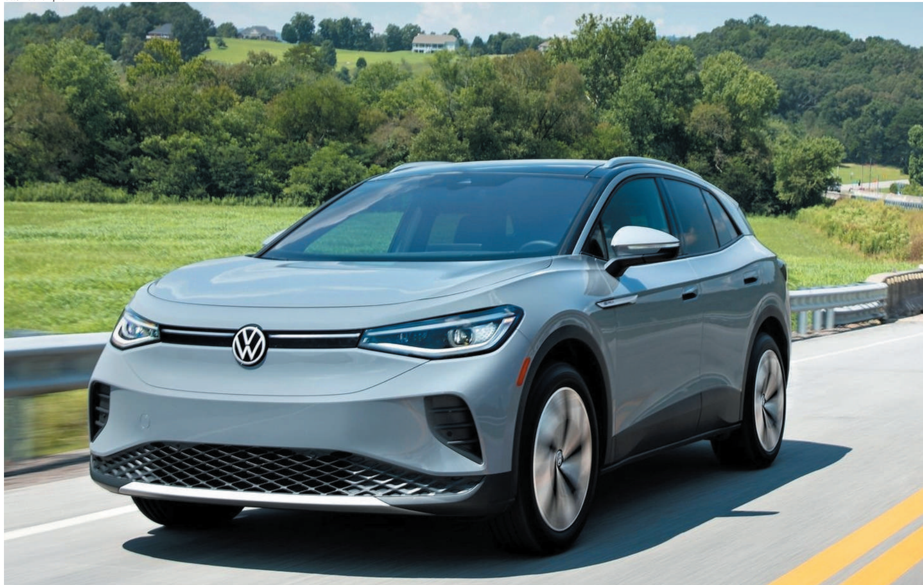
VW ID.4 marcará o início da eletrificação da marca no Brasil