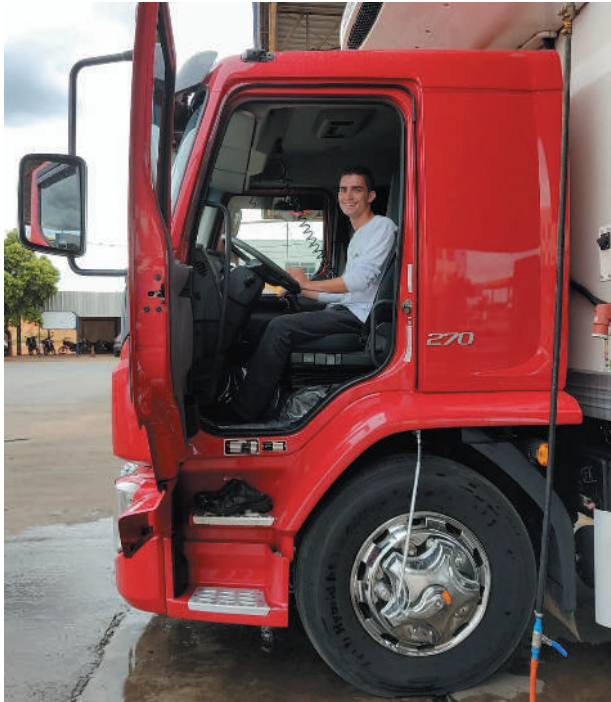
Consumidor pagará no final, alerta caminhoneiro