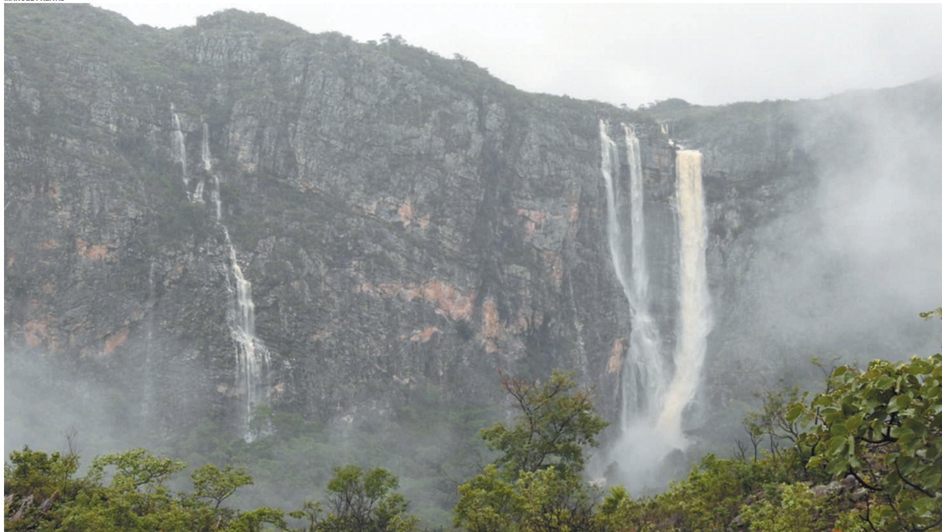
Espinhaço protege mananciais das principais bacias hidrográficas brasileiras