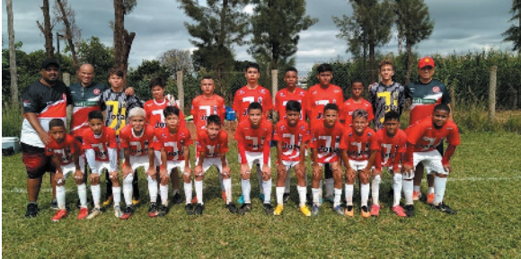
Equipe Juventus Sub-13 de Montes Claros

O Juventus Sub-13 de Montes Claros participou da Copinha, de onde saiu vencedor. Essas crianças brilharam! Foram sete jogos com cinco vitórias, um empate e apenas uma derrota.