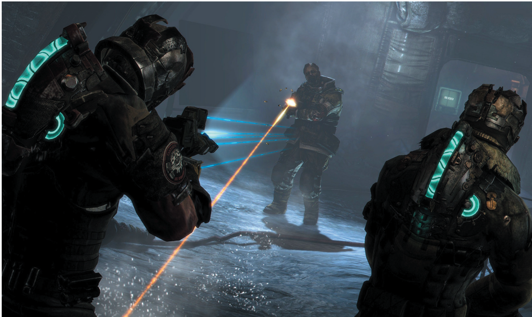
Terror frenético de “Dead Space 3” coloca um ponto final na trilogia macabra da Electronic Arts