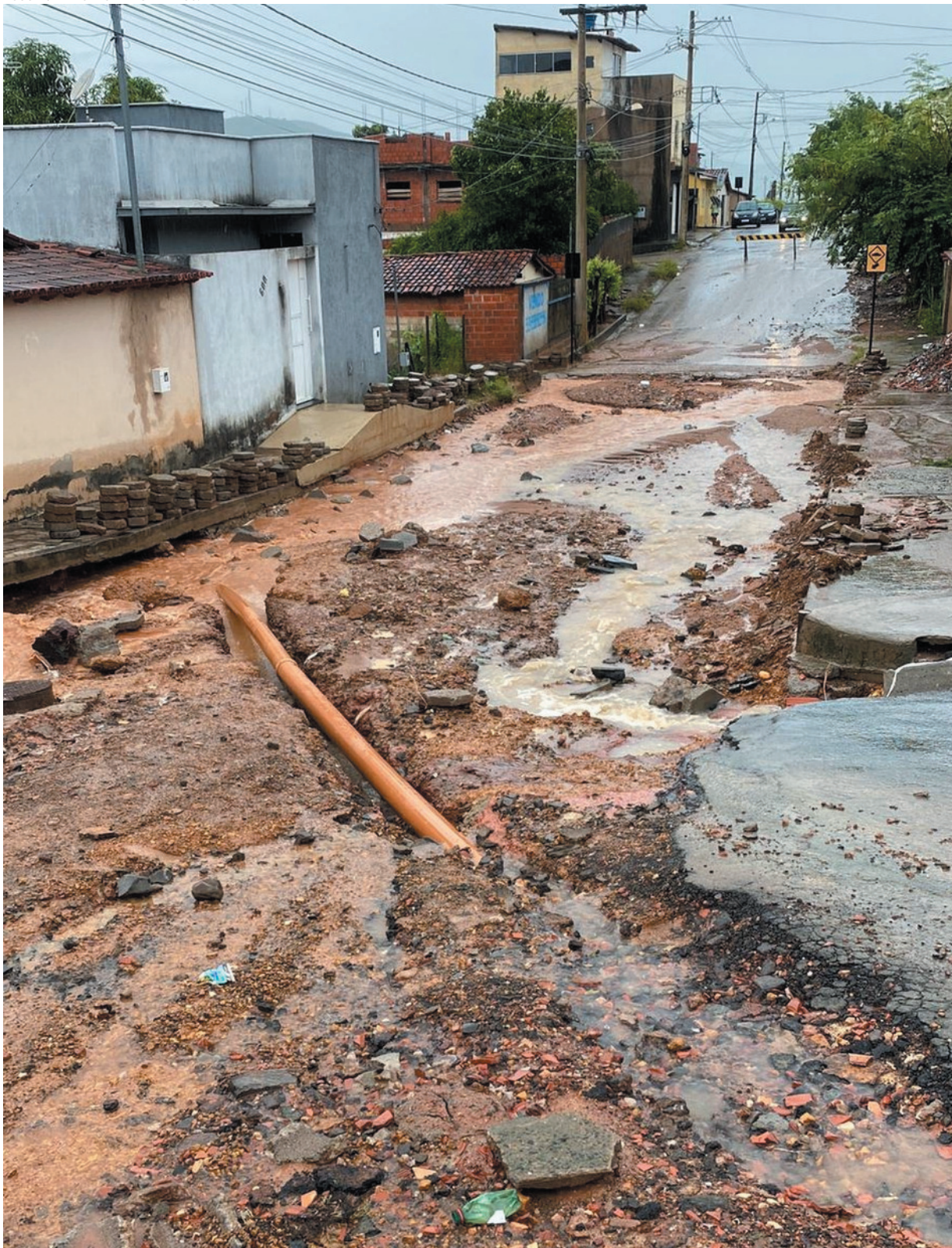
Registro feito por militares do Corpo de Bombeiros no bairro Boa Vista: situação dramática