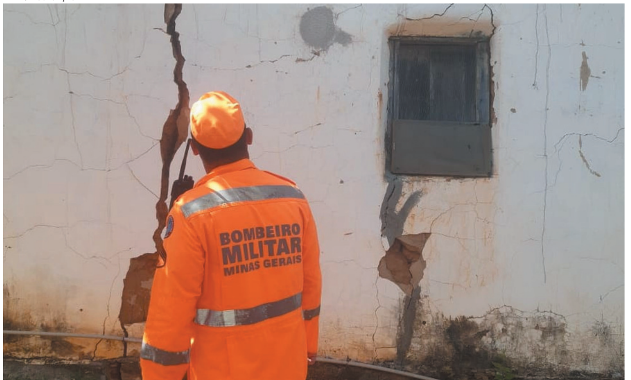
Três edificações ficaram comprometidas, com danos estruturais; moradores foram desalojados