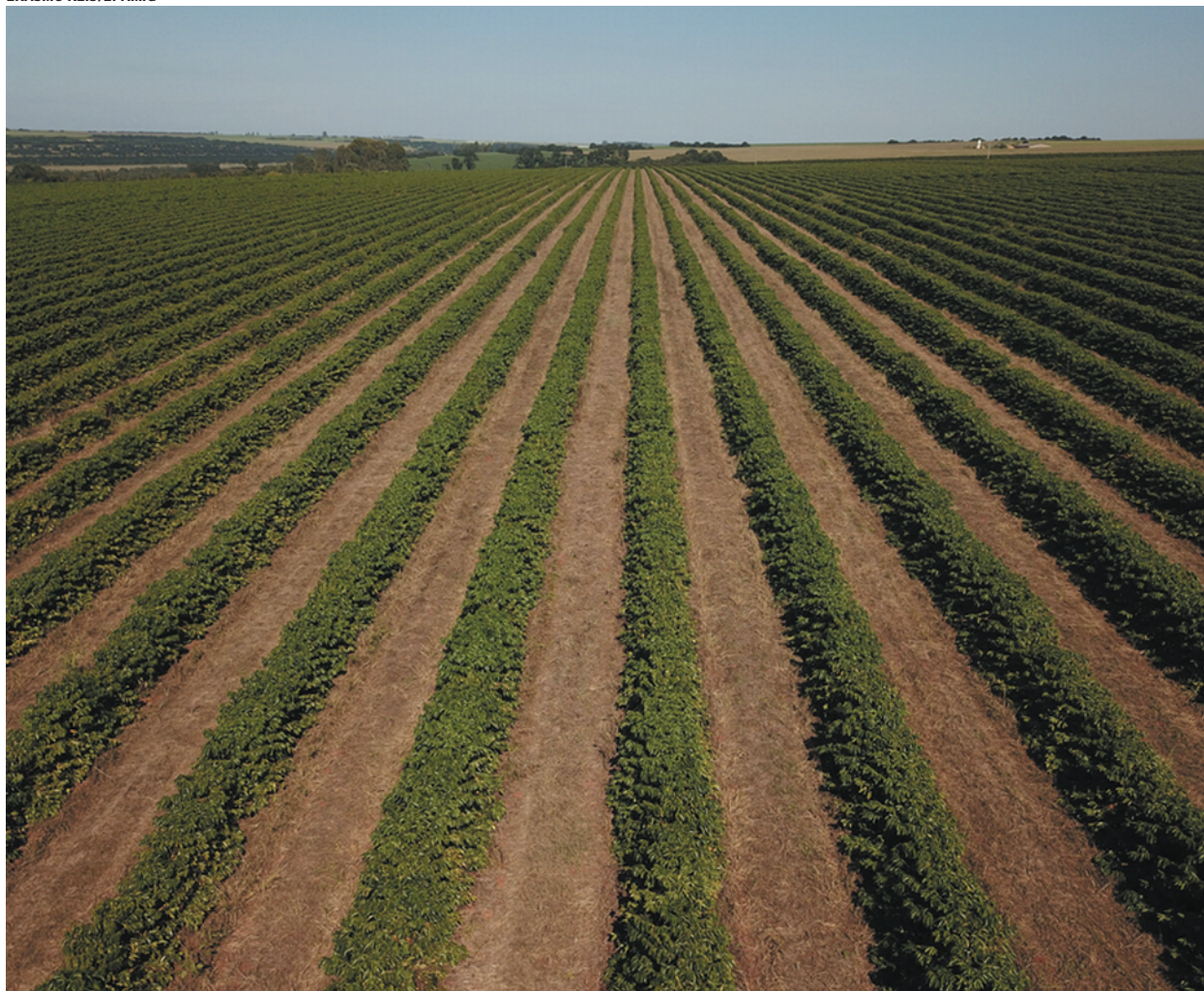
VBP do café somou R$ 29 bilhões em 2022, com crescimento de 22% em relação ao ano anterior

altos preços praticados no mercado interno ao longo do ano. Segundo o Cepea, de janeiro a dezembro, houve crescimento de 31% na média de preços da saca de café, comparado ao mesmo período em 2021. Em fevereiro, foi registrado a média mensal mais alta do período, chegando a R$ 1.485 a saca de 60 kg”, detalha o superintendente da Seapa.