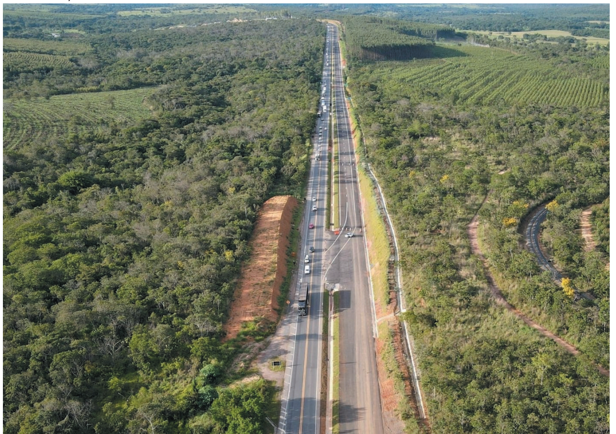
A "nova BR-135" terá, ao todo, 133 quilômetros de vias duplicadas e vai ganhar 13 passarelas