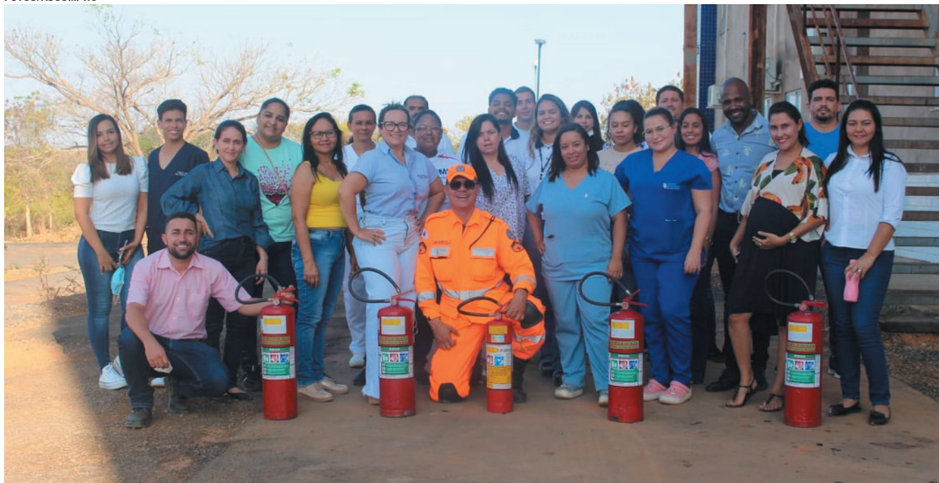
Participantes do treinamento ministrado pelo Corpo de Bombeiros no Hospital das Clínicas Dr. Mário Ribeiro da Silveira