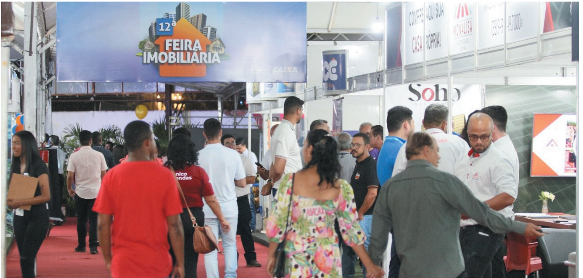
A 12ª edição Feira Imobiliária foi realizada na Fenics, com oferta de lançamentos e taxas diferenciadas pela Caixa Econômica Federal