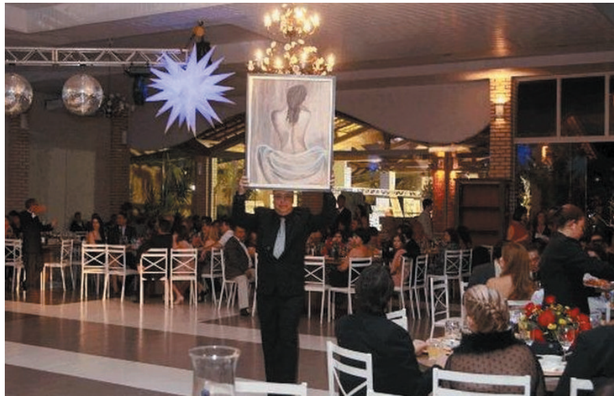
Flagrantes do último baile realizado e do leilão de obras de arte

Tradicionalmente antes do jantar, acontece um coquetel e o esperado leilão de arte, com participação dos mais importantes artistas plásticos de Montes Claros, que nos últimos 22 anos mantém uma parceria com o Rotary Leste num esforço conjunto em favor do Asilo São Vicente de Paulo e outros projetos assistenciais na cidade. As telas podem ser arrematadas em até 10 parcelas sem acréscimos, o que faz o leilão ficar muito atrativo.