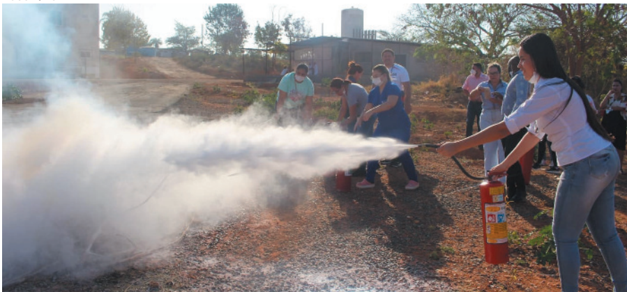
Turma aprendeu técnicas para usar mangueiras e extintores

Colaboradores do Hospital das Clínicas Dr. Mário Ribeiro da Silveira, em Montes Claros, participaram de treinamento orientado pelo Corpo de Bombeiros. De acordo com o coor-