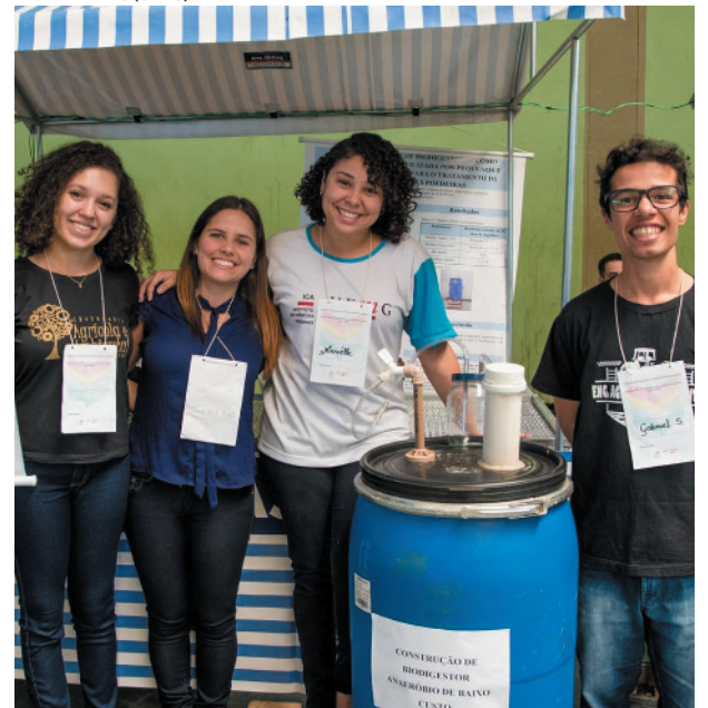
Trabalho expostos na Feira de Ciências em 2019

Estão abertas, até 30 de setembro, as inscrições para a nona edição da Feira de Ciências realizada pela UFMG em Montes Claros. Evento busca promover o intercâmbio de trabalhos técnico-científicos e produções culturais de diferentes instituições educacionais de toda a região. Devido à pandemia, não houve programação em 2020 e 2021. Estudantes e professores, do ensino fundamental ao superior, já preparam as apresentações. PÁGINA 4