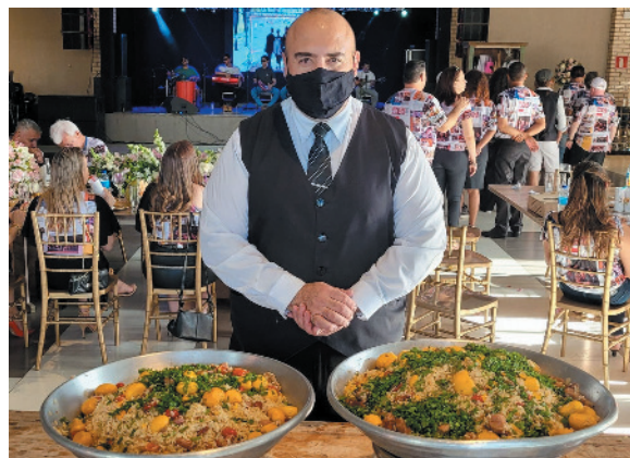
De dar água na boca a receita da anfitriã