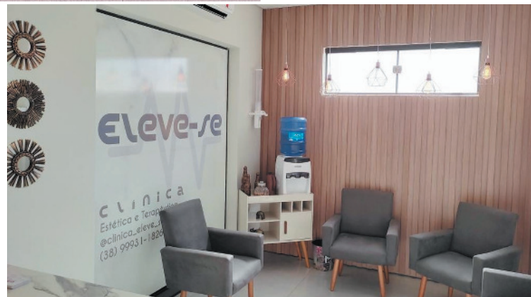
A Eleve-se fica no bairro São José, à rua Euzébio Godinho, 293b