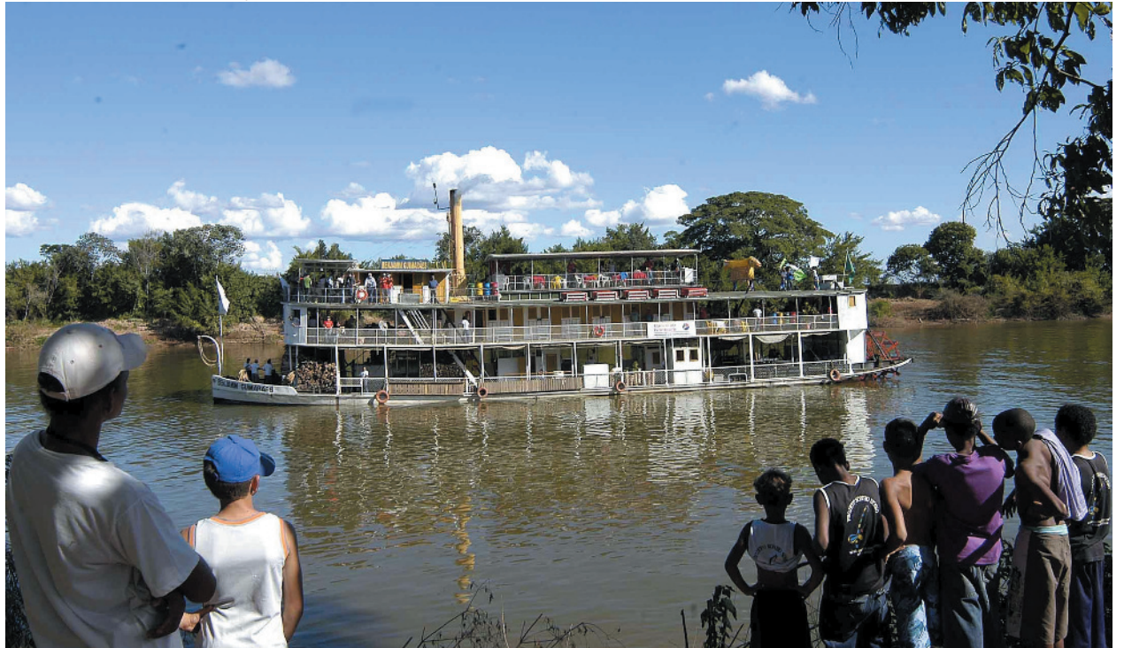
Acordo entre Iepha e Prefeitura de Pirapora foi firmado na terça-feira, véspera de audiência em Brasília