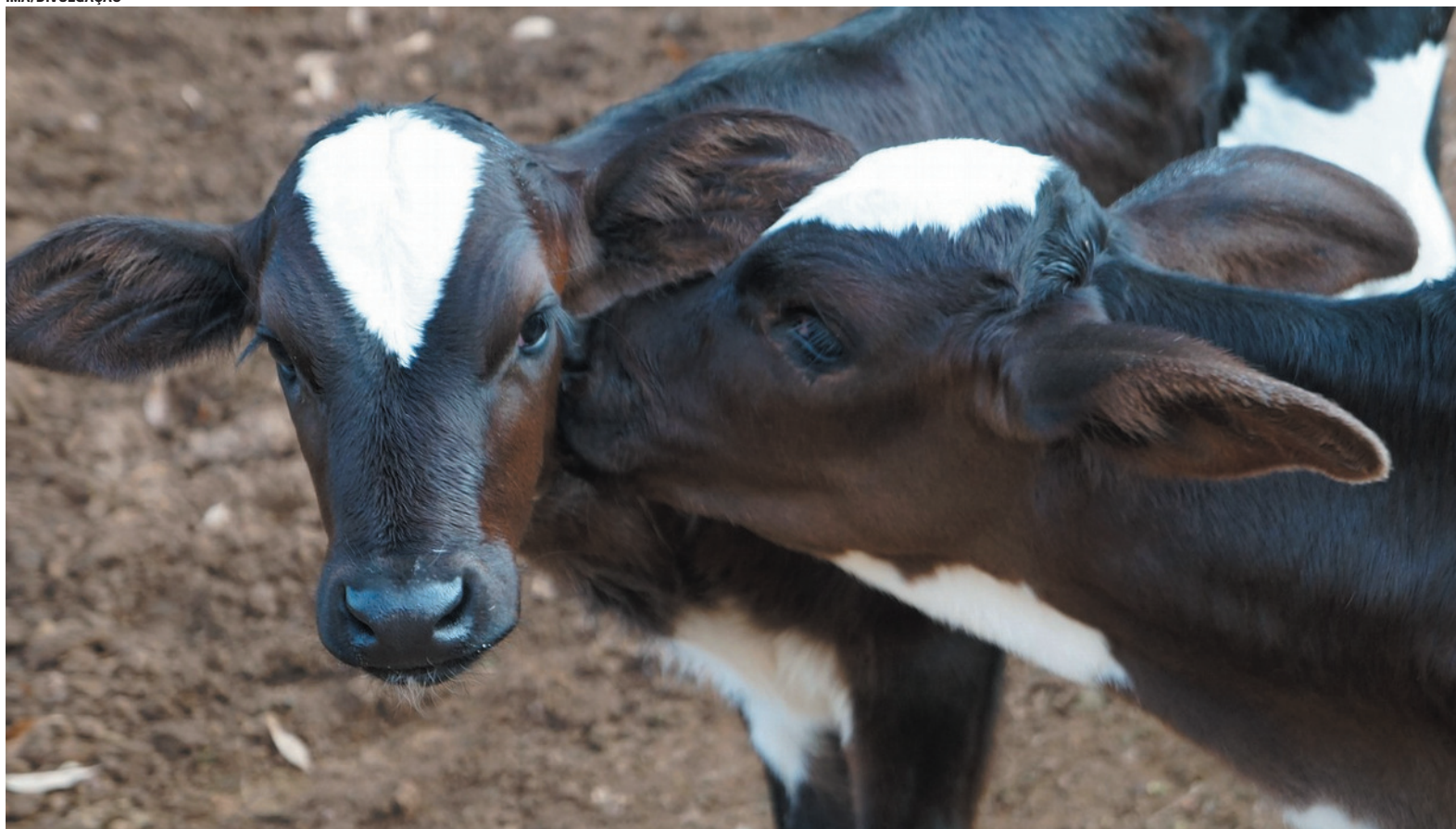
A previsão é a de que mais de um milhão de bezerras sejam vacinadas, tanto nas propriedades leiteiras quanto nas de corte

cam protegidos e não disseminam a doença. A vacina é de fácil acesso e amplamente distribuída no Estado, com cerca de 3 milhões de doses disponíveis”, defende Luciana Oliveira.