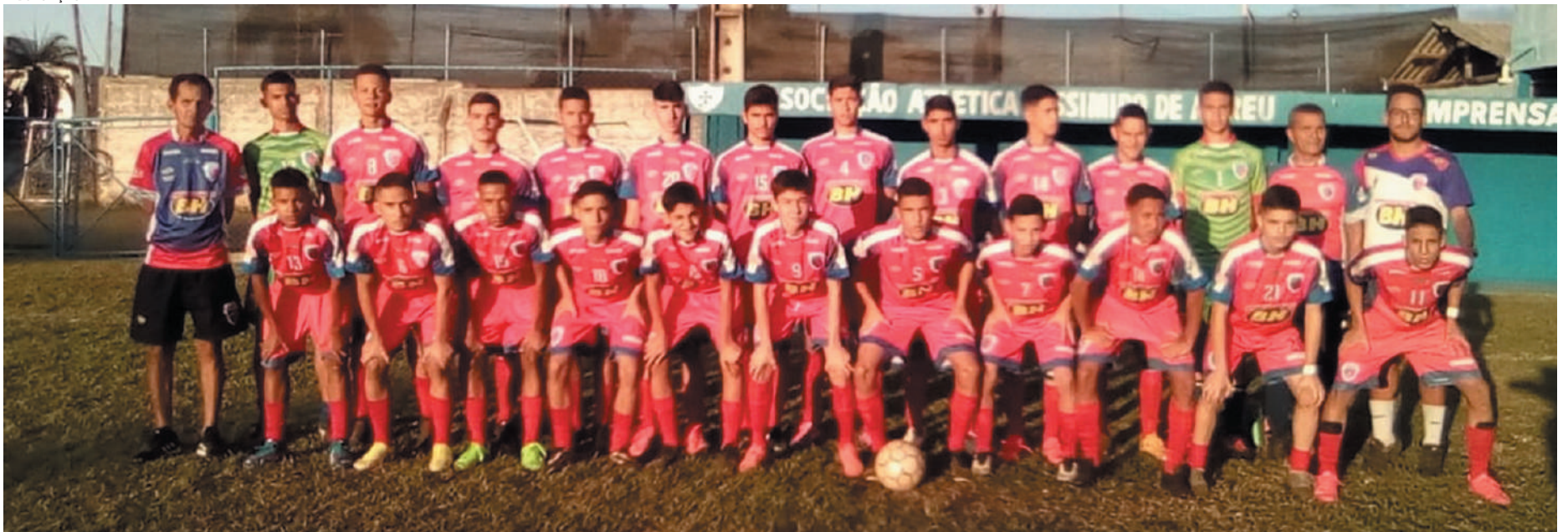
Depois de empatar com o Ateneu por 1 a 1 e seguir para a disputa de pênaltis, equipe Sub-16 da Funorte bateu 5 a 4 e conquistou mais um título no último domingo