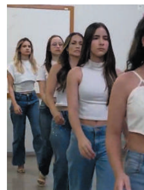
O encerramento aconteceu em grande estilo com um desfile simulado, proporcionando aos alunos a experiência real de passarela diante de uma plateia muito especial formada por familiares e amigos.