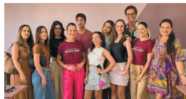
A equipe da Mary Kay conduziu uma aula especial de maquiagem e autocuidado com a pele