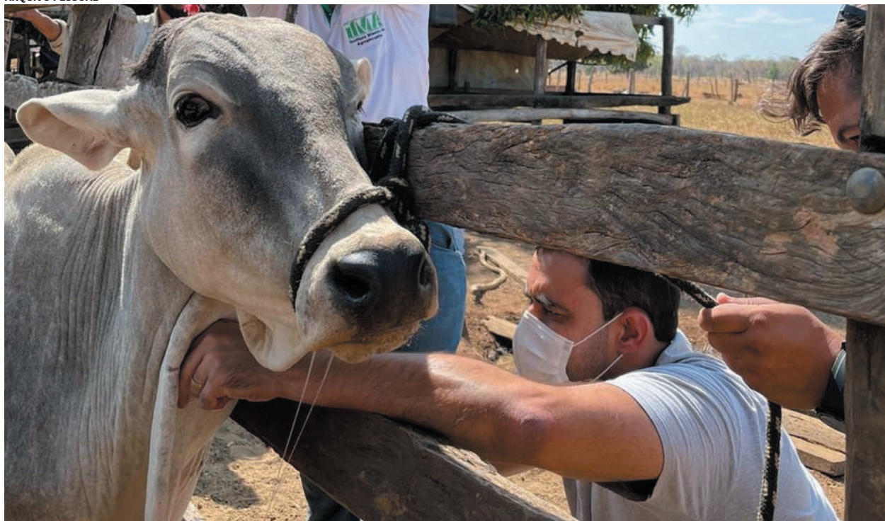
O prazo segue até 30 de junho e vale para todas as espécies de produção