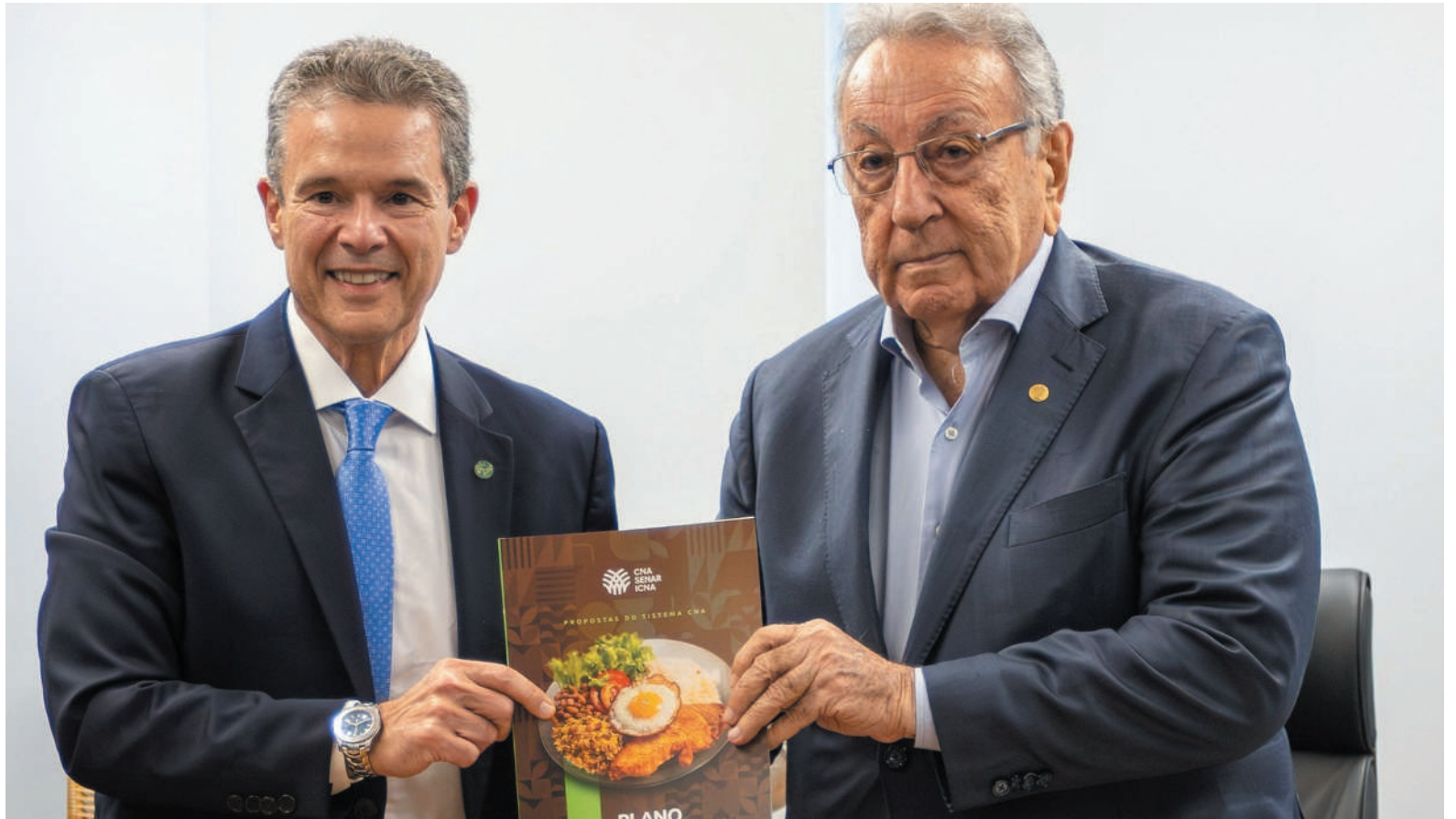
CNA entrega propostas do Plano Safra ao Ministério da Agricultura