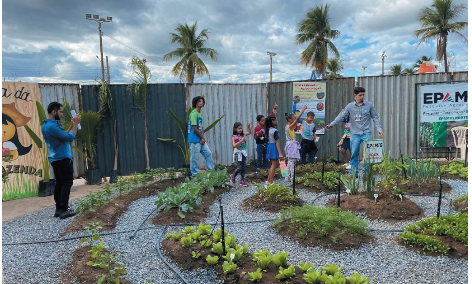
A Minifazenda reafirma seu papel como atração pedagógica da Expomontes, contribuindo para a formação de estudantes sobre a origem dos alimentos e o trabalho no campo

menta de formação. É aqui que muitas crianças têm o primeiro contato com o agro, entendem de onde vem o alimento e valorizam o trabalho do produtor rural.”