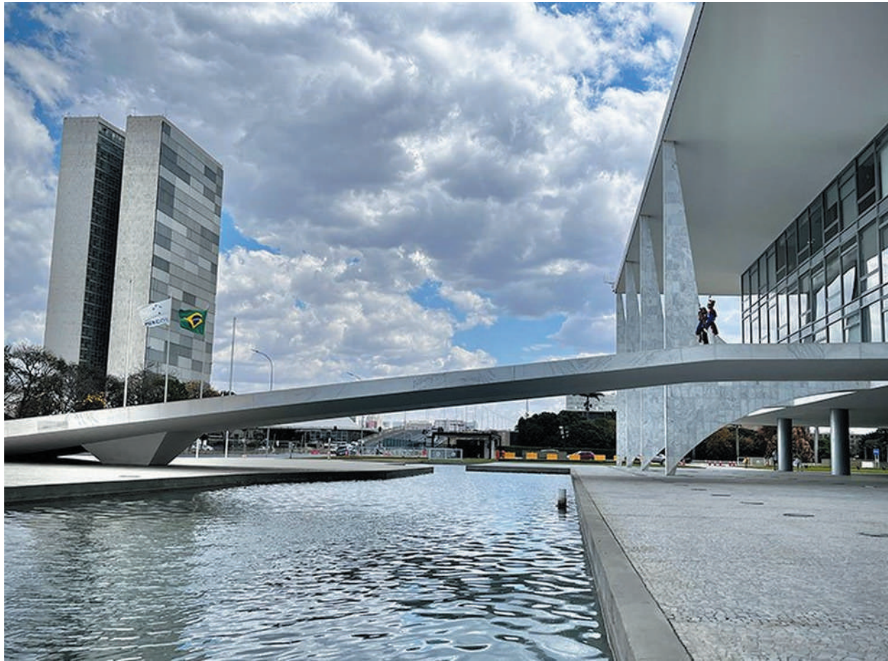
A lei foi sancionada com um veto, que ainda passará por análise do Congresso

um bem que comprometa o funcionamento de órgão público ou de estabelecimento público ou particular de prestação de serviço essencial, como distribuição de água, a pena será de reclusão de dois a oito anos.