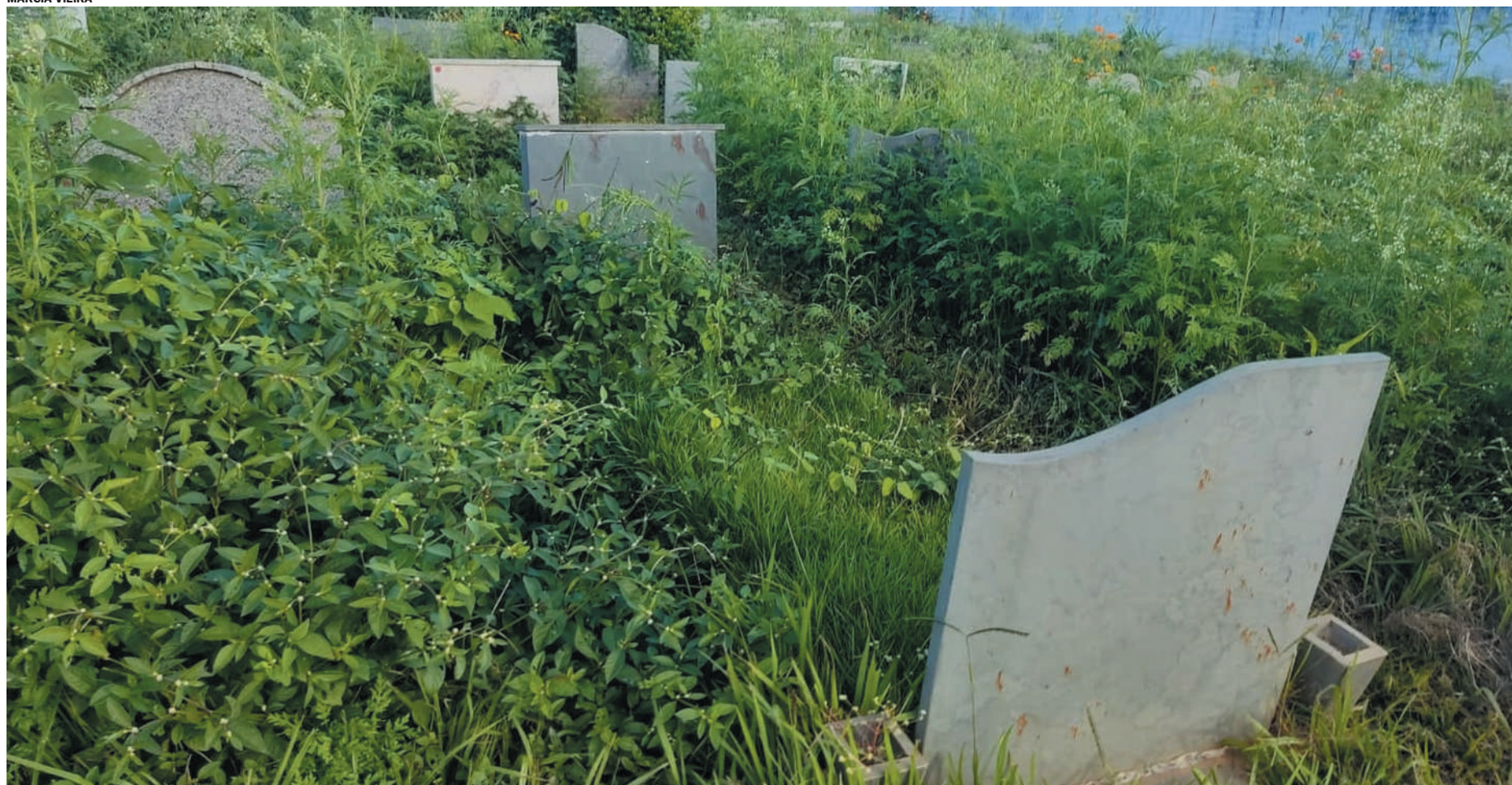
Sem manutenção: o mato nos corredores de acesso no cemitério público impede visitantes de chegar às sepulturas