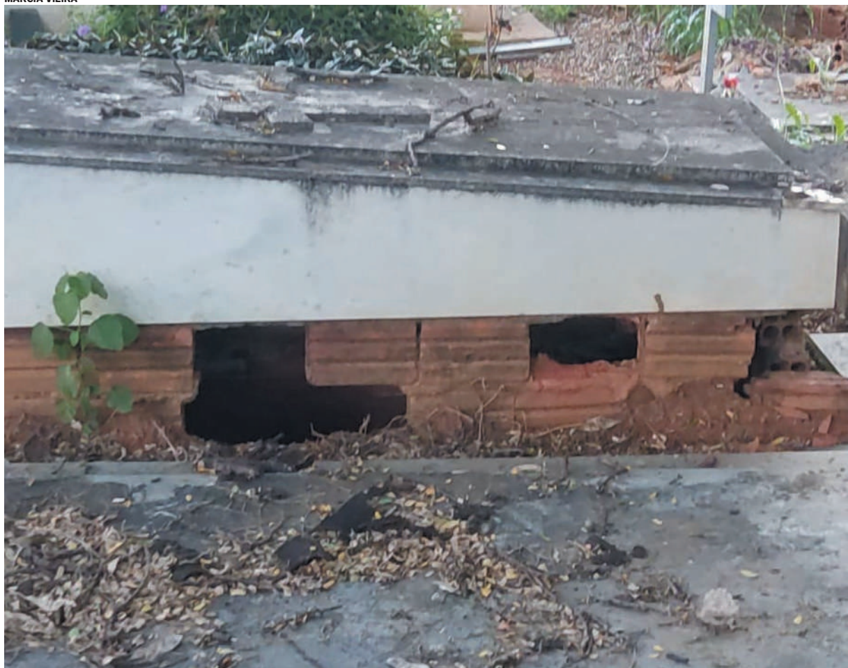
Estruturas abertas e danificadas por todo o cemitério colocam em risco a saúde de visitantes