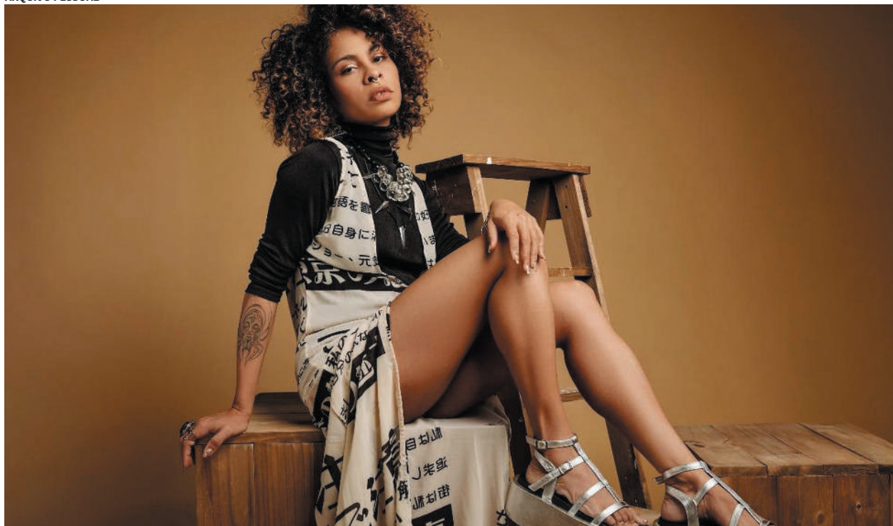
Seu trabalho integra arte, história e inclusão, ampliando visibilidade para corpos historicamente marginalizados