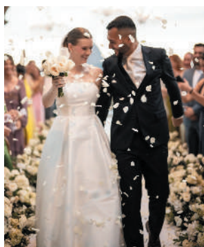
A saída aplaudidíssima dos noivos