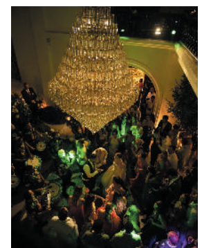
Uma sofisticada e animada pista de boate contou também com a presença de uma Bateria de Escola de Samba com mulatas, bem a cara do Rio

Aplausos para os fornecedores deste enlace cinematográfico: Estrutura e iluminação: @jordansomeluz / Bar de drinks: @bardrinkings / Buffet: @pimentarosagastronomia_ / Cerimonial: @sa-