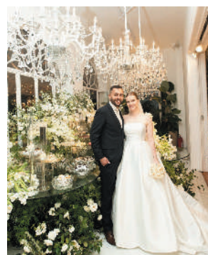
Após o Sim, os noivos receberam os cumprimentos numa elegante e animadíssima recepção na Mansão Alvite