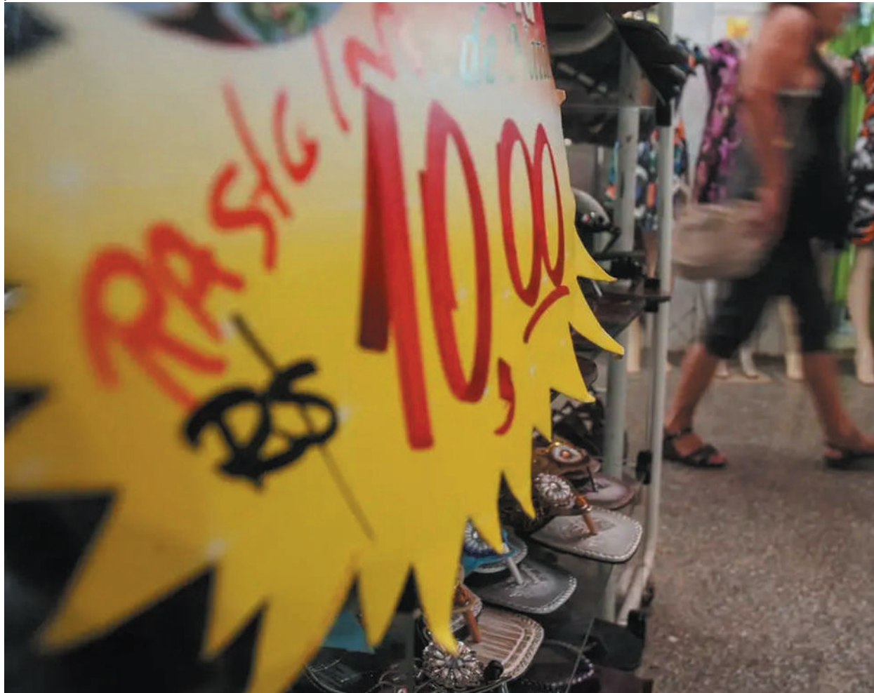
Em meio às tensões da guerra, previsão aumenta pela 5ª semana seguida

ta de inflação, o Banco Central usa como principal instrumento a taxa básica de juros, a Selic, definida atualmente em 14,75% ao ano pelo Comitê de Política Monetária (Copom) do BC. Na última reunião, mês passado, por unanimidade, o colegiado reduziu a Selic em 0,25 ponto percentual. Antes da escalada do conflito no Irã, a expectativa predominante era de um corte de 0,5 ponto.