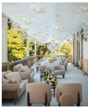
Um dos elegantes ambientes criados para receber os familiares dos noivos e convidados na Mansão Alvite