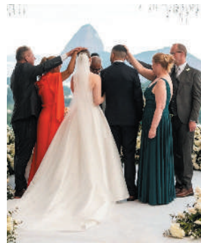
Um registro do momento da bênção dos pais dos noivos