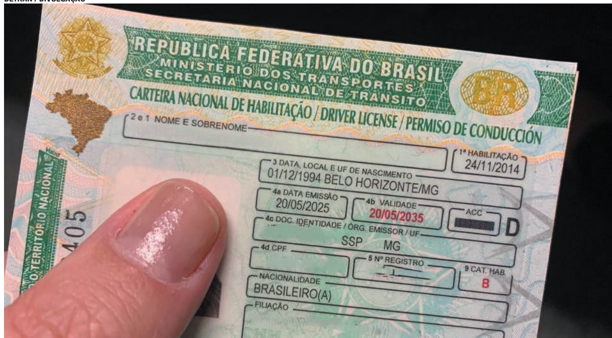
Multas leves e médias podem ser convertidas automaticamente em advertência em Minas Gerais