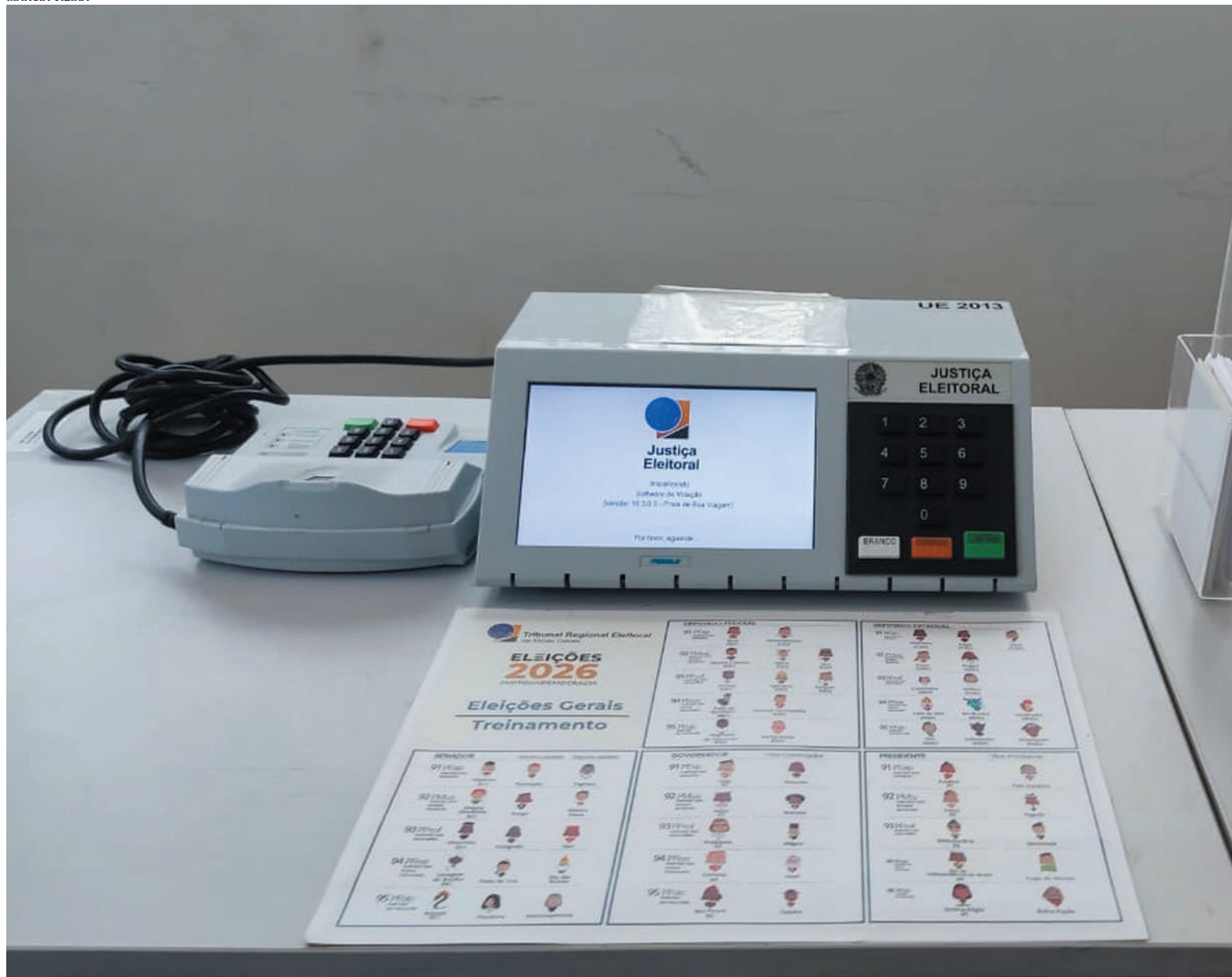
A Justiça Eleitoral atende Itacambira em 10 de abril e Claros dos Poções em 21 de abril; Patis já foi atendido

“Tem aquelas pessoas que não fizeram biometria desde 2020, mas que votaram nas eleições de 2022 e 2024. Essas estão sem biometria, mas estão com títulos regulares”, diz, acrescentando que fazem parte desse número os jovens que requeram os títulos na época da pandemia. “Ou seja, quando era possível tirar pela internet sem fazer a biometria. Temos ainda