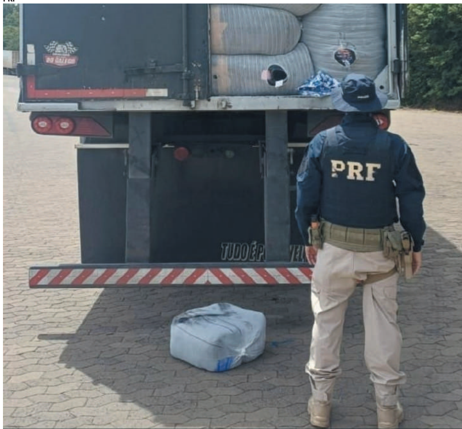
Durante a operação, uma carreta baú com roupas estrangeiras sem documentação foi apreendida