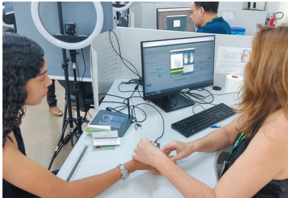
Justiça Eleitoral também realiza ações itinerantes em municípios da região