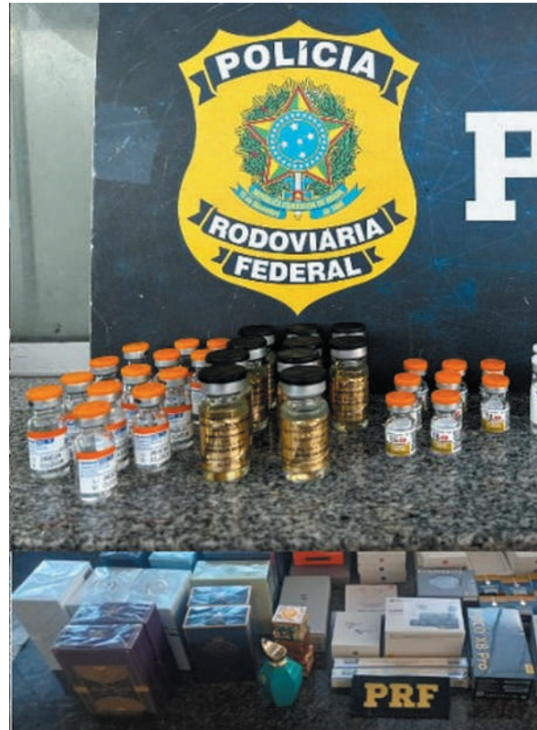
Foram apreendidos diversos tipos de produtos