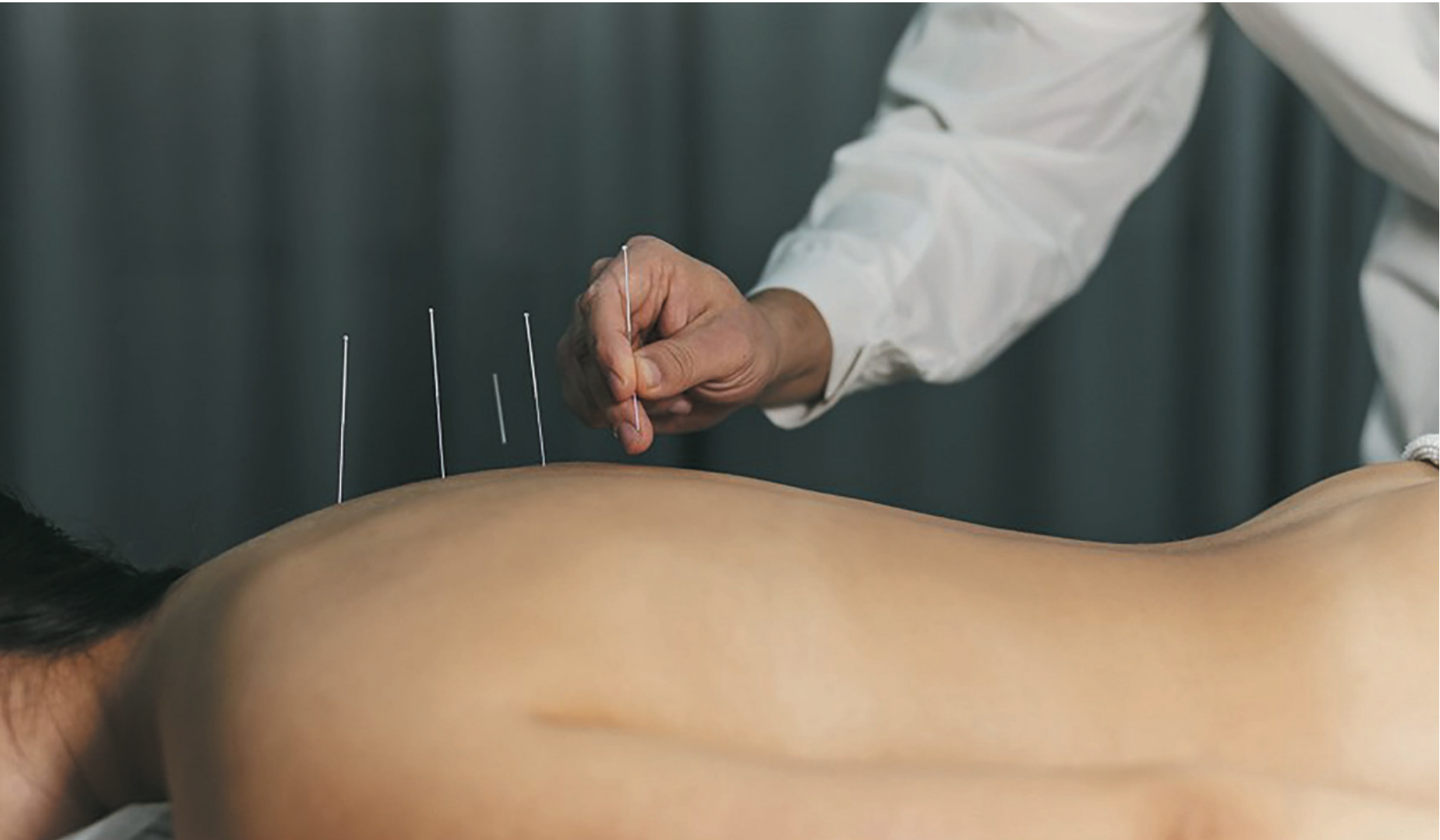
Entre outras regras, nova lei define quais profissionais poderão exercer a atividade

O exercício profissional de acupuntura está regulamentado em todo o território nacional. A Lei 15.345 foi sancionada pelo presidente Luiz Inácio Lula da Silva e está publicada no Diário Oficial da União desta semana. De acordo com a norma, a acupuntura é o conjunto de técnicas e terapias para estimulação de pontos específicos do corpo humano por meio