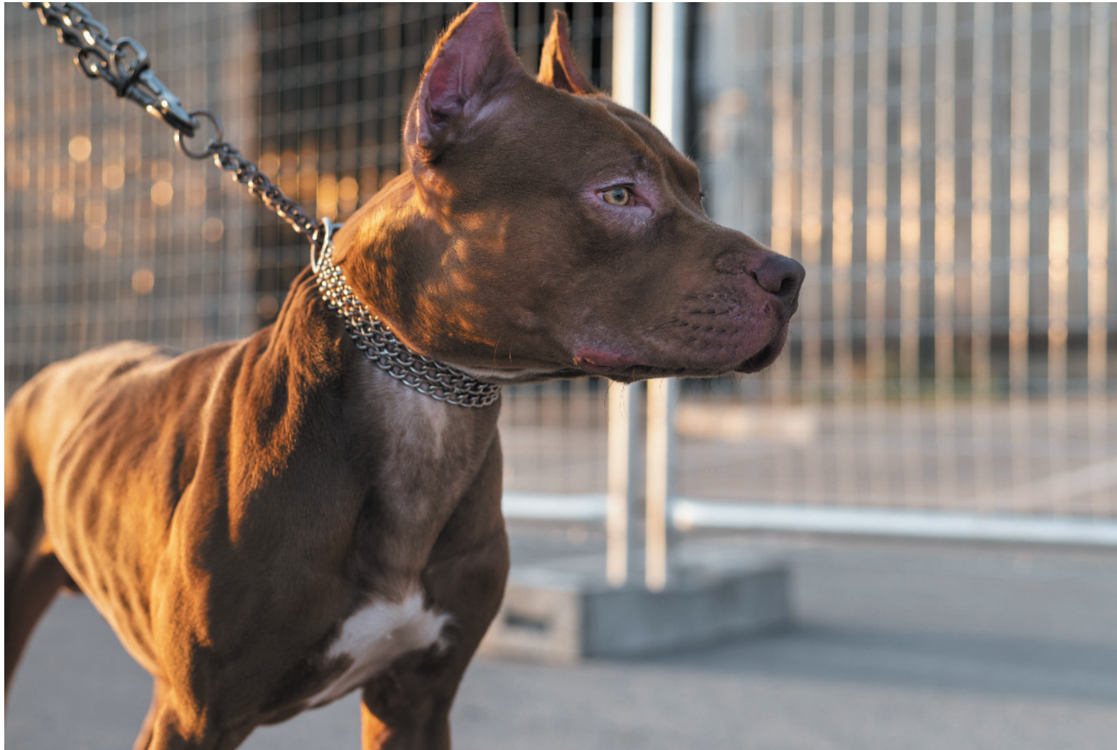
Presença de cães sem focinheira expõe frequentadores a risco em parques da cidade

relata que já foram feitas todas as reivindicações possíveis e ninguém tomou providências. “Já notificamos a prefeitura, zoonoses e corpo de bombeiros, mas ninguém tomou providências ainda. Cada um passa a responsabilidade para o outro. Então continua o risco para nós, moradores desse bairro”, diz.