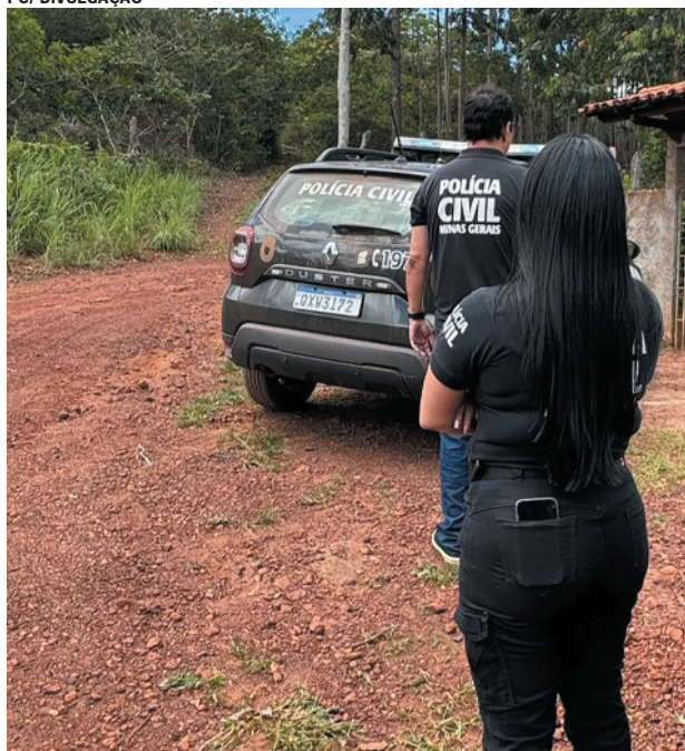
Prisão ocorreu durante cumprimento de mandado de busca e apreensão

em andamento, com a anuência e facilitação da própria mãe, que detinha autoridade legal sobre a vítima. No local, foram apreendidos aparelhos celulares, os quais serão encaminhados para perícia técnica.