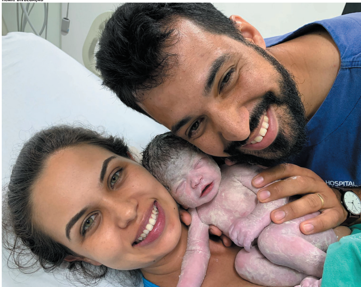
HCMR destacou a confiança da família e o cuidado prestado na chegada da primeira vida de 2026 na cidade