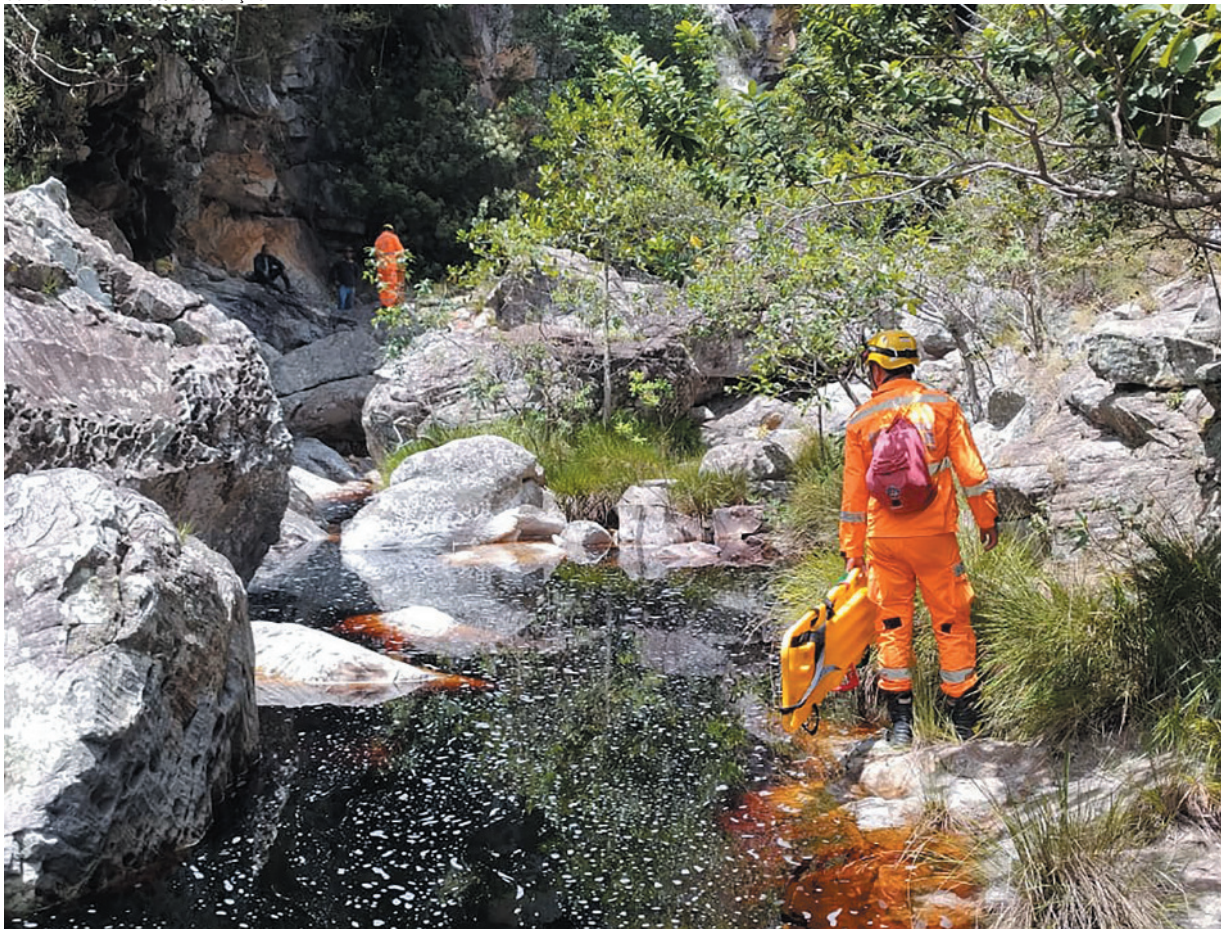
Corpo de Bombeiros alerta para riscos em cachoeiras no verão