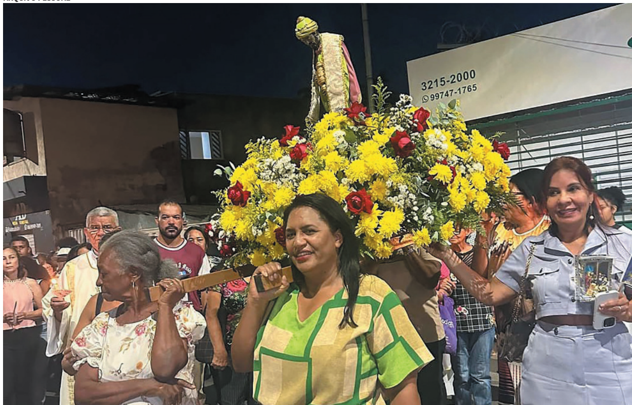
Celebração marca a Epifania do Senhor e encerra o ciclo do Natal, reunindo expressões de fé e cultura