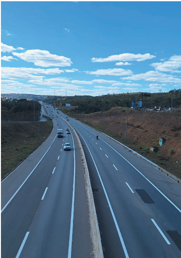
Antes de iniciar a viagem é preciso definir o trajeto e programar paradas para descanso