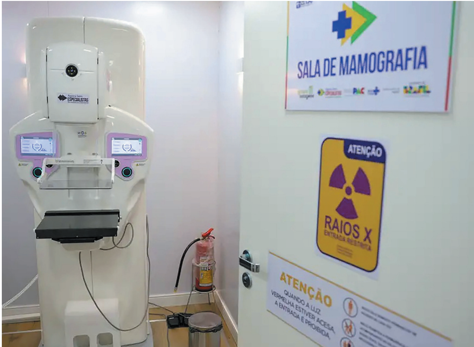
Faixa etária de 40 a 49 anos concentra 23% dos casos de câncer