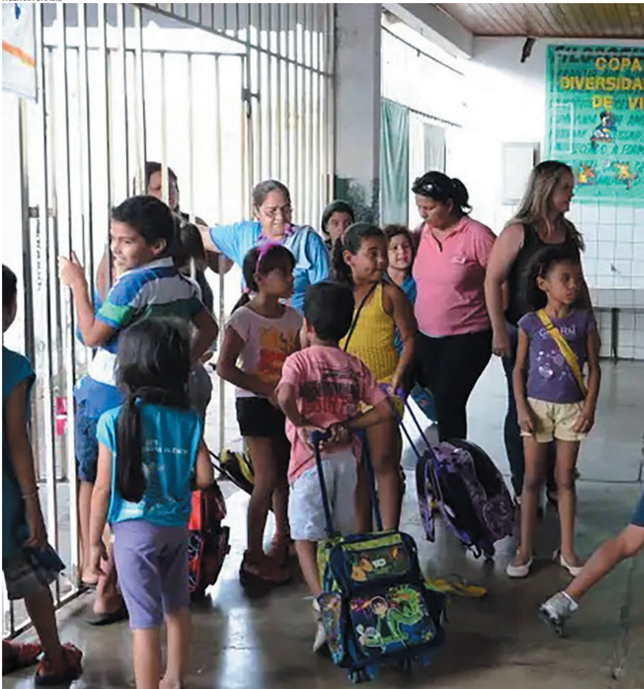
De acordo com o estudo questões de raça, gênero e deficiência influenciam também no acesso à creche.

O CadÚnico é um registro administrativo que reúne informações socioeconômicas de famílias de baixa renda no Brasil, como escolaridade, renda, condições de moradia e matrícula esco-