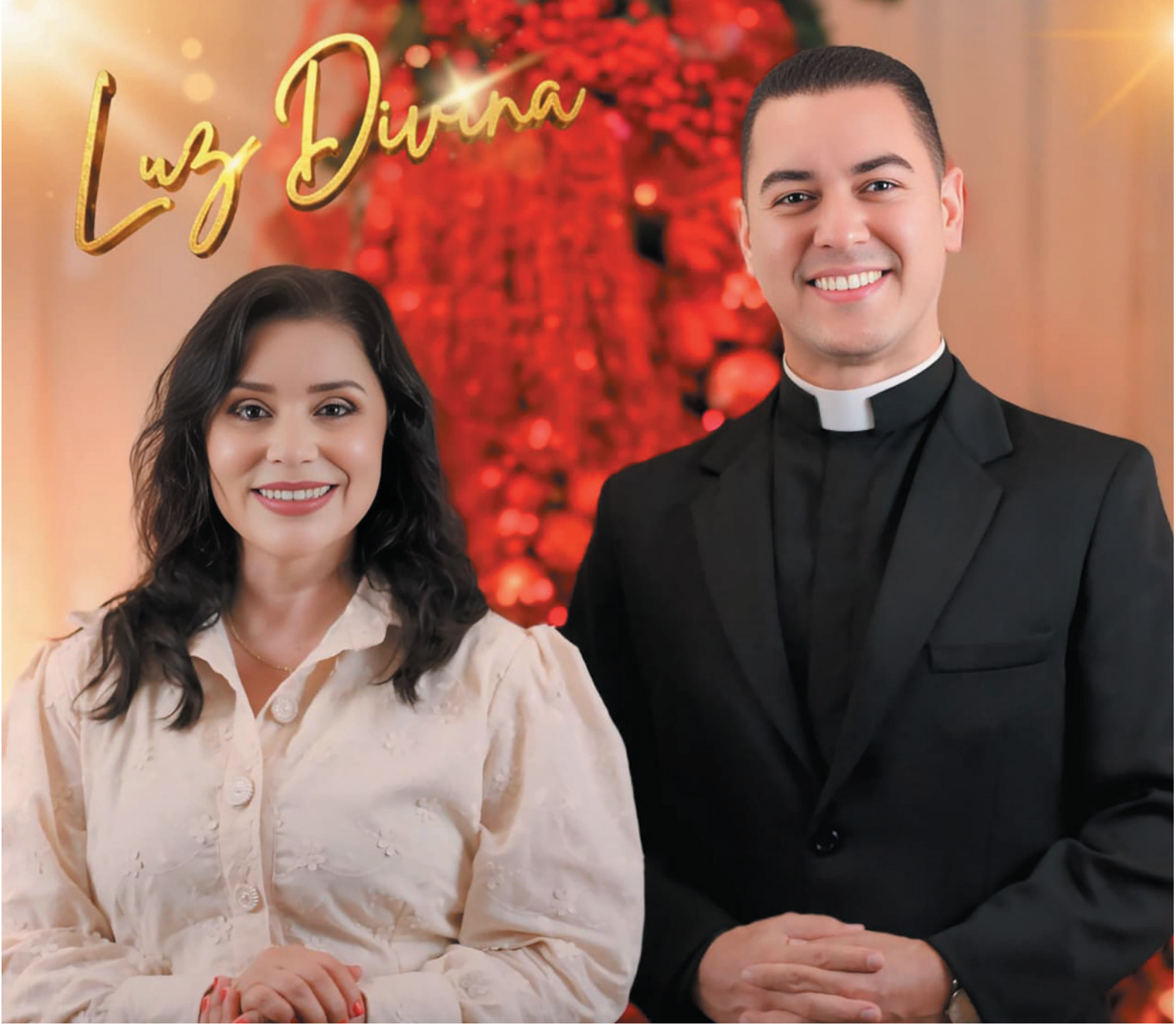
A canção natalina “Luz Divina”, com mensagem de amor e esperança, foi um convite para as pessoas abrirem o coração

sica, a essência dessa corrente do bem. Com uma linguagem sensível e uma estética marcada pela espiritualidade, a produção amplia a mensagem da campanha, levando o Natal para além dos muros da Catedral e tocando corações por meio da arte.