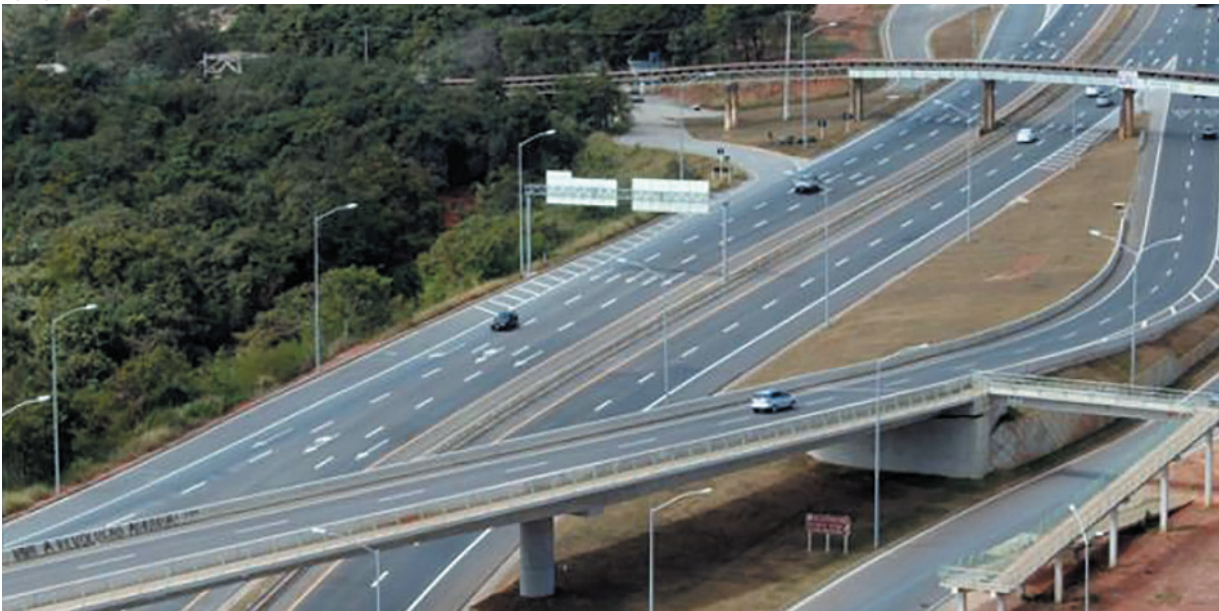
os cuidados devem começar antes mesmo da viagem, com a conferência dos documentos do veículo