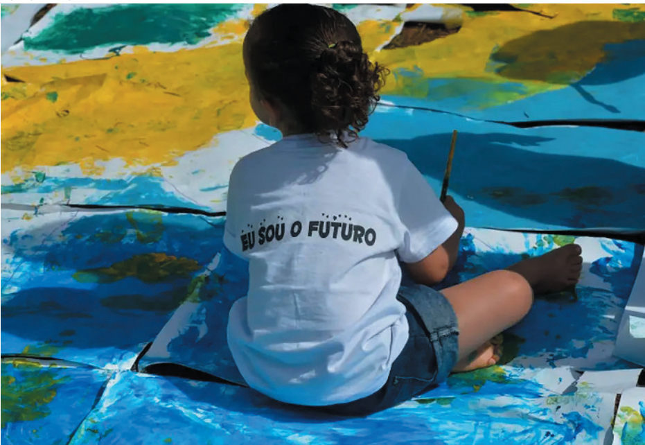
Desigualdades sociais dificultam acesso à educação infantil no Brasil