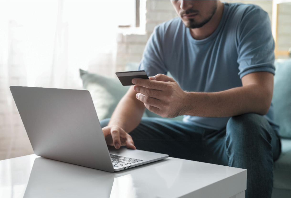
O diretor destaca a importância de verificar a autenticidade do site e estar atento a links duvidosos ao realizar compras online