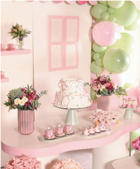
Uma celebração preparada com cuidado e muita doçura.