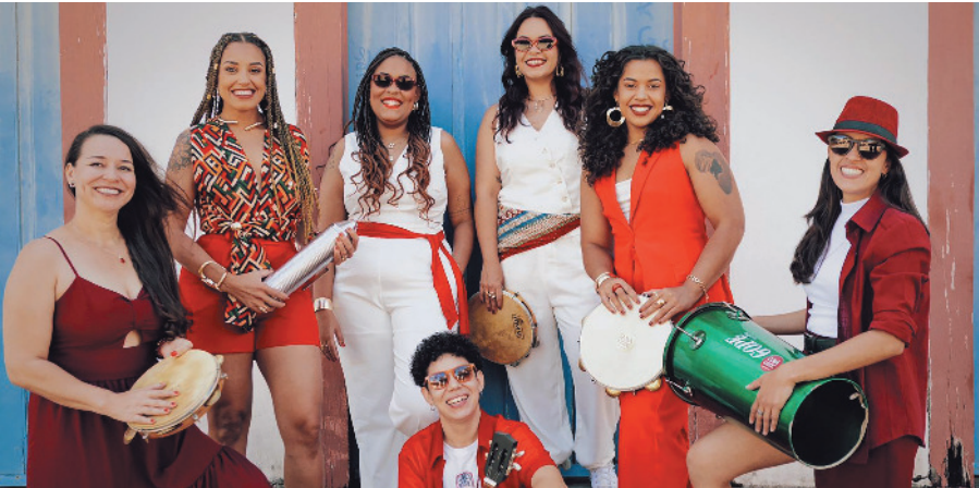
Banda Saia Godê: som envolvente que anima qualquer festa