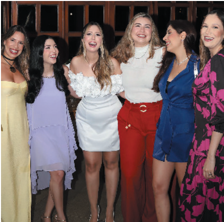
Um encontro cheio de afeto, música leve e sorrisos sinceros