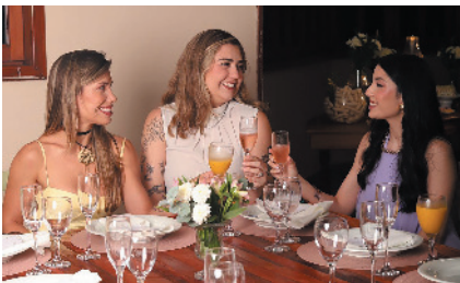
Cada gesto, cada oração e cada abraço tornaram o dia ainda mais especial