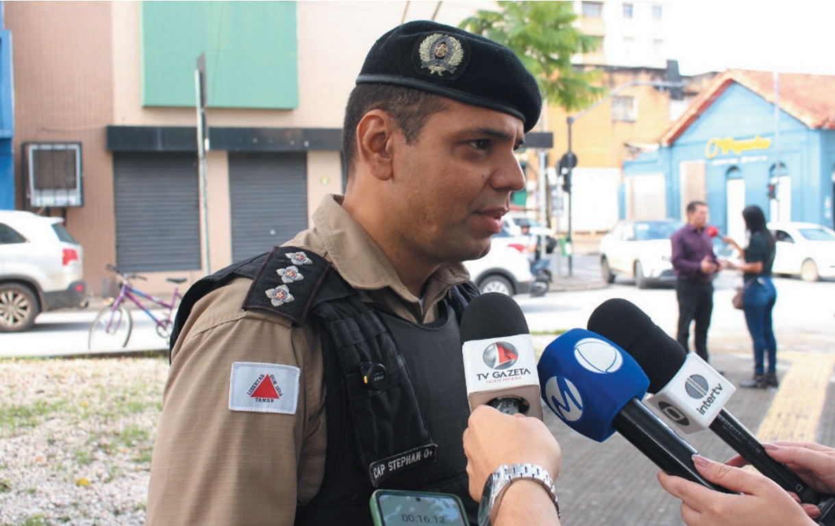
PM alerta: crimes de oportunidade aumentam com distrações como uso descuidado de celular em público

Leonardo Queiroz leonardoqueiroz.onorte@gmail.com A manhã desta segunda-feira (8) marcou o lançamento oficial da Operação Natalina 2025 na área da 11ª Região de Polícia Militar, durante cerimônia realizada na Praça Coronel Ribeiro. A ação, que acontece simultaneamente nos 77 municípios sob responsabilidade da unidade, reforça o policiamento e intensifica estratégias de prevenção criminal no período de maior movimento no comércio, típico das compras de fim de ano. Com foco na redução de crimes contra o patrimônio, especialmente furtos e roubos, a Operação Natalina se baseia na ampliação da presença policial, no patrulhamento ostensivo e na aproximação com a comunidade. Segundo o