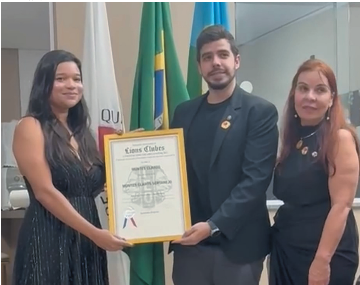
Programa juvenil do Lions desenvolve ações de serviço, cidadania e integração