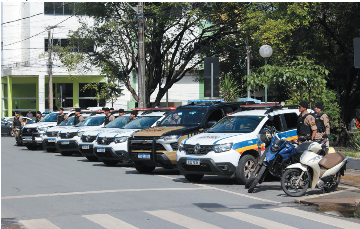
PM destaca que muitos crimes no período são de oportunidade e pede apoio da população