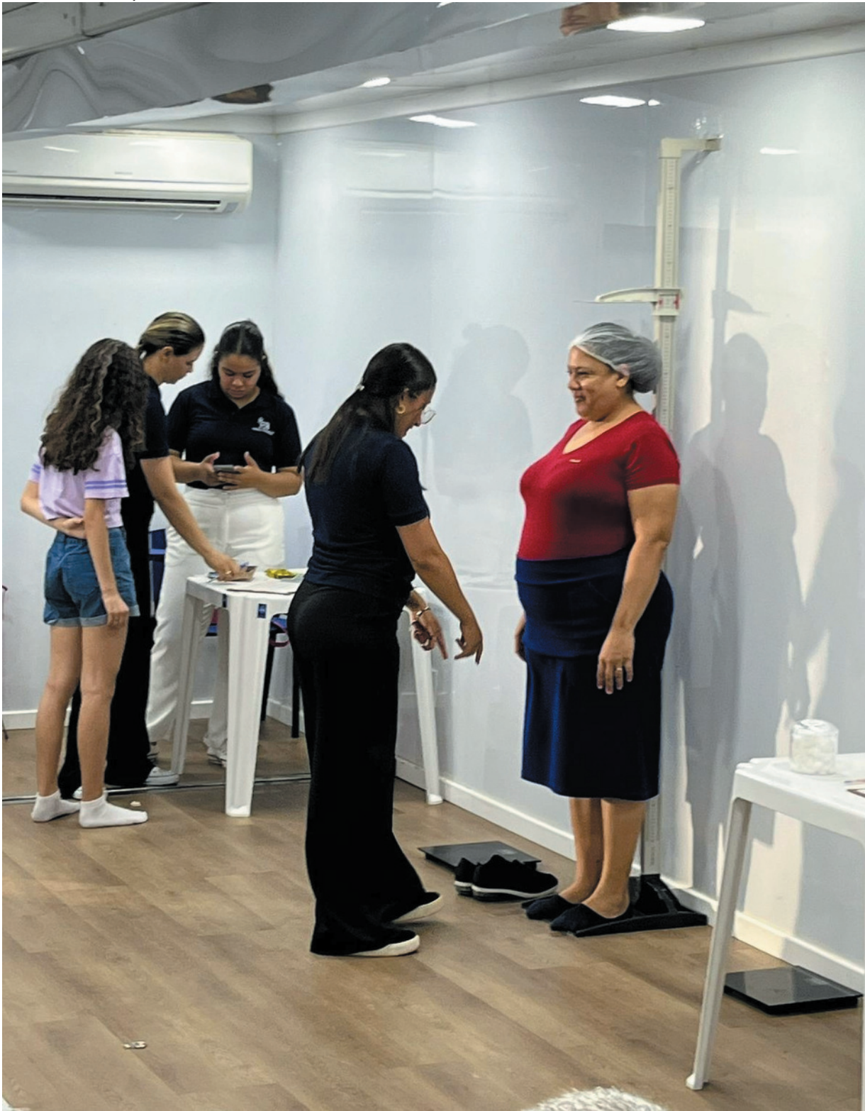
Novo Nordisk realiza ação gratuita de saúde em Montes Claros e reforça compromisso com diagnóstico precoce

combate à obesidade e ao diabetes. Essa é uma forma concreta de reforçar o compromisso da Novo Nordisk com