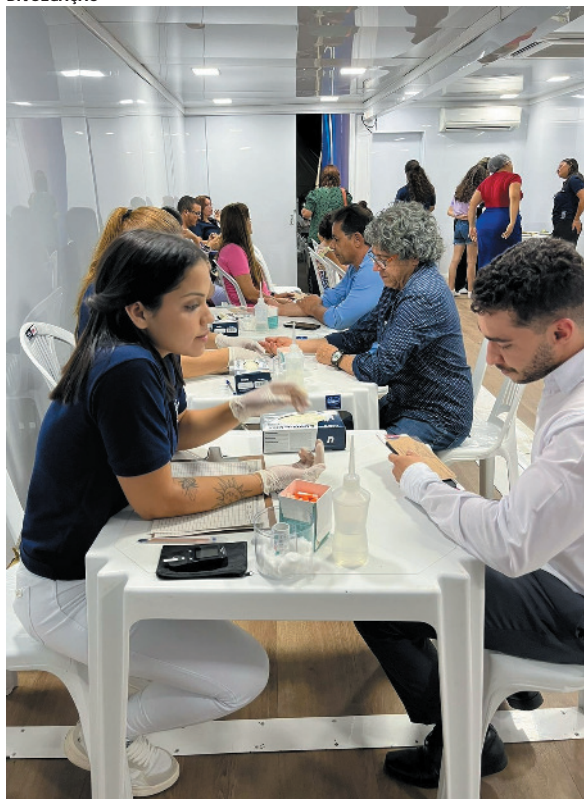
Ação pretende aproximar informação e cuidado