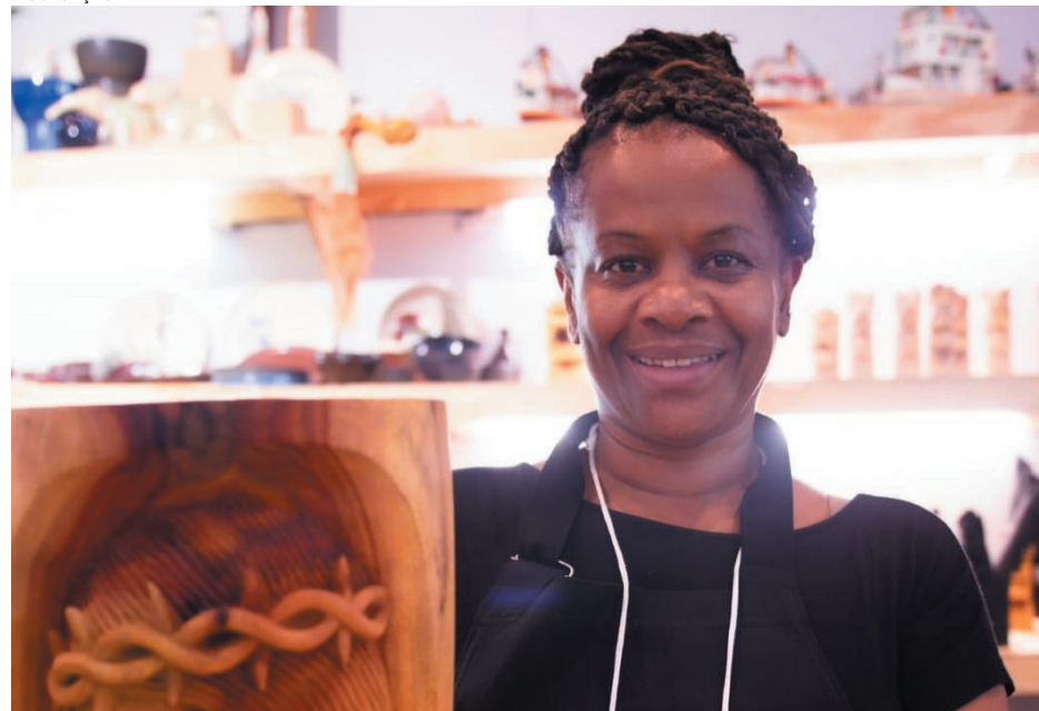
Participação amplia visibilidade, gerando oportunidades de negócios