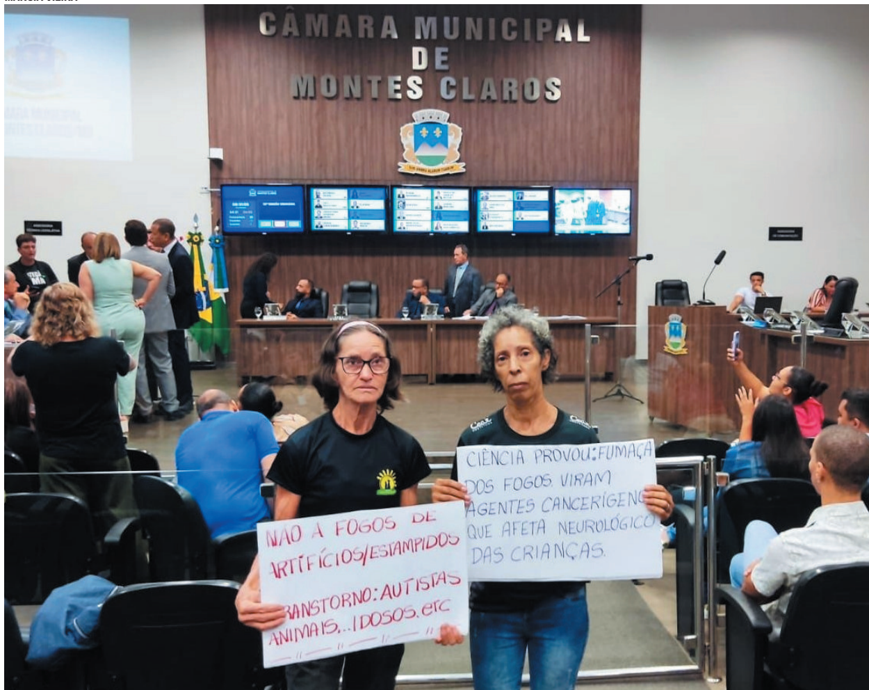
Pressão popular leva Câmara a vetar fogos com estampido em Montes Claros