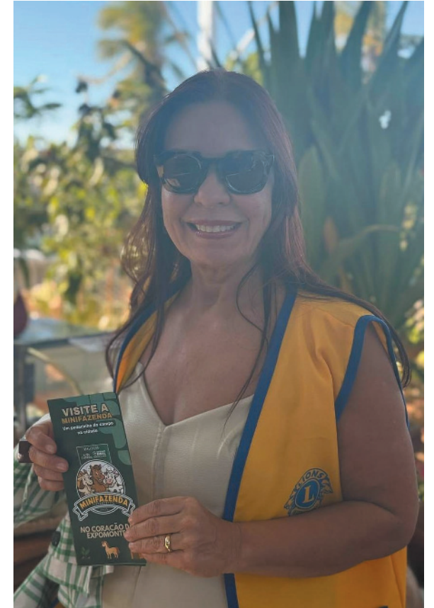
Entidade já plantou mais de 20 mil árvores em MOC