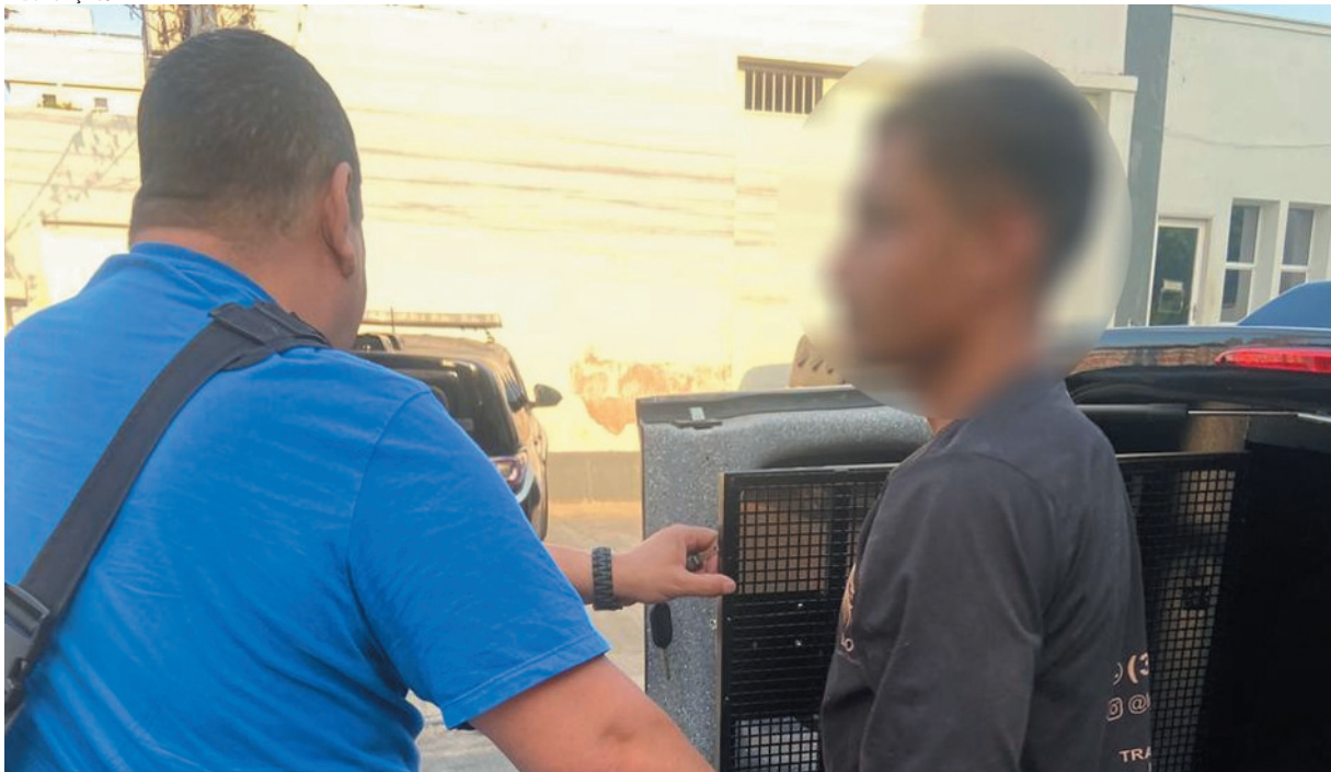
Prisão preventiva decretada após recurso do ministério público; delegada enfatiza importância da denúncia