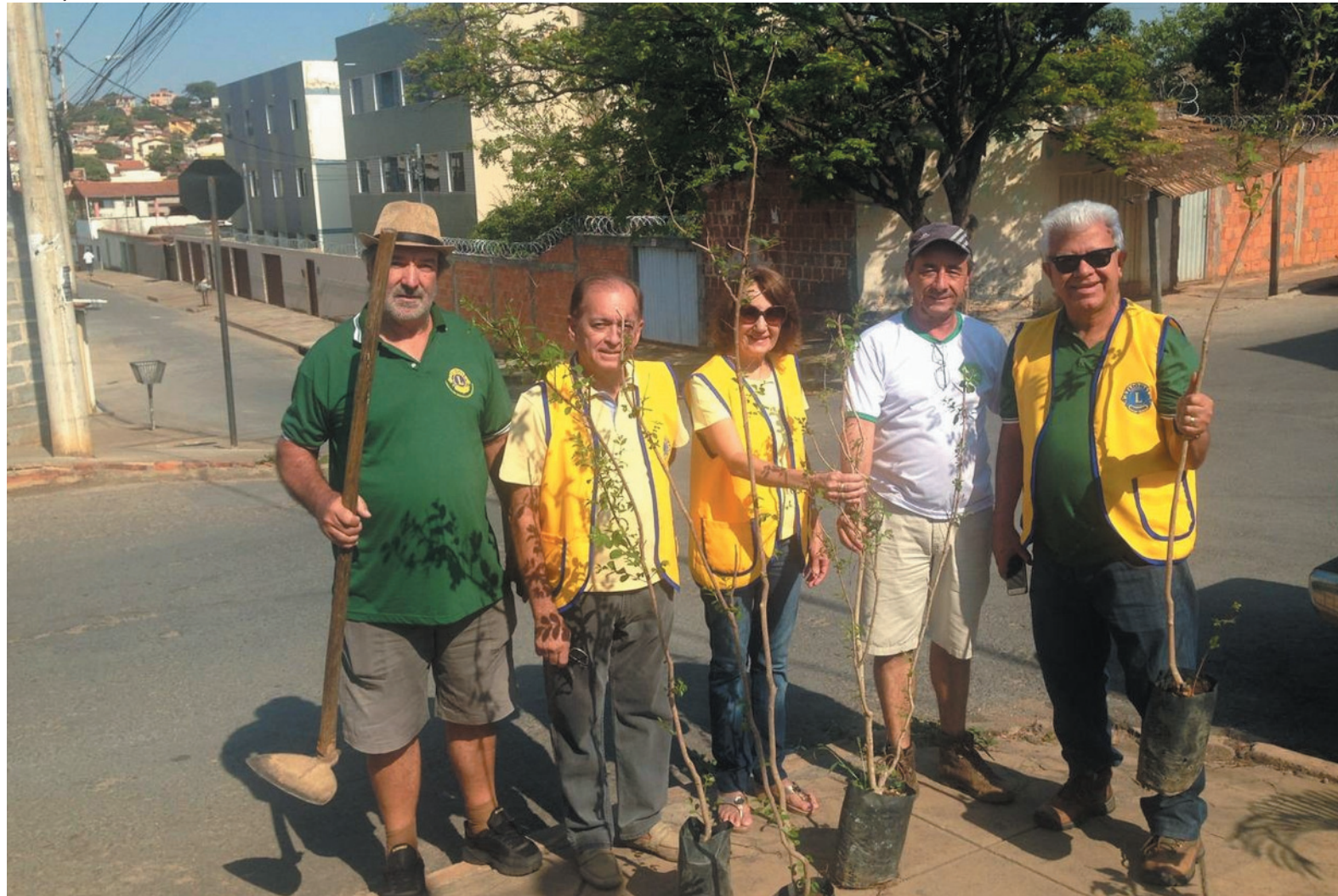
Ao longo de 48 anos, Lions já promoveu o plantio de cerca de 20 mil árvores na cidade

mudanças climáticas que afetam o planeta Terra como um todo. Ela lembra que a atividade está sendo realizada por todos os Lions do país e do mundo. “O clube optou por distribuir as mudas, pois não é recomendável fazer o plantio nesta época do ano, por causa do forte calor. Por isso, faremos um trabalho com cada morador que receber a muda, para que ele faça o plantio com responsabilidade”.