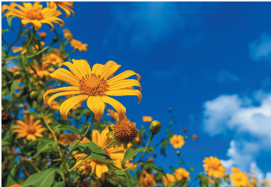
Estação é marcada pelo colorido das flores