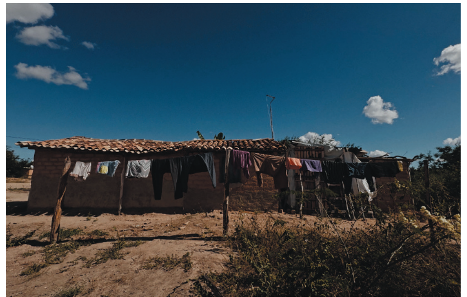
Depois da exibição no Cinemais do Montes Claros Shopping, o público assistiu o documentário no Museu Regional