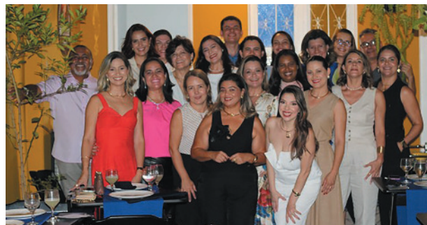
O encontro reuniu alta gastronomia, empreendedorismo e troca de experiências.