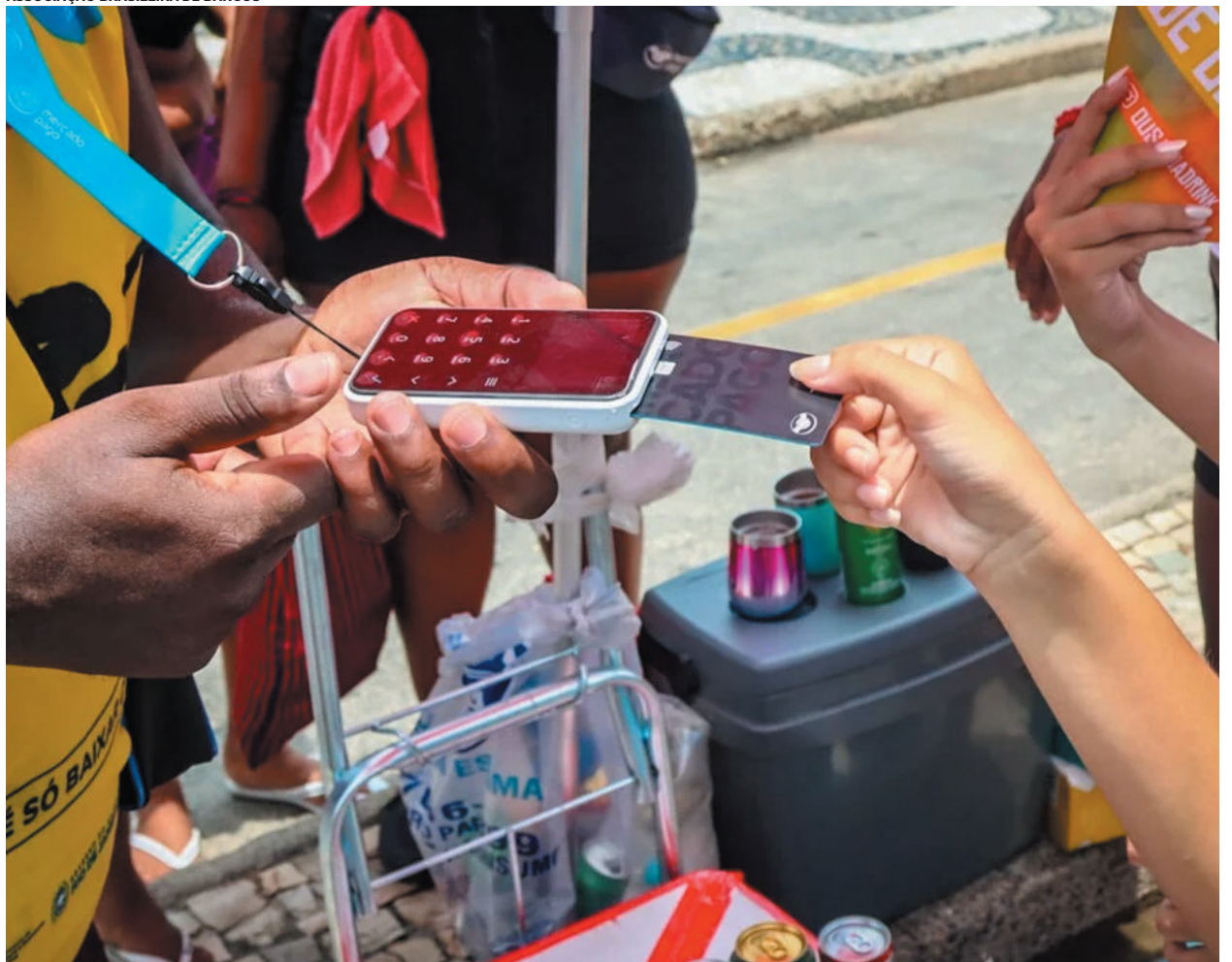
PC orienta os foliões a levarem poucos pertences e ativarem múltiplas camadas de segurança nos celulares