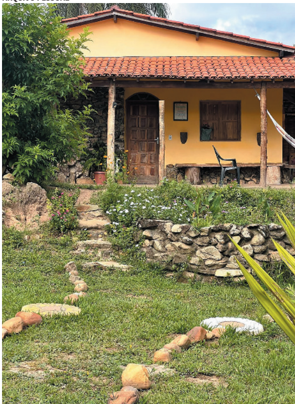
Rancho Alma da Lua é um dos destaques