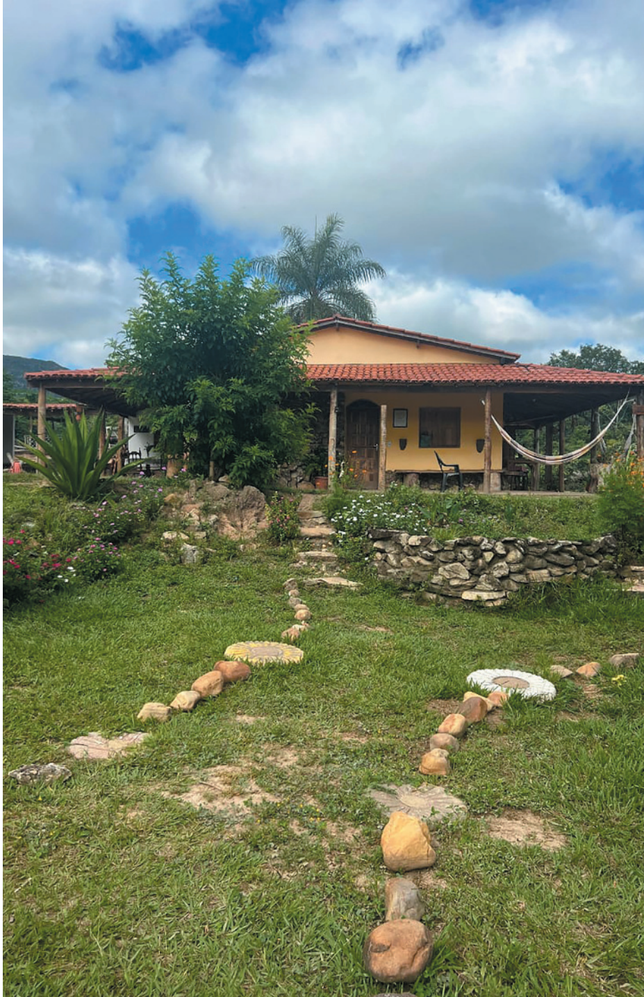
Rancho Alma da Lua, em Botumirim, foi incluído no catálogo de experiências da Emater - MG

cidade polo, temos um local pouco explorado, mas de muito potencial. Essa referência vai aumentar a demanda e nós estamos preparados para receber os turistas da