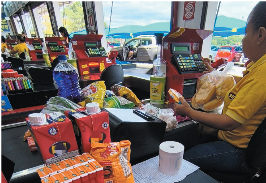
Especialistas alertam para a continuidade da alta nos próximos meses