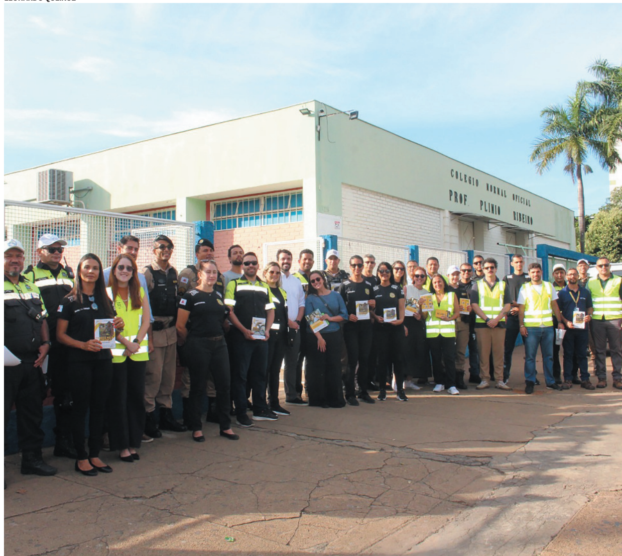
Na blitz, distribuíram folhetos e fizeram abordagens para incentivar segurança e prevenir acidentes no trânsito escolar

uma maneira mais dinâmica e lúdica. “Trazemos elementos importantes de uma pauta que tem impacto na vida de todos nós. Seja o pedestre, seja o condutor, a regra de trânsito é muito necessária. É o cuidado à vida e esse tipo de ação nas escolas. No momento em que temos famílias, muitos pais trazendo quem eles amam para entregar para a escola, a gente consegue, de maneira não ostensiva, como uma