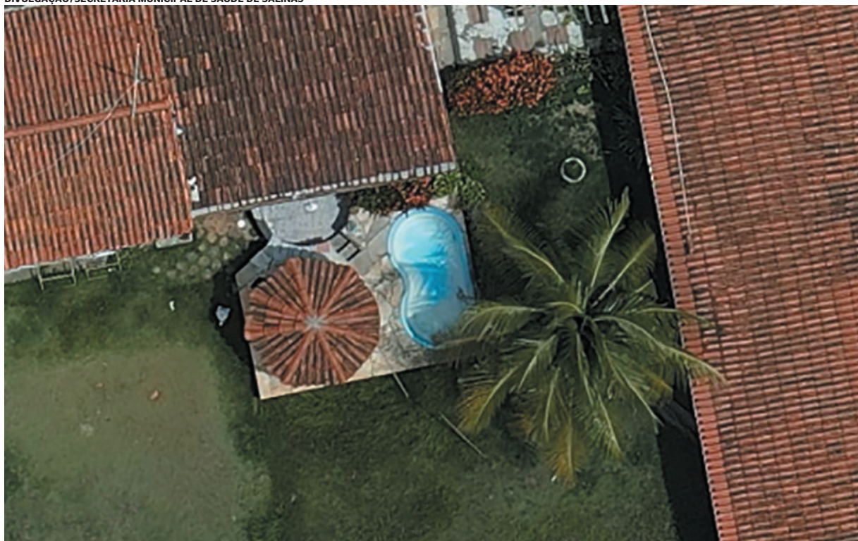
Imagem aérea de Salinas capturada por drone