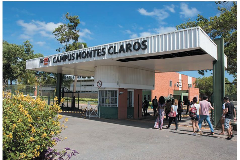
Minas Gerais lidera em vagas, e o resultado será divulgado em 26 de janeiro