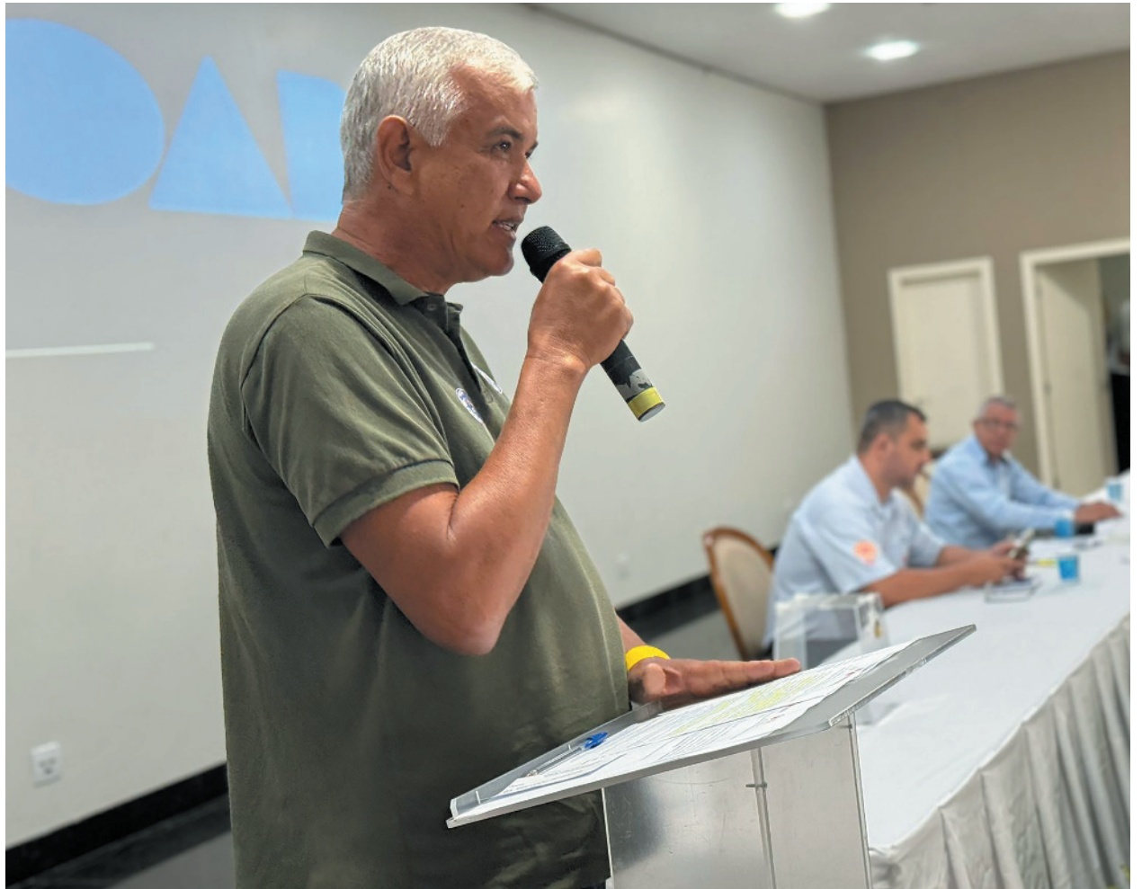
A chapa vencedora também ressaltou o impacto positivo do serviço, como o transporte aéreo de pacientes