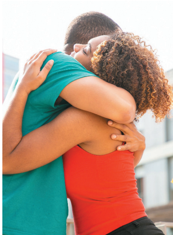
Ação é essencial na experiência humana