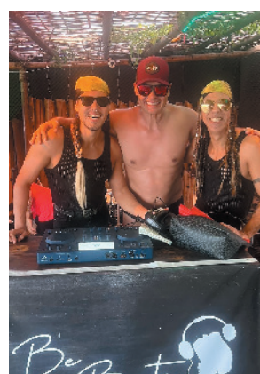
Os rapazes do Be Boots deram aquele show que faz o tempo parar no Corujão...