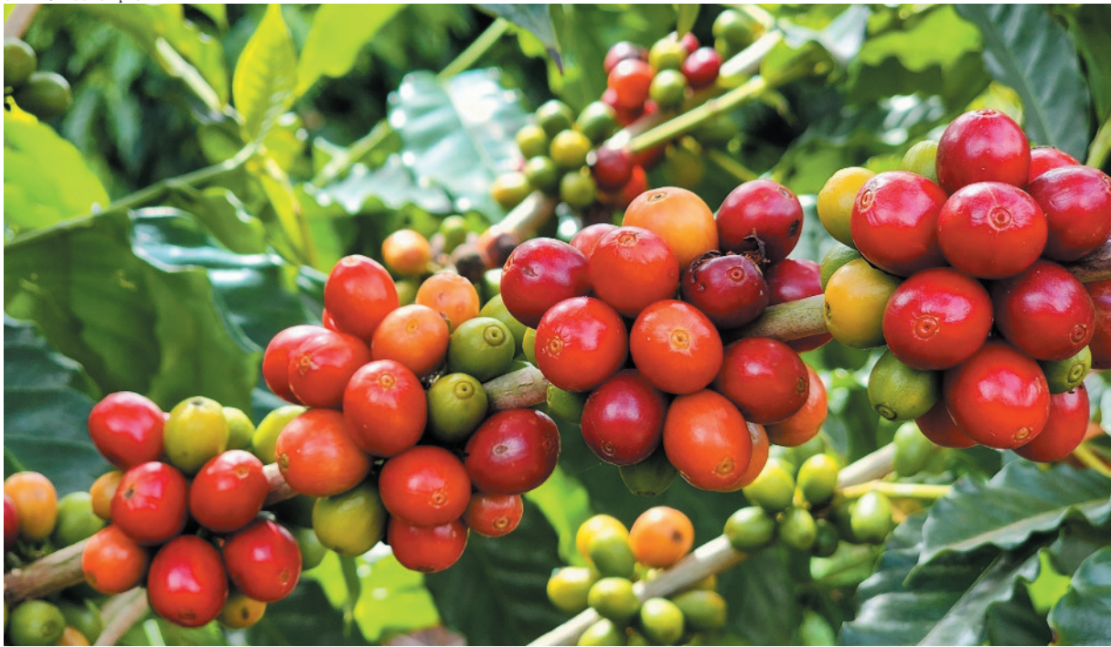
Bom desempenho é puxado pela valorização e aumento da demanda do café