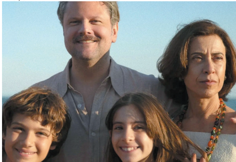
Filme segue em cartaz até a próxima quarta-feira (15) na cidade