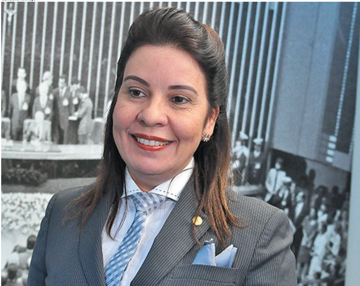
O Fundeb terá aumento de 21% em 2025, com previsão de 23% em 2026