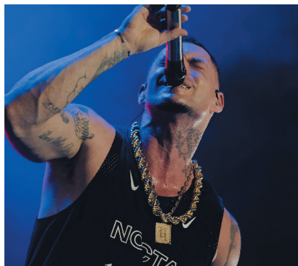
Neste sábado, 11 de janeiro O rapper Filipe Ret apresenta sua turnê comemorativa "15 Anos de História" no Boa Beach em Porto Seguro

Não perca essa experiência única na Bahia neste sábado. Para mais informações, acompanhe o Instagram oficial da festa: @pluga.eventos.