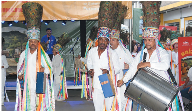
Primeiro Terno de Catopês nossa Senhora do Rosário

O evento conduziu os participantes por diversos pontos históricos, turísticos e culturais, como a Mercado Municipal, Corredor Cultural, Centro Cultural, Igreja da Matriz e a Igreja Nossa Senhora do Rosário e finalizou com o Festejo Cultural na sede do Sesc Montes Claros com apresentações de música e dança tradicionais da região (Terno de Pastorinhas Rainha da Paz, Primeiro Terno de Catopês de Nossa Senhora do Rosário, Cirandinhas, Grupo de Folia Mont Serrat, Concerto Afrolírico e outros.