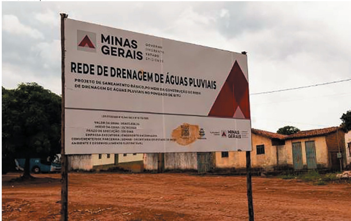
Serviços de drenagem pluvial beneficia mais de 500 pessoas no Norte de Minas