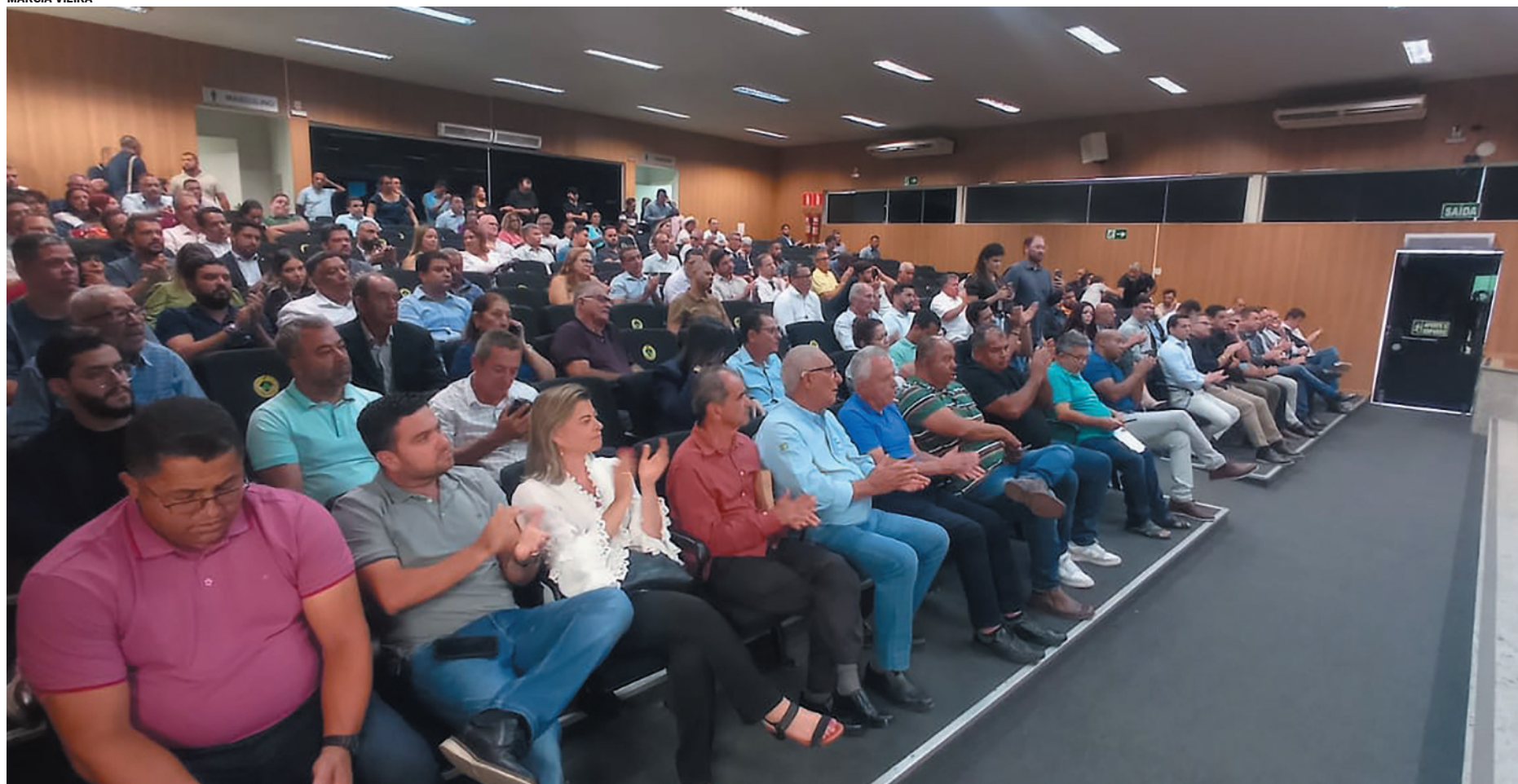
As eleições para ambas as presidências ocorreram sem disputa, com candidaturas únicas