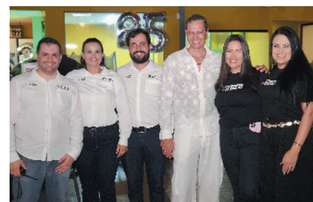
Este colunista com a elogiadíssima equipe da Casa Vittelo