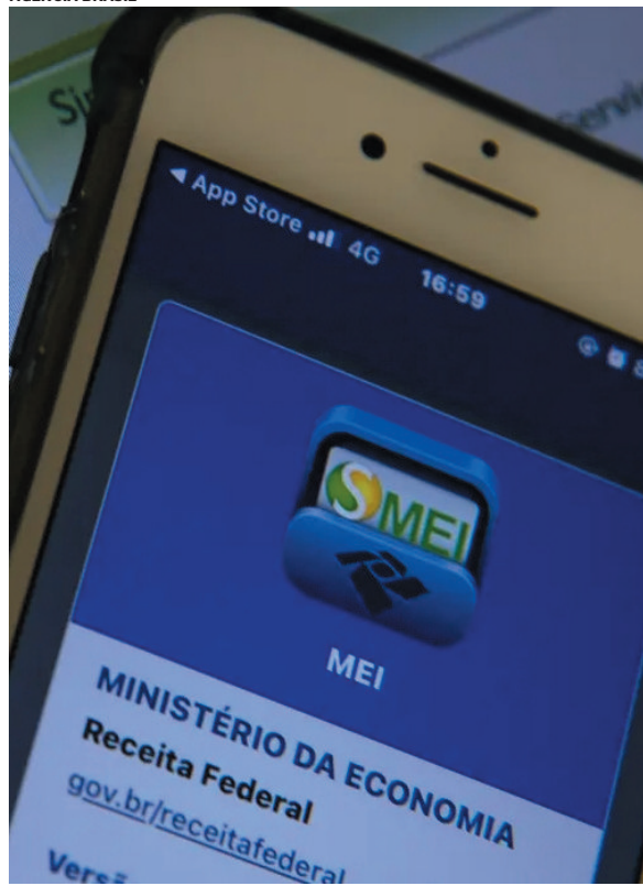
Educação financeira é essencial para adaptação