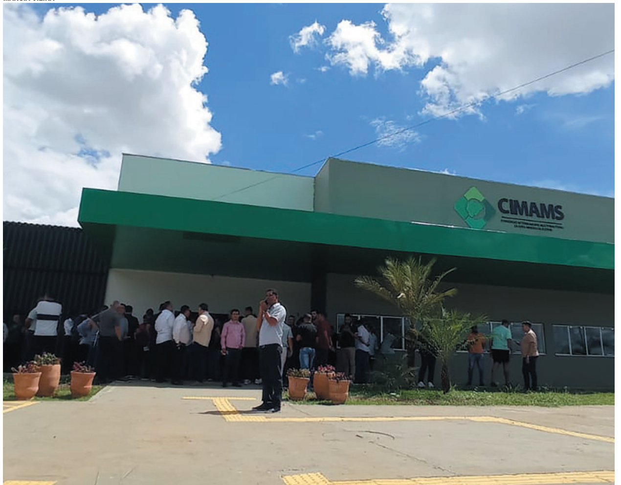
A eleição foi conduzida por três membros do Cimams e dois fiscais por chapa