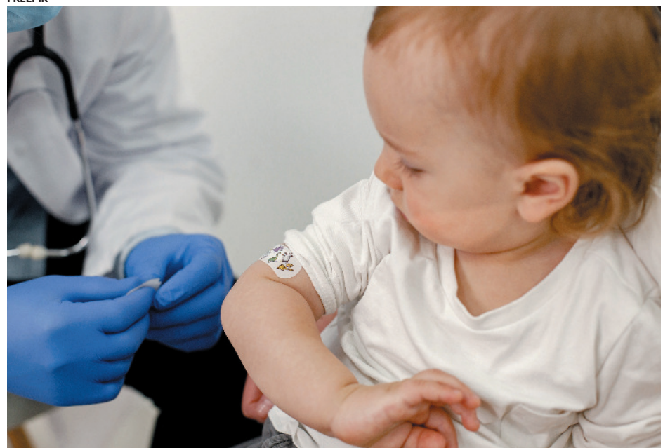
Desde 1989, o Brasil não registra casos de pólio