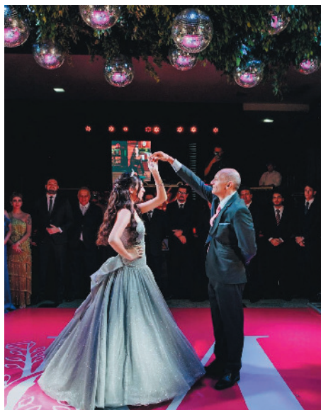
Dançando a linda e tradicional valsa com o seu emocionado pai