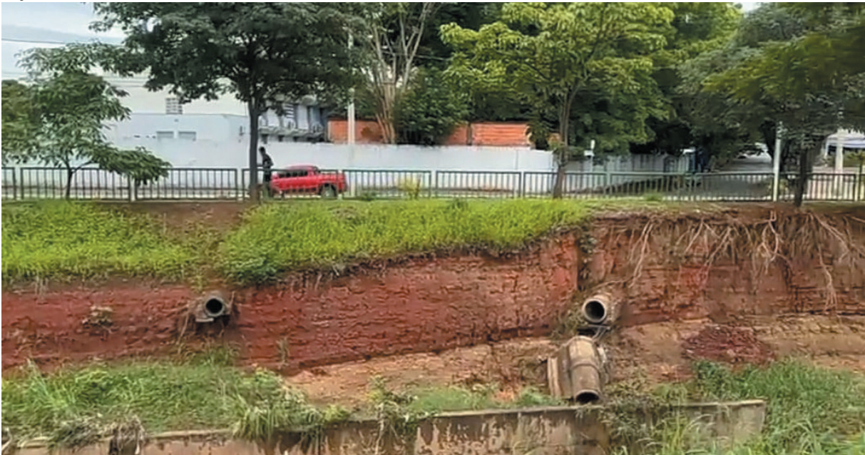
Especialistas apontam que a má distribuição das chuvas e o planejamento inadequado agravam situação