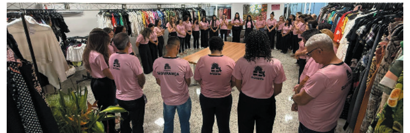
Colaboradores em ação para iniciar os trabalhos