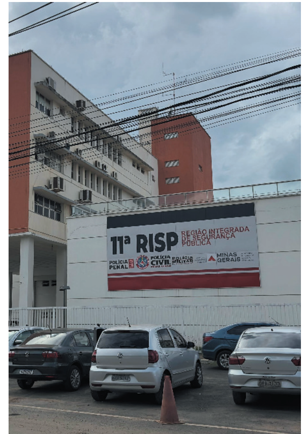
PC encerra o ano reforçando seu compromisso