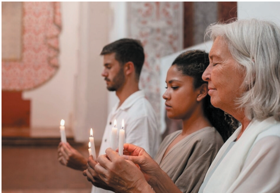
Apesar da diversidade, as religiões buscam a paz e o equilíbrio para o novo ano