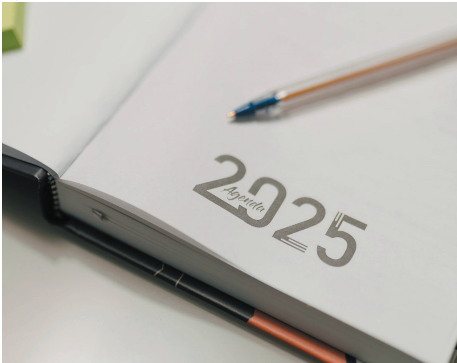
Governo divulgou o calendário nesta segunda-feira (30)

Administração Federal antecipar ponto facultativo em discordância com o que dispõe a portaria. Também está vedado adotar ponto facultativo estabelecido pela legislação estadual, municipal ou distrital, ressalvados os feriados em comemoração à data magna do estado.”