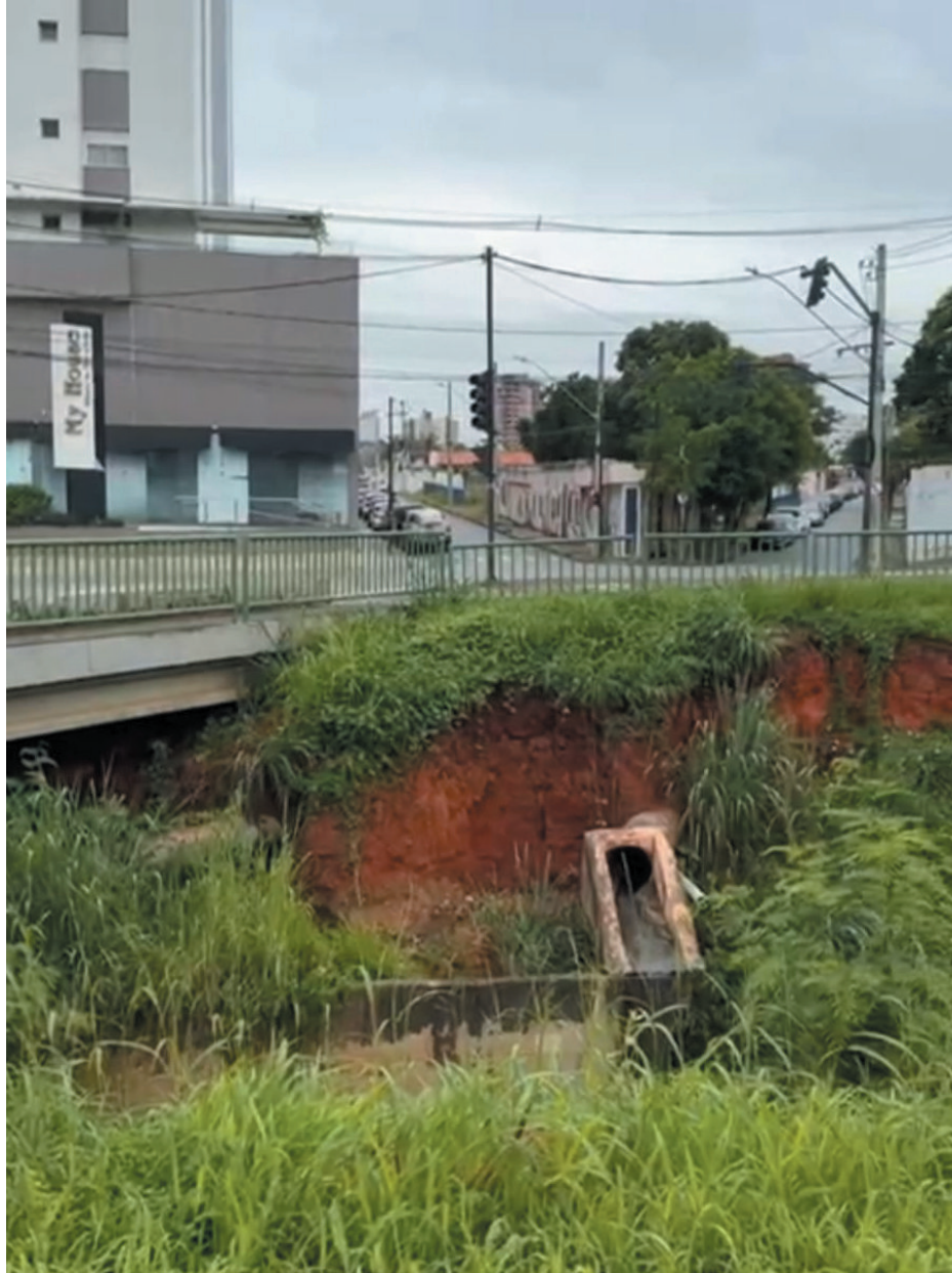
Moradores exigem uma resposta urgente do poder público sobre a situação

com a evolução do problema. “A área onde está ocorrendo o desmoronamento da terra é muito movimentada. Uso com frequência para me deslocar ao trabalho e fazer caminhadas. Estou me sentindo inseguro em continuar utilizando a calçada, mas observei que muitos continuam e pode resultar em uma tragédia”, disse.