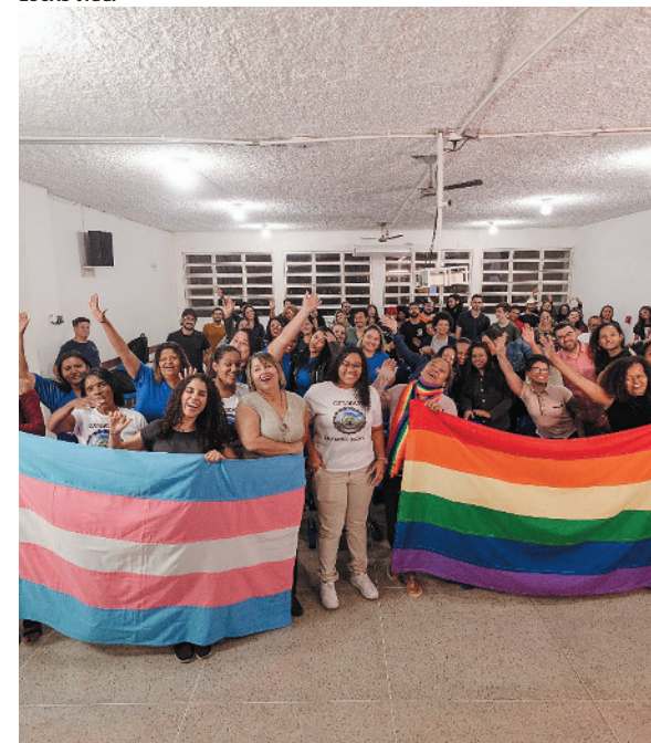
Evento destacará o impacto das ações sociais