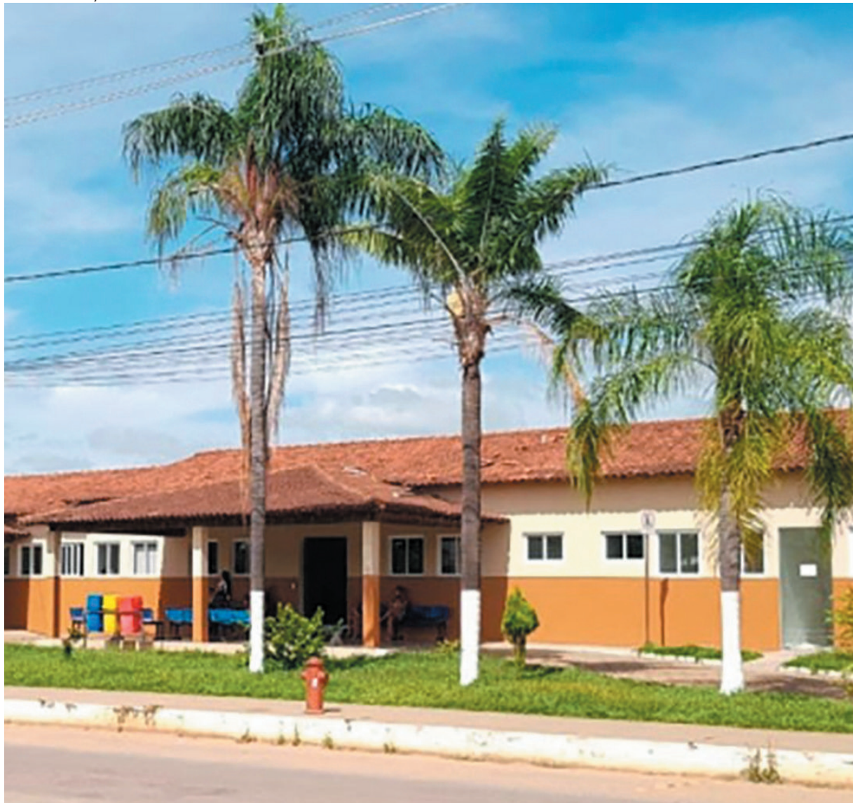
A medida busca ampliar o acesso à saúde em áreas com alta demanda e grande extensão territorial