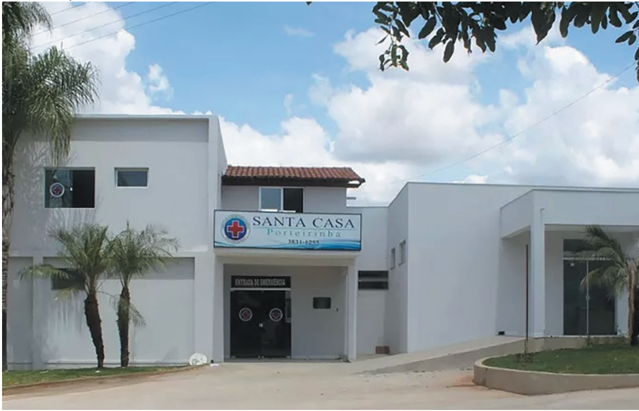
Instituições vão atuar nas redes de atenção psicossocial, parto e nascimento, urgência e emergência

bro, relaciona 163 municípios selecionados que podem ser contemplados, anualmente, com o repasse de incentivo financeiro superior a R$ 109,6 milhões para o Módulo Hospitais de Pequeno Porte. Os valores destinados a cada instituição, dependendo dos serviços que se dispõem a ofertar na Rede de Atenção à Saúde, terão vigência a partir de janeiro de 2025 e serão repassados em parcelas quadrimestrais.