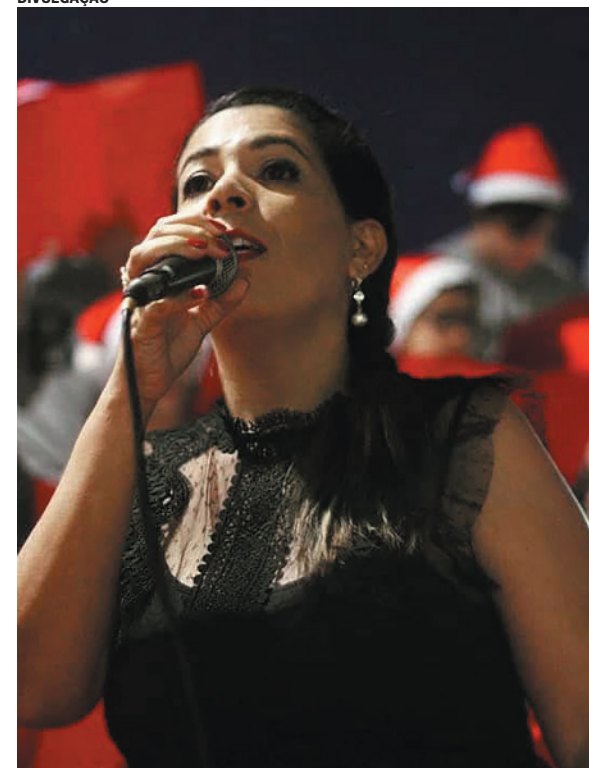
Expectativa é que a Cantata se torne tradição