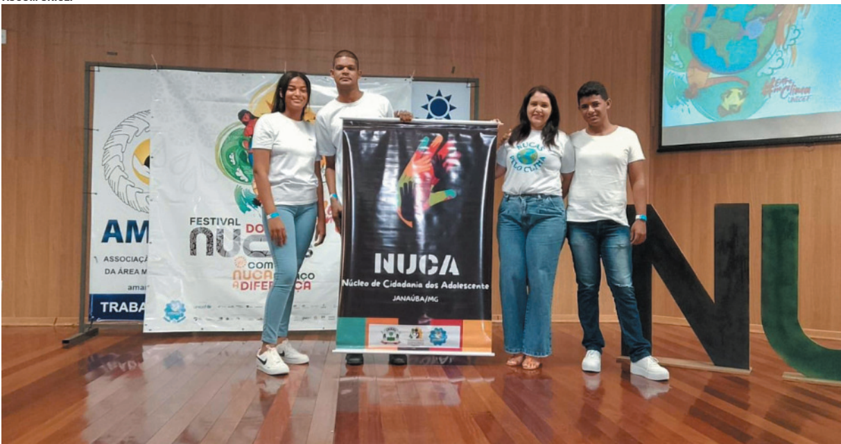
Conquista evidencia o impacto positivo no desenvolvimento humano e na garantia de direitos