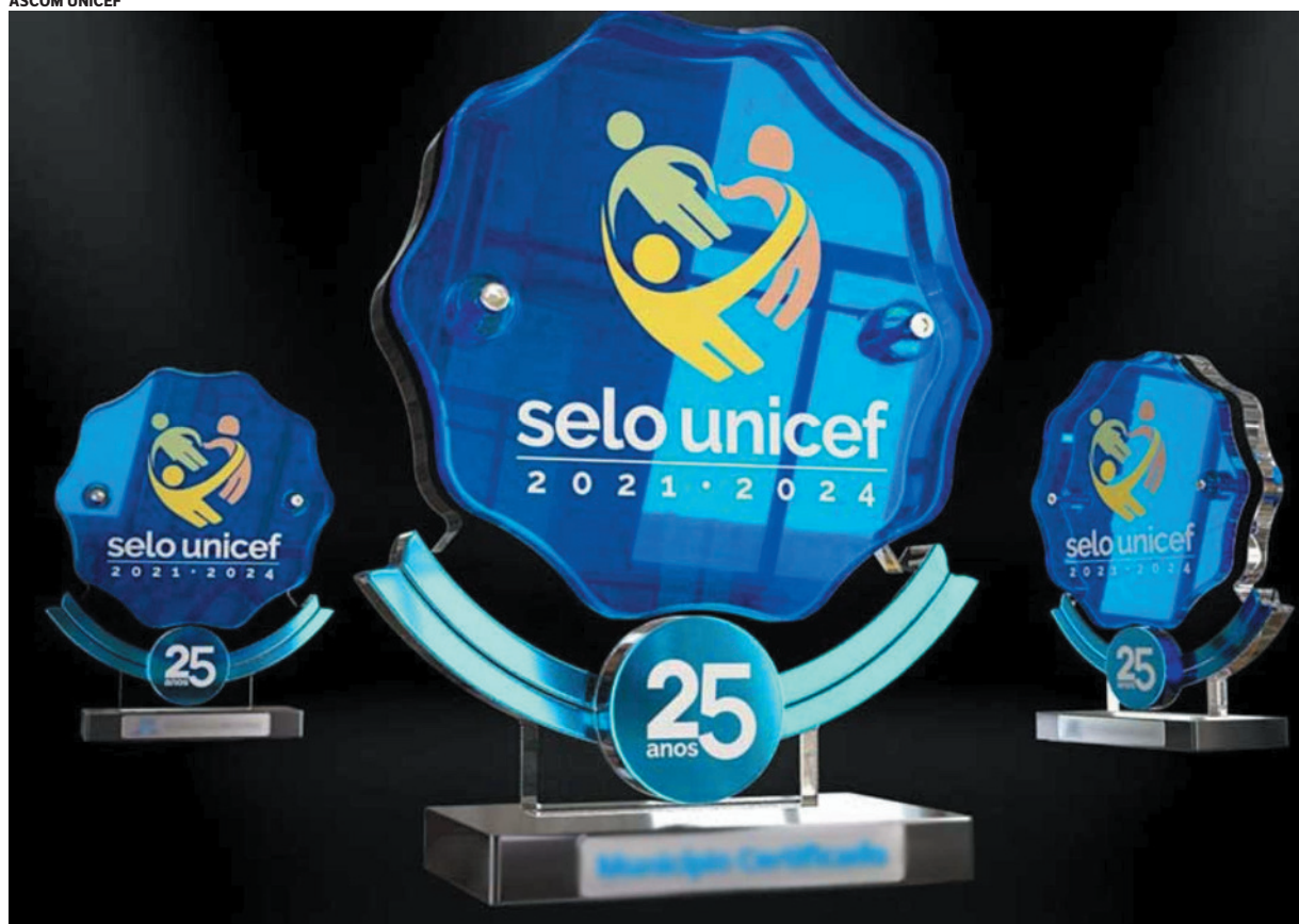
Selo UNICEF: 31 municípios do norte de Minas recebem certificação