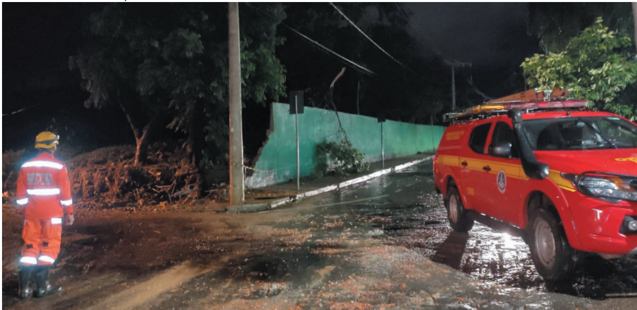
Chuvas fortes em Salinas: inundações danificam móveis e objetos pessoais