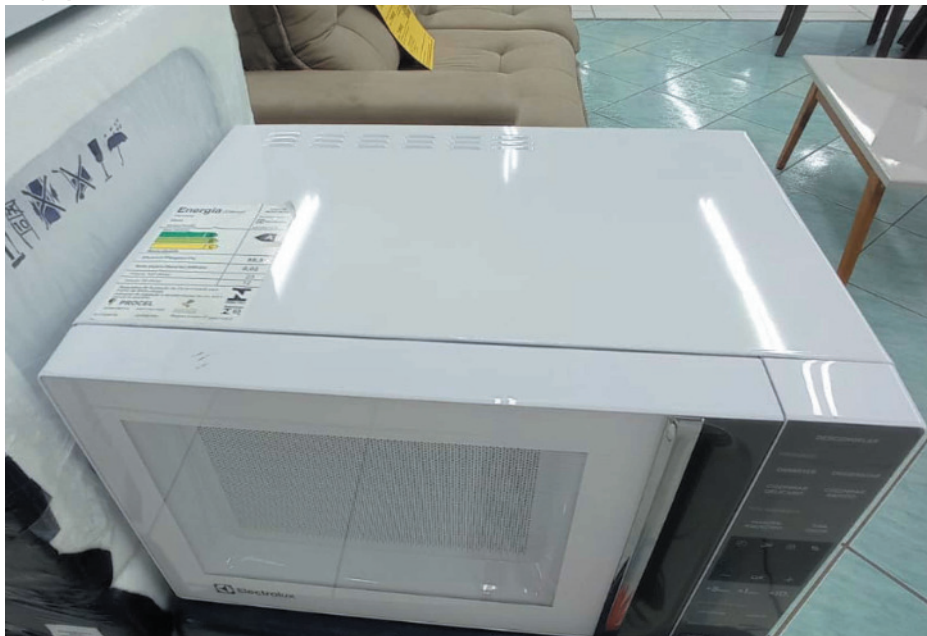
Escolhas responsáveis favorecem tanto o bolso quanto a sustentabilidade