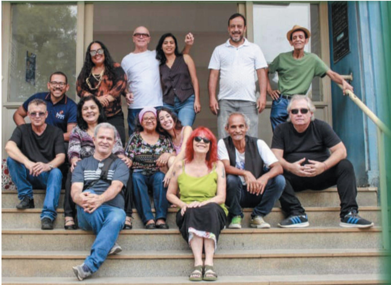
Grupo Transa Poética coleta cestas e brinquedos para Natal sem Fome até 22 de dezembro no Centro Cultural Hermes de Paula