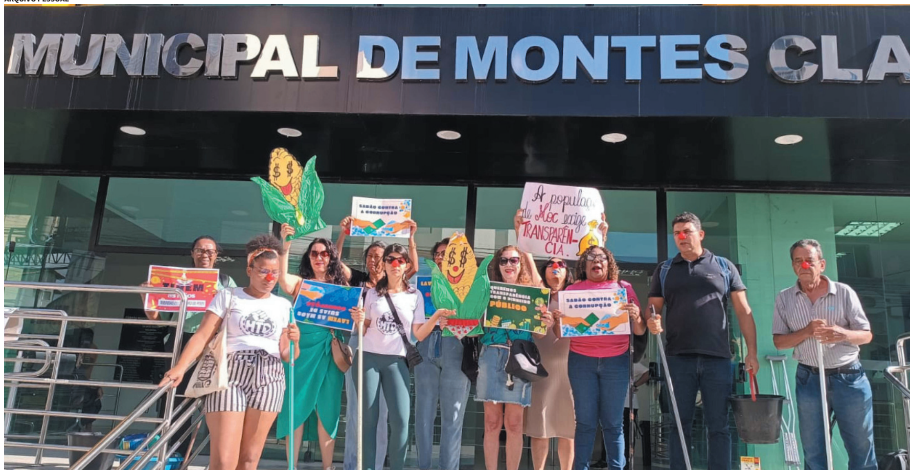
O grupo de manifestantes foi a Câmara Municipal em busca de respostas sobre o sumiço dos mais de R$ 20 milhões dos cofres do órgão público