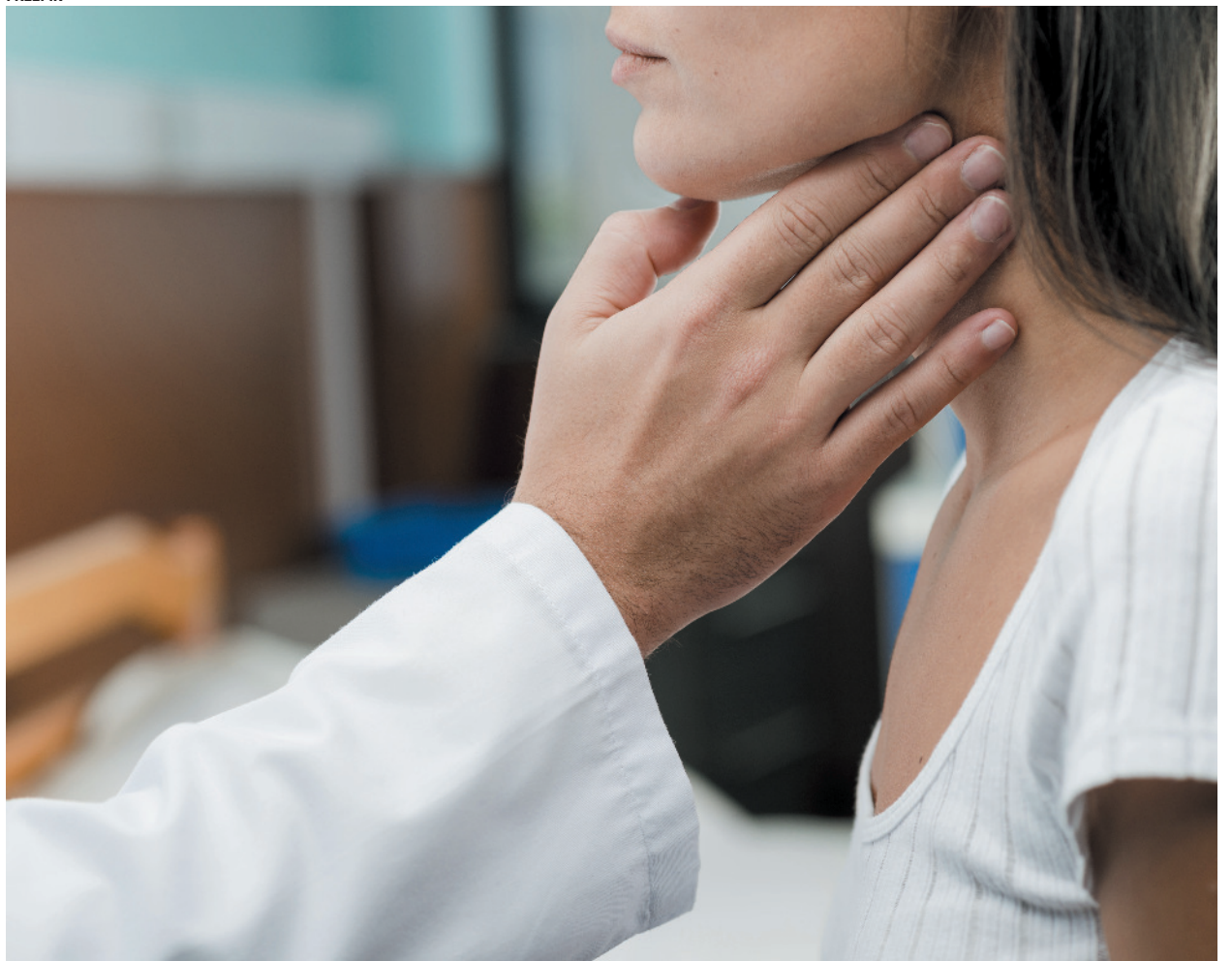
Norte de Minas teve 9,11% dos casos de câncer no estado entre 2019 e 2023, totalizando 1.195 casos