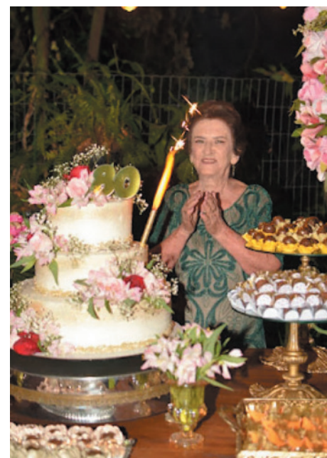
Na hora dos parabens, com um lindo bolo decorado com rosas que ela ama