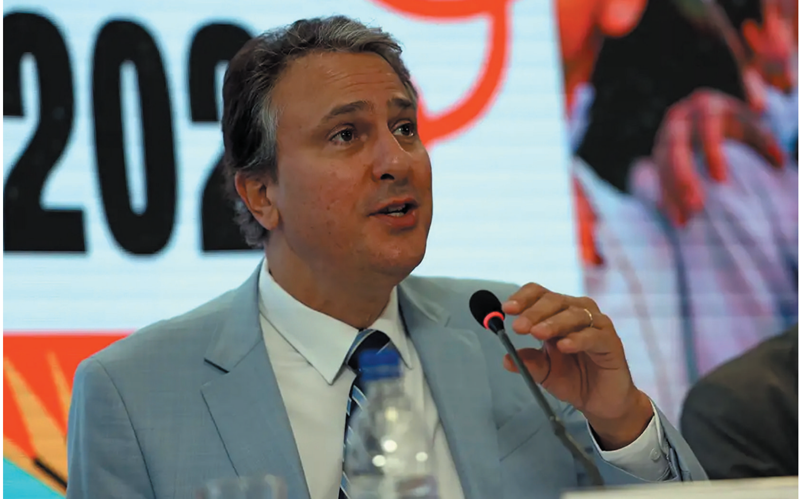
Programa será oficialmente anunciado este mês, antecipou o ministro da Educação Camilo Santana

ano, porque a gente quer ver se a gente consegue usar o Enem agora. A gente já quer que o aluno no Enem, ele já saiba que ele vai receber uma bolsa, se ele escolher a licenciatura. Ele já vai entrar na universidade com uma bolsa paga pelo governo. É uma forma de estimular. Além de uma bolsa, ele vai ter uma poupança”, antecipou o ministro.