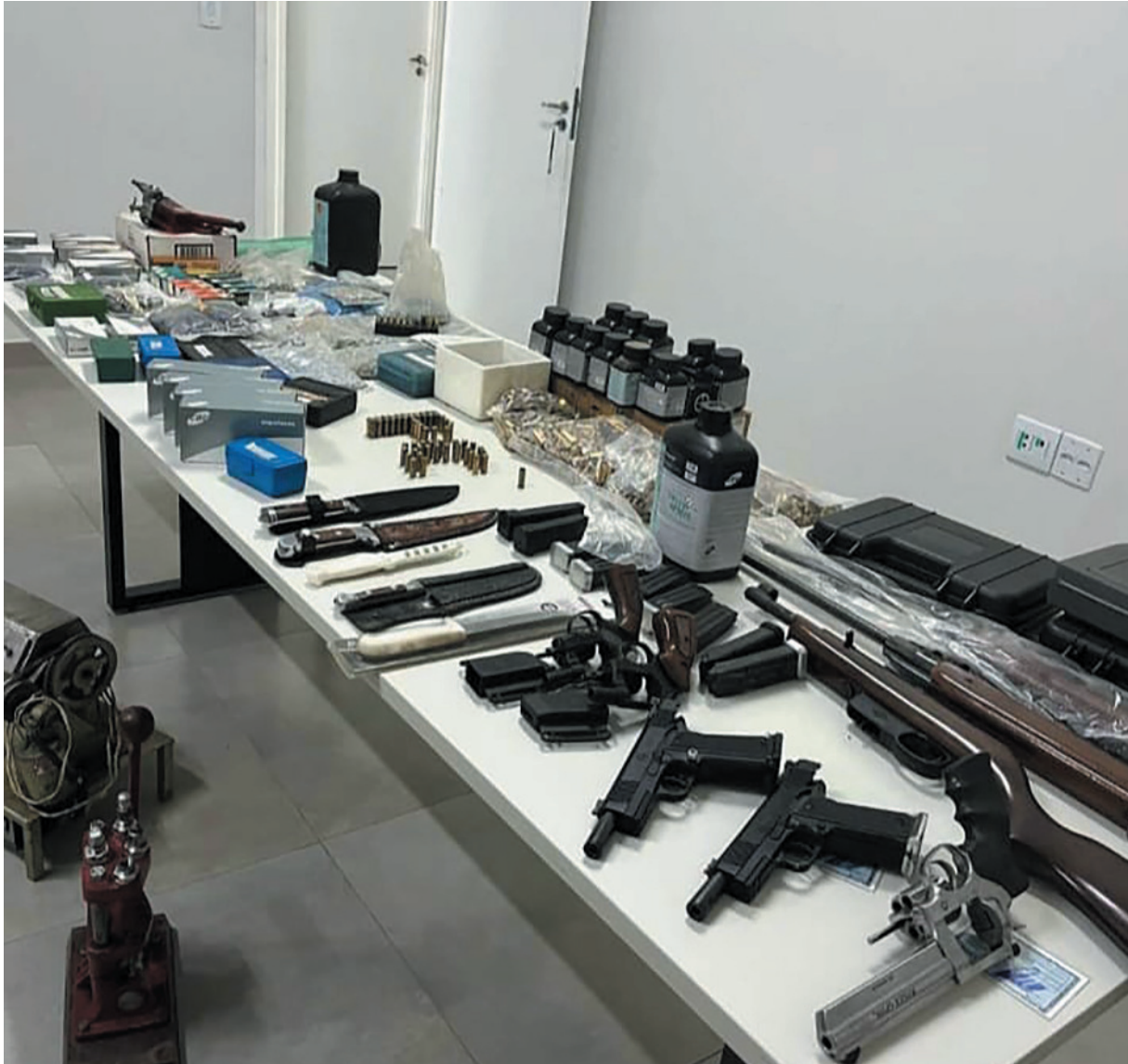
A operação foi conduzida com base na Lei Maria da Penha para garantir a segurança da vítima