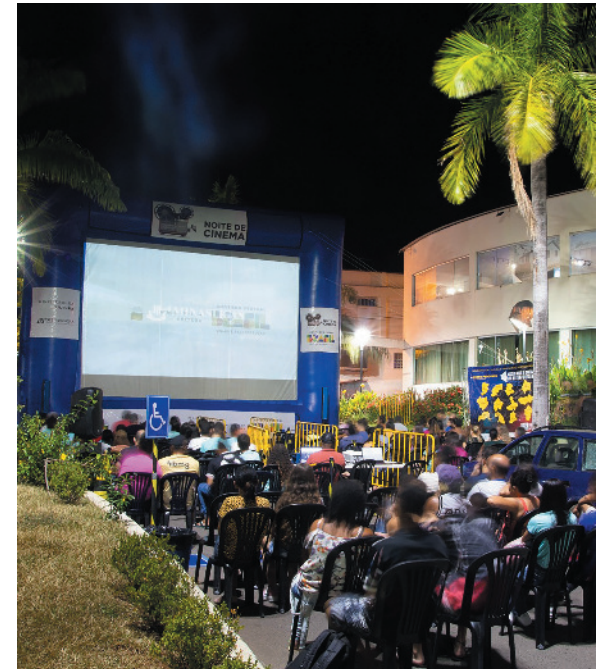
Programação começa nesta quinta-feira (31)