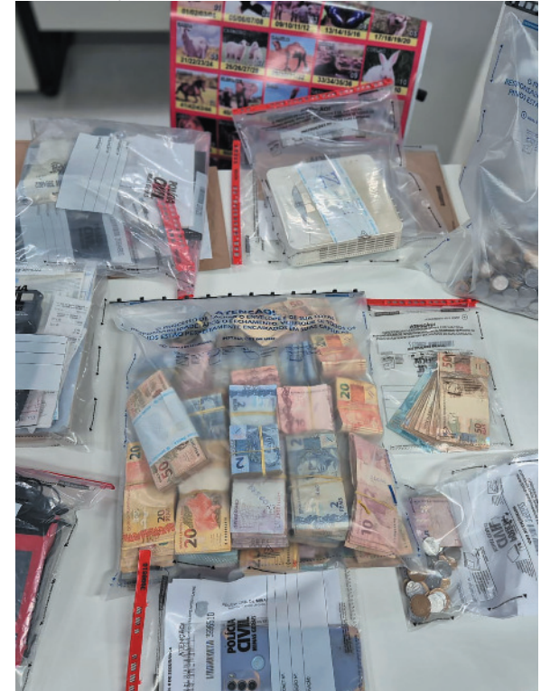
Investigações seguem em outras cidades