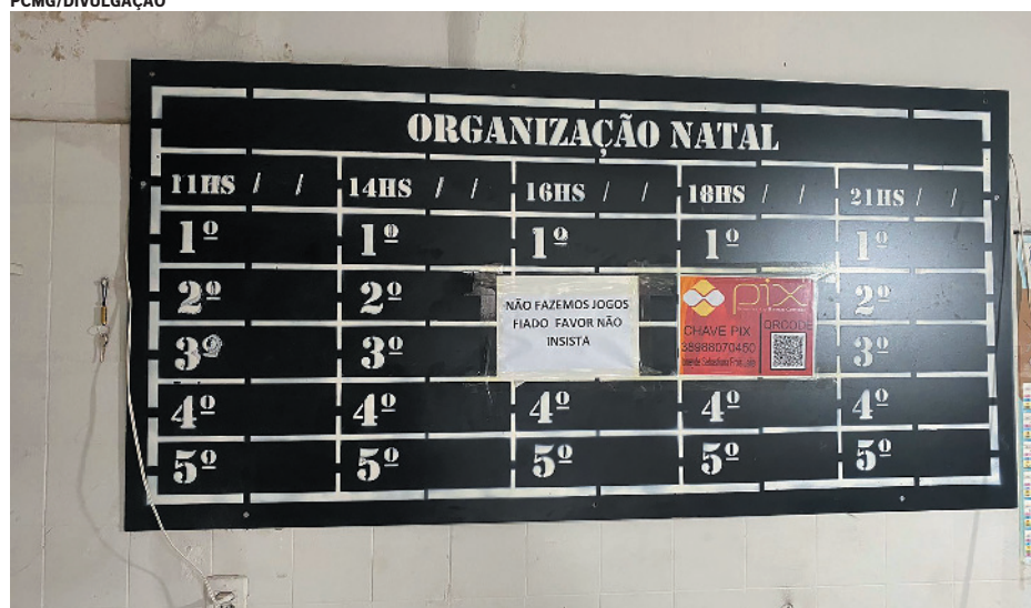
Operação iniciada em 2018 em Brasília de Minas focava identificação de pontos e cambistas do jogo do bicho

ro ilícito, há veículos de luxo e propriedades de alto valor.