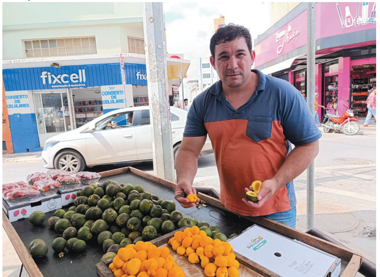
Iguaria é muito procurada por moradores e visitantes, destacando-se em pratos tradicionais da região