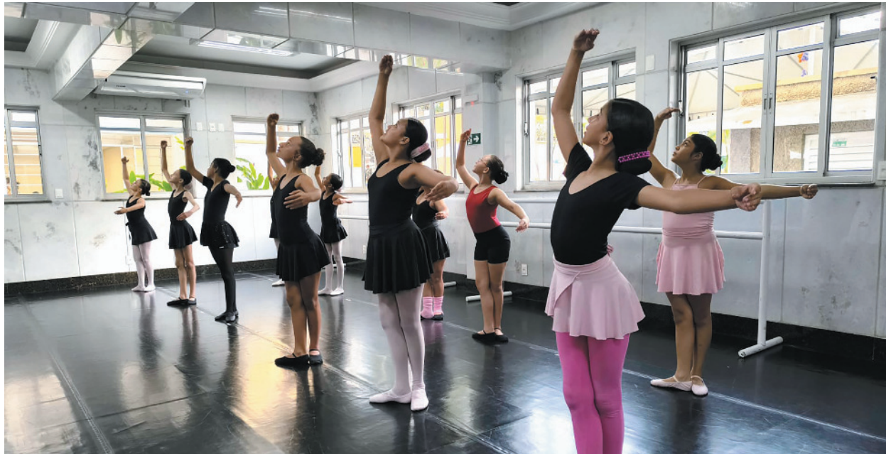
Para MOC, programa oferece 347 vagas nas áreas de educação, cultura e esportes

rias modalidades para diferentes faixas etárias, de crianças a partir de três anos a adultos. Em Montes Claros, são 347 vagas nas áreas de educação, cultura e esportes", detalha.