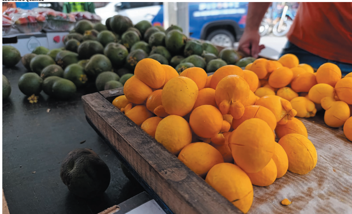
Frutos iniciais da safra vêm de Campo Azul e Japonvar, no Norte de Minas