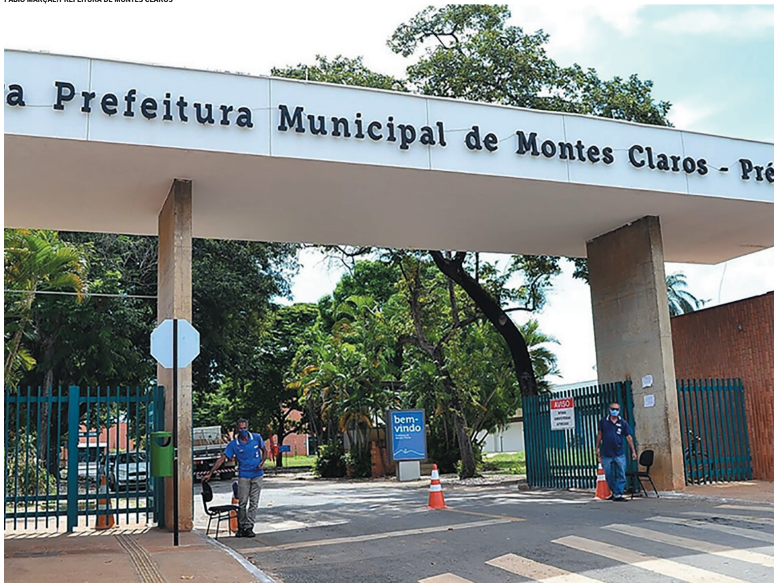
A aprovação pode ampliar a disparidade salarial, permitindo ao prefeito variar remunerações e elevar gastos públicos

O decreto, conforme lei, determina que 10%