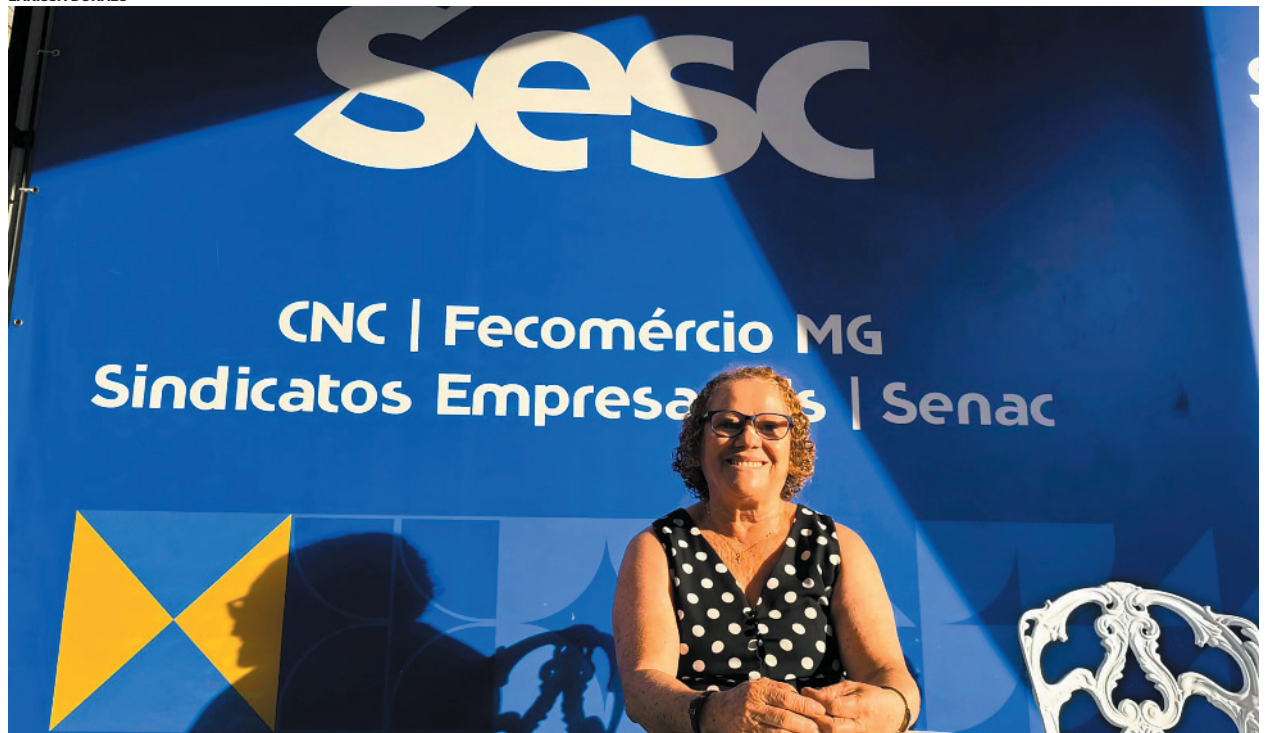
Os selecionados têm acesso às atividades por um ano, e novos candidatos podem se inscrever anualmente