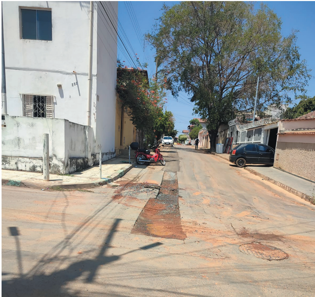
Dificuldades causam prejuízos financeiros devido aos frequentes danos nos veículos, relata morador