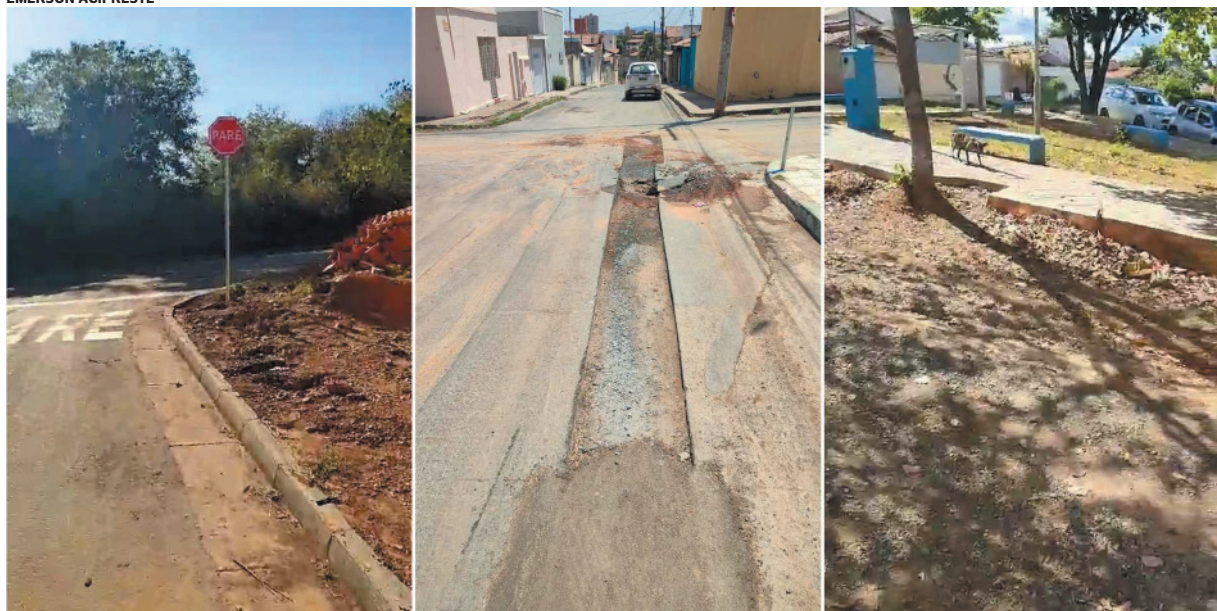
Asfalto deteriorado, falta de sinalização em vias movimentadas e praça incompleta são problemas relatados pelos moradores