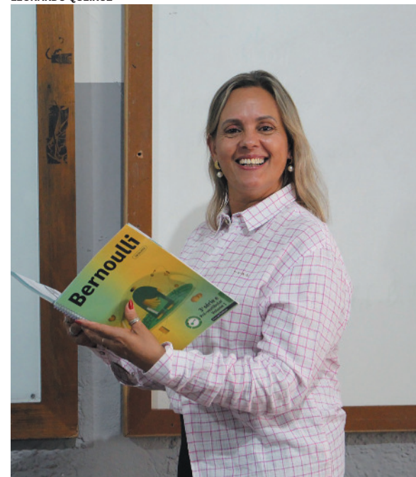
Atenção às atualidades é crucial, diz professora