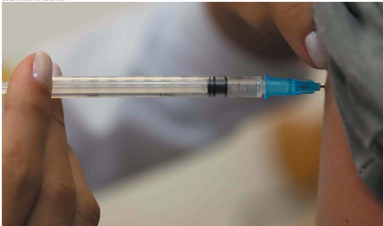
Campanha visa aumentar as coberturas vacinais no estado