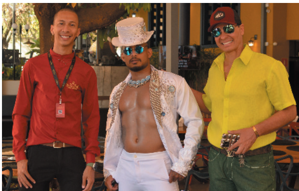
A equipe Faciscinium cuidou da recepção