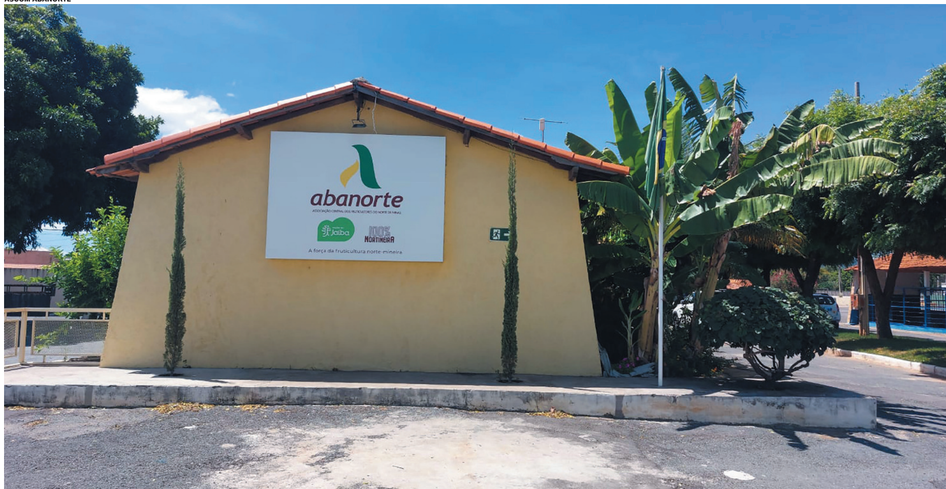
A Associação tem mais de 37 mil hectares (ha) de terras cultivadas na região. O destaque da produção fica para a banana, com cerca de 22 mil ha. T