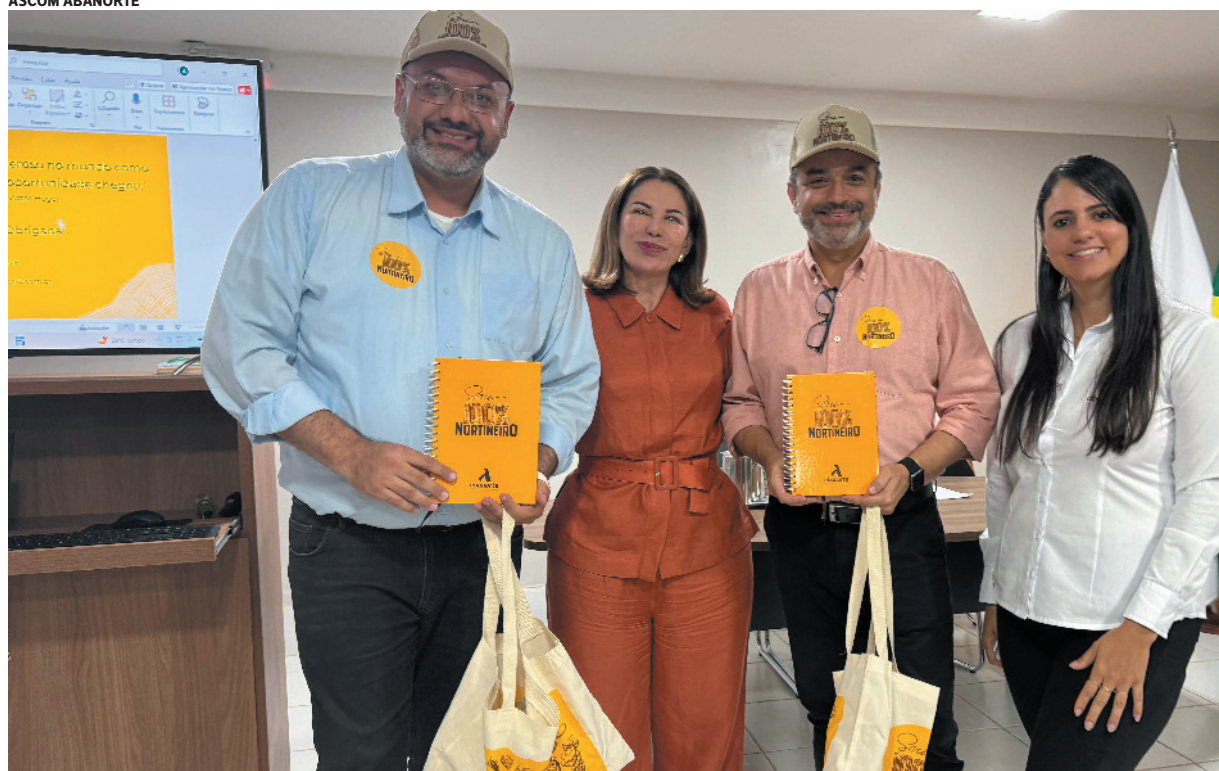
A presença de representantes do Governo de Minas trouxe expectativa de parcerias