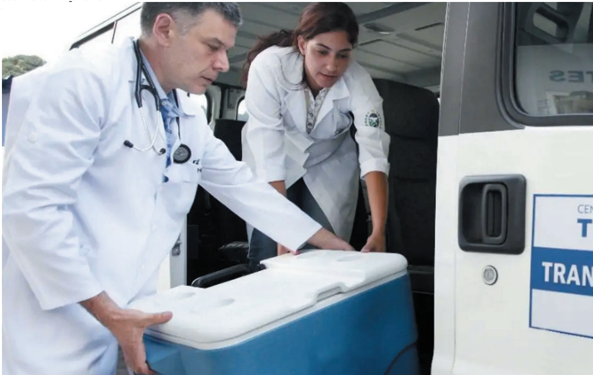
Caso ocorrido no Rio é isolado e não impacta sistema, diz médica