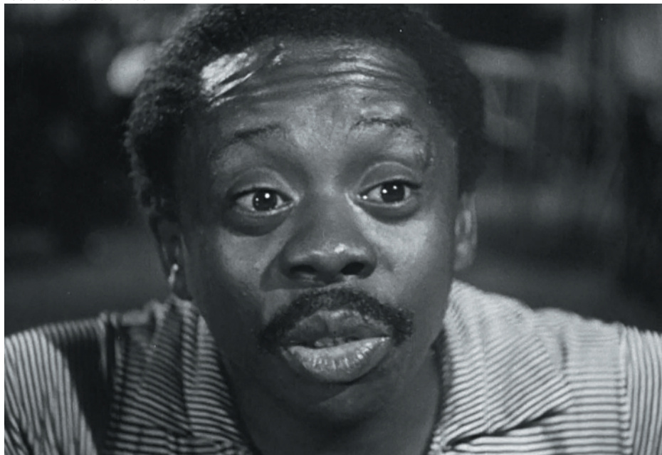
"Othelo, o grande" será um dos filmes exibidos pelo festival