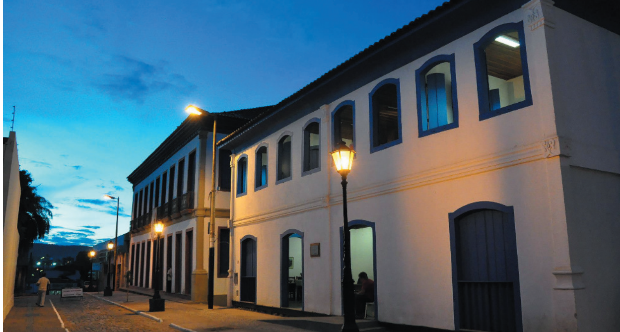
O evento ocorrerá no Corredor Cultural Padre Dudu, situado no centro da cidade