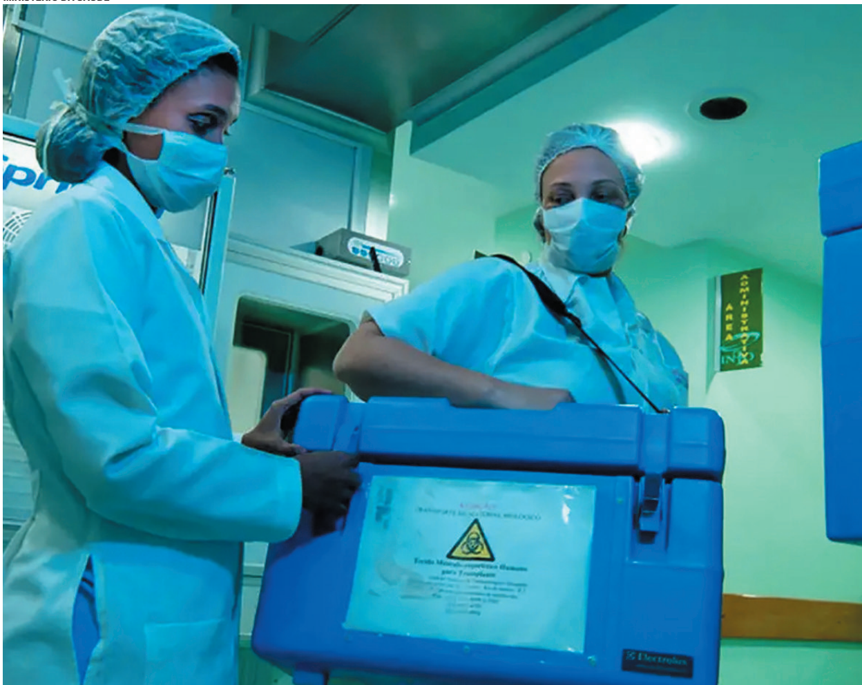
O caso destacou a relevância do maior programa público de transplante de órgãos e tecidos a nível mundial