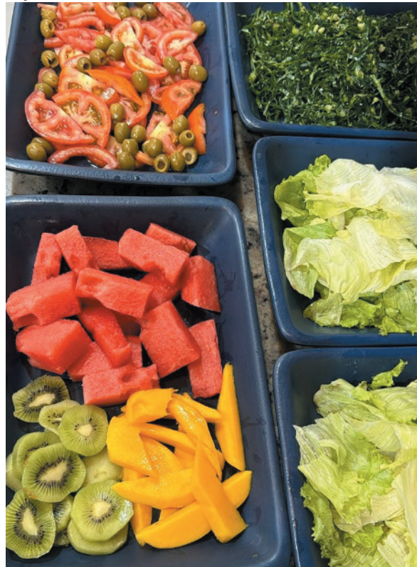
Alimentação também é afeto, diz chefe