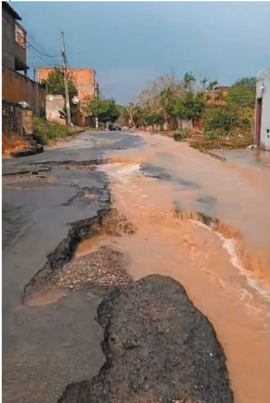
No bairro Independência, o asfalto recém executado pela prefeitura soltou nas primeiras chuvas