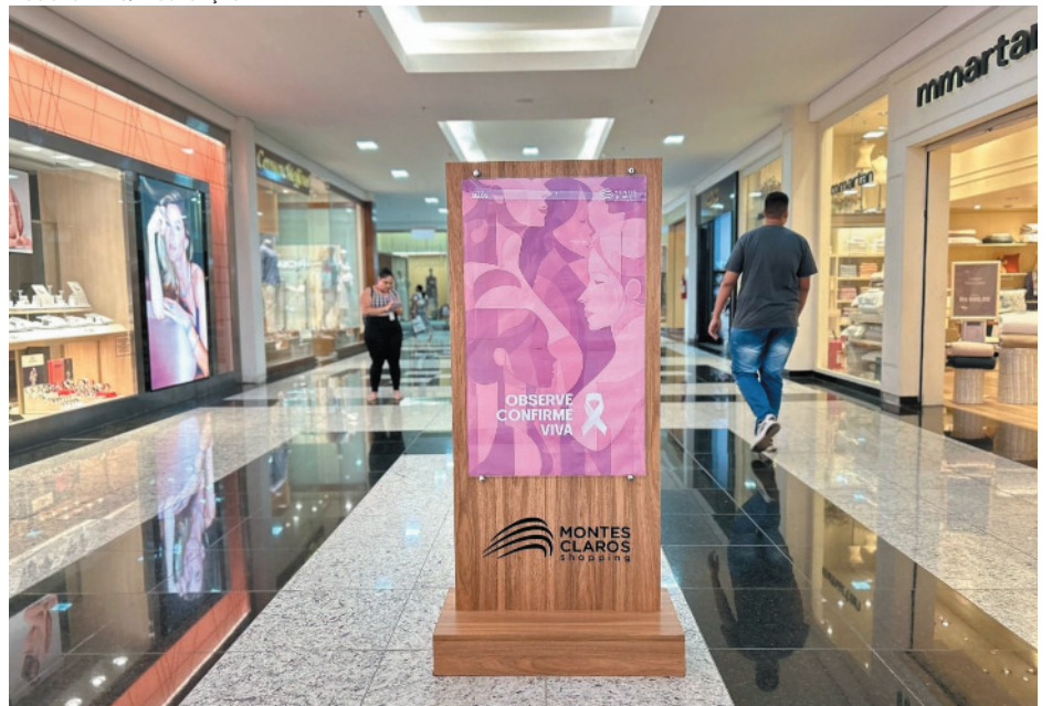
Campanha alerta para a queda de 58% nos exames de mamografia em Minas