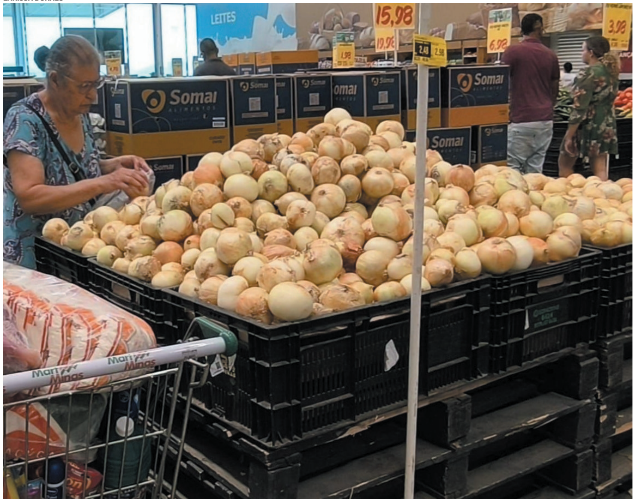
Consumidores relatam dificuldades para manter as compras básicas, optando por produtos mais baratos