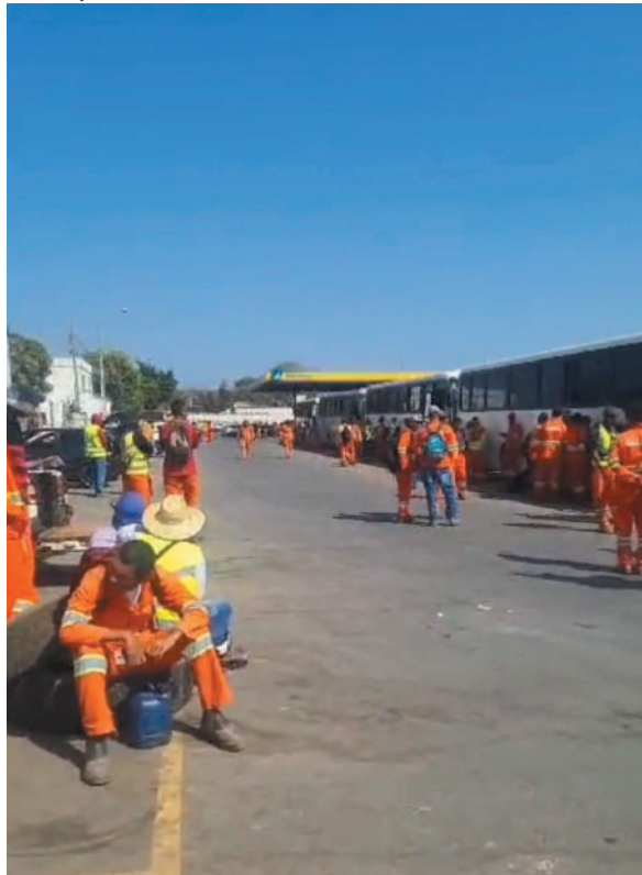
Trabalhadores pedem igualdade de benefícios