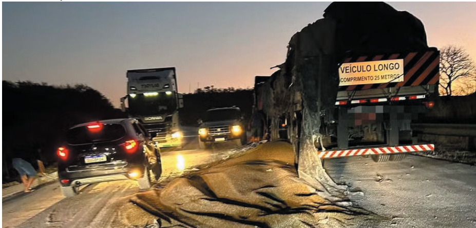
Homem é socorrido pelo SAMU após colisão entre veículos na BR-251

correu no local antes de levá-lo ao hospital de Francisco Sá, onde foi tratado