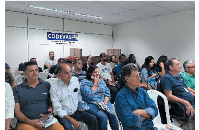
Funcionários e colaboradores da Codevasf atentos a cada detalhe da palestra