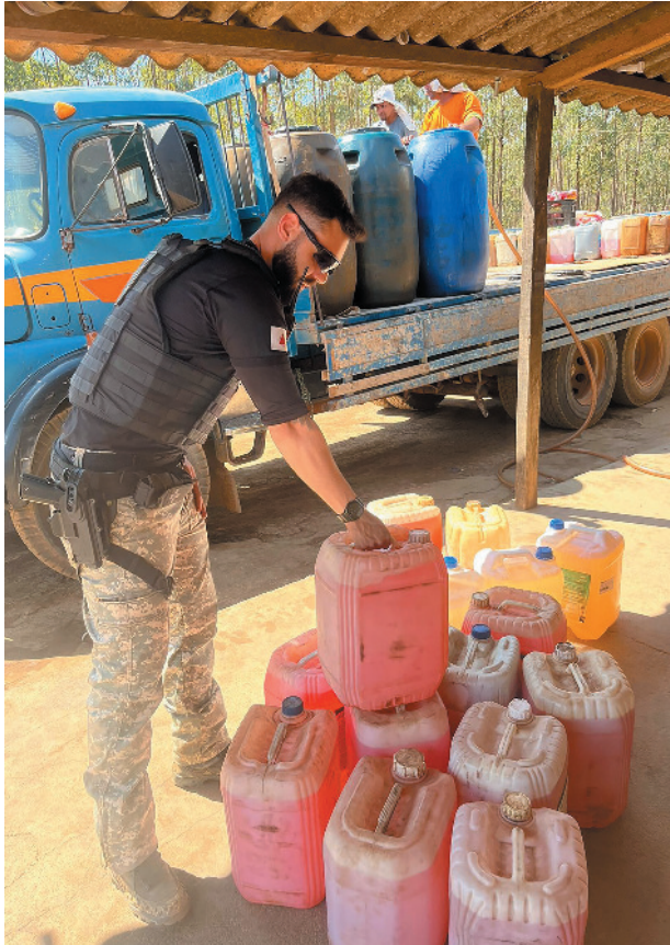
Agentes apreendem mais de 5 mil litros de combustível armazenado ilegalmente

identificar os locais de armazenamento e venda ilegais. "Após a apuração, so-