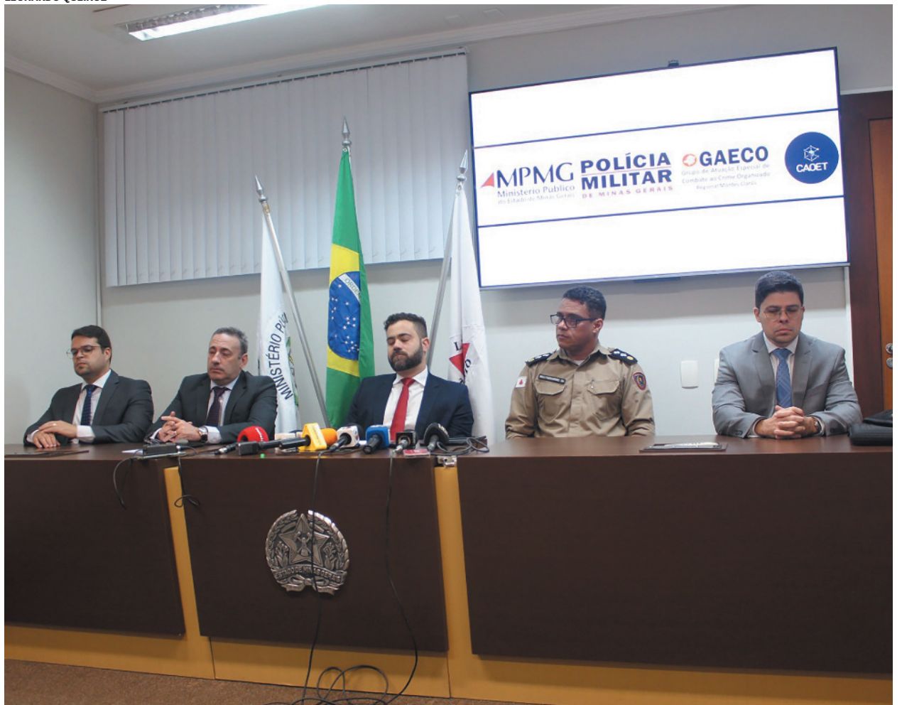
A investigação continua para rastrear o dinheiro e identificar envolvidos