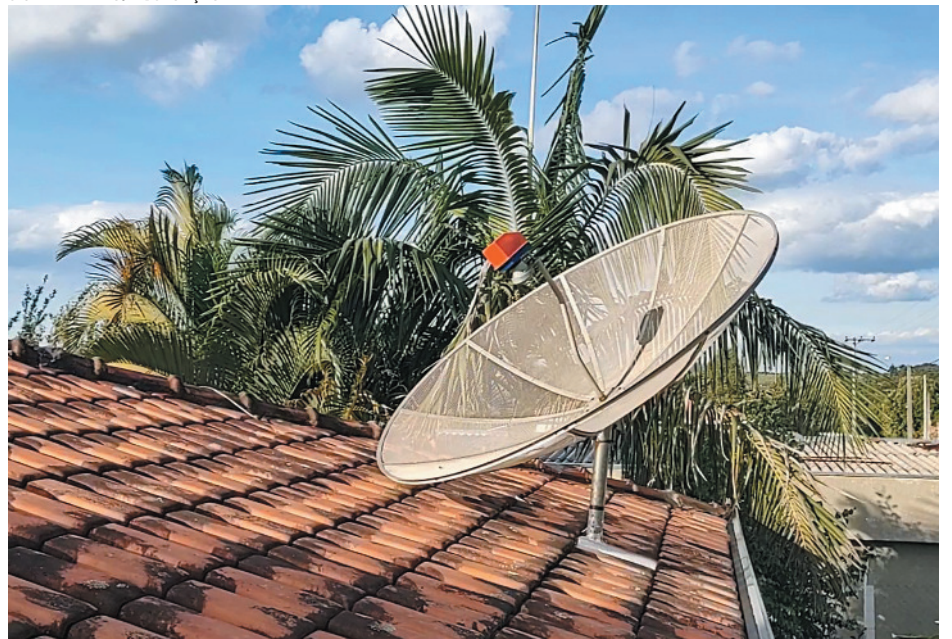
O serviço pode ser solicitado pelo telefone ou site