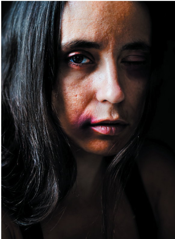
Violência contra mulheres exige ação firme