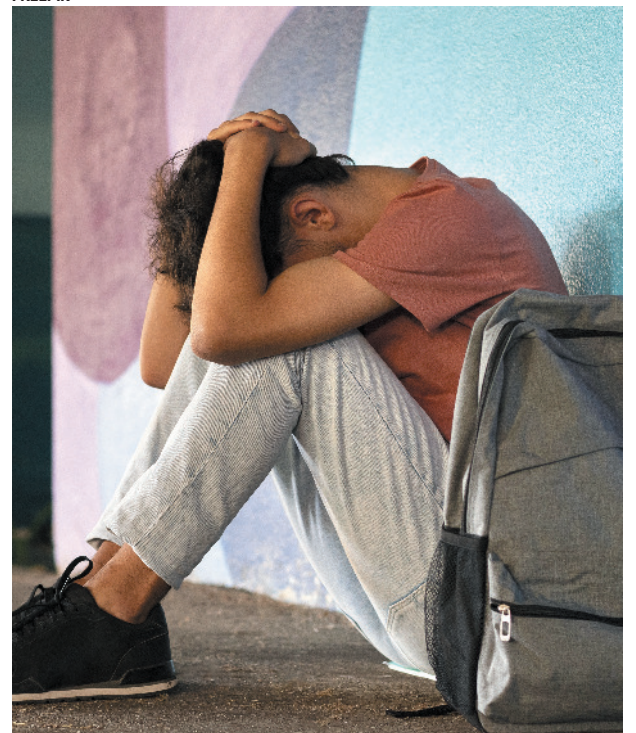
Grupo necessita de políticas públicas especiais