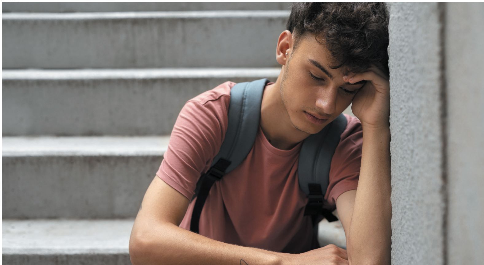
Taxas de suicídio crescem no Brasil, afetando principalmente homens jovens dos centros urbanos

de mortalidade entre os grupos investigados.