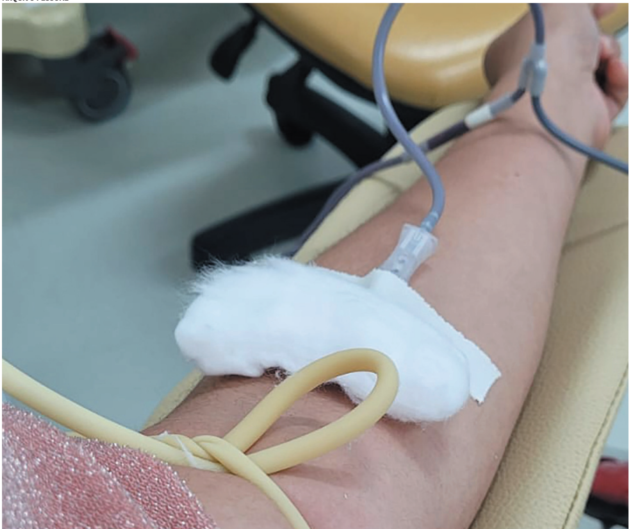
Colaboração de doadores voluntários é crucial para evitar que os hemocomponentes se tornem escassos