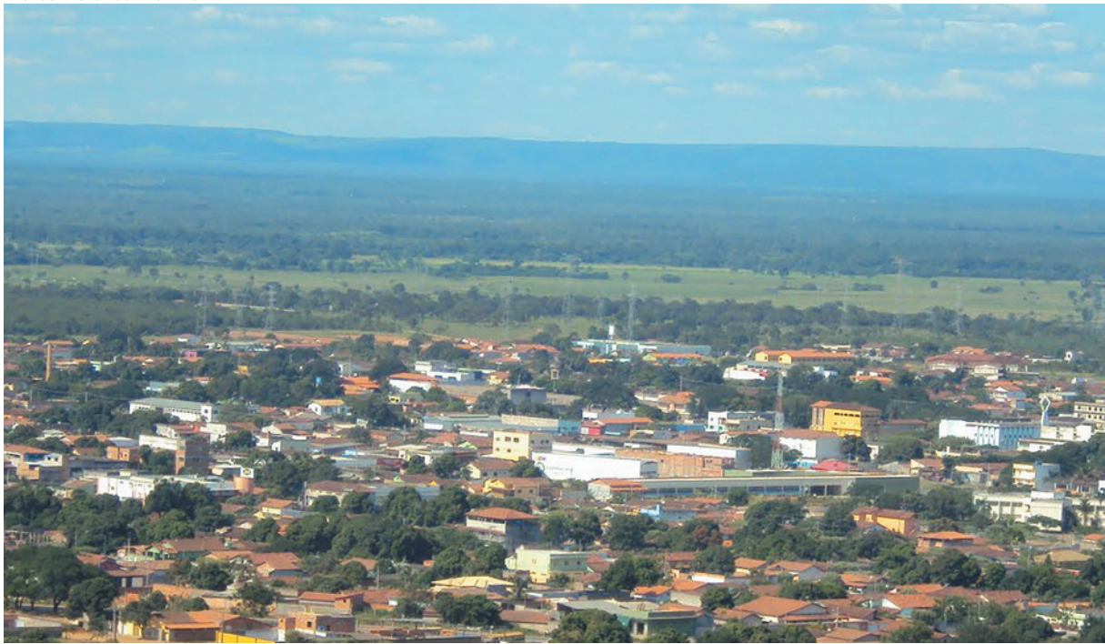
Medidas são consequência do longo período de estiagem