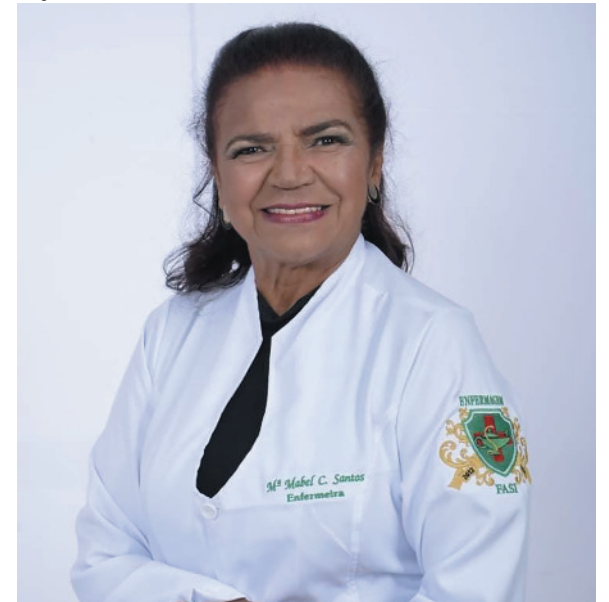
Cerimônia destaca seu papel como exemplo