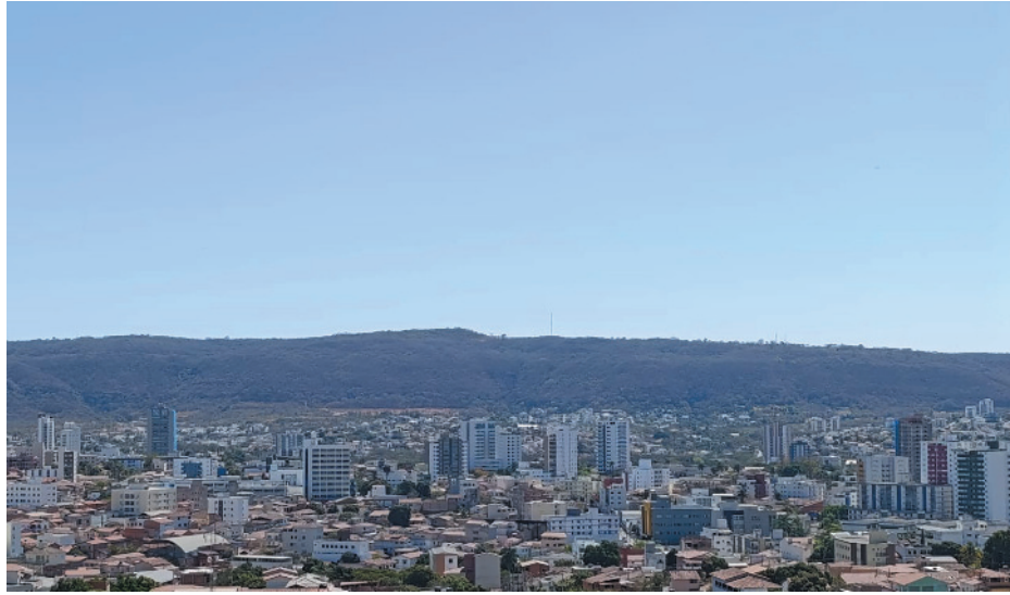
Em Montes Claros, umidade preocupa habitantes

bro e novembro de 2023. Em 2024, os primeiros alertas foram emitidos nos meses de março e maio, quando quase 80% dos municípios mineiros registraram temperaturas elevadas. Mesmo após a cessação dessas ondas de calor, o estado continuou a experimentar dias com altas temperaturas.