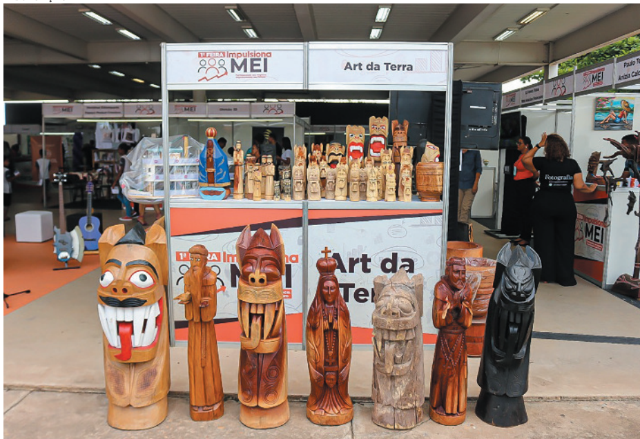
Ação é promovida pela parceria do Sebrae Minas e a Secretaria Municipal