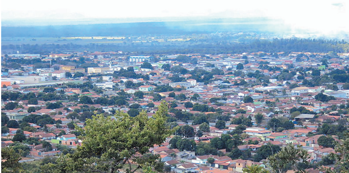
Descumprimento das portarias resultará na suspensão dos direitos de uso hídrico