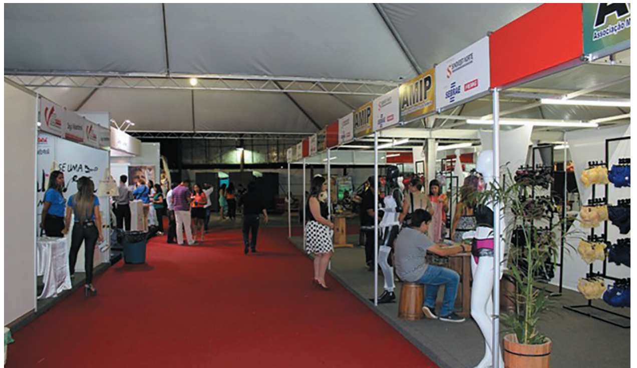
Começa hoje a 29ª Fenics