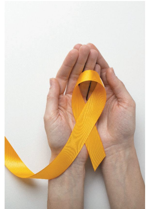
Saúde mental deve ser pauta trabalhista