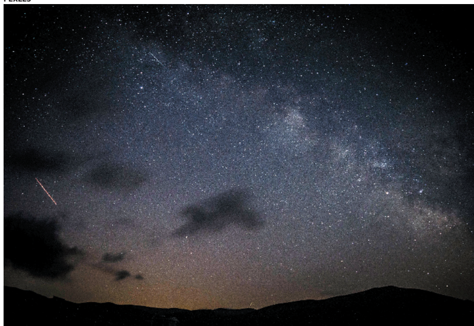
O cometa foi descoberto pelo Observatório Astronômico Zijinshan