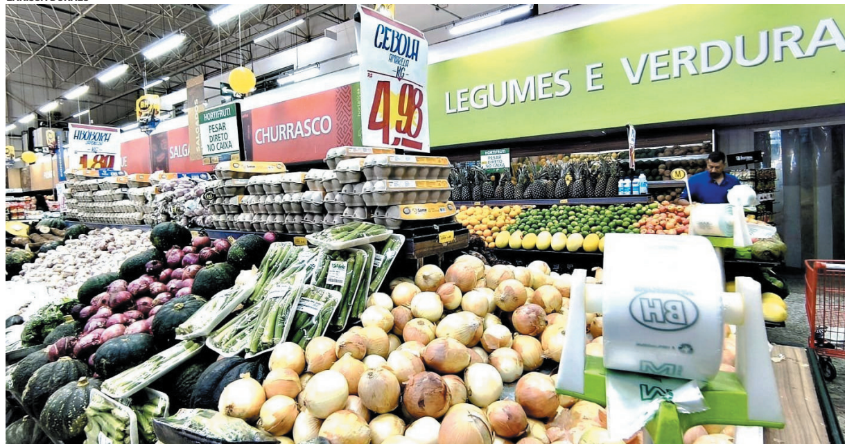
Queimadas e Estiagem Devem Agravar Alta de Preços