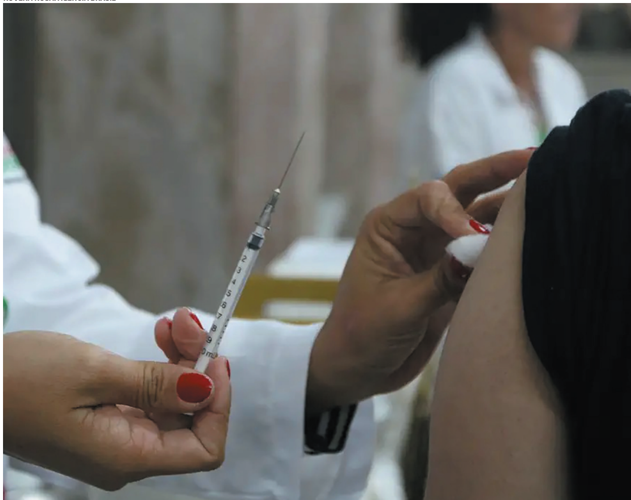
A alta de SRAG é notável em diversos estados e capitais, incluindo Minas Gerais