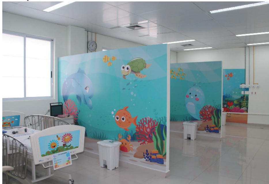
Abertura de novos leitos de UTI pediátrica no HCMR é vista como essencial