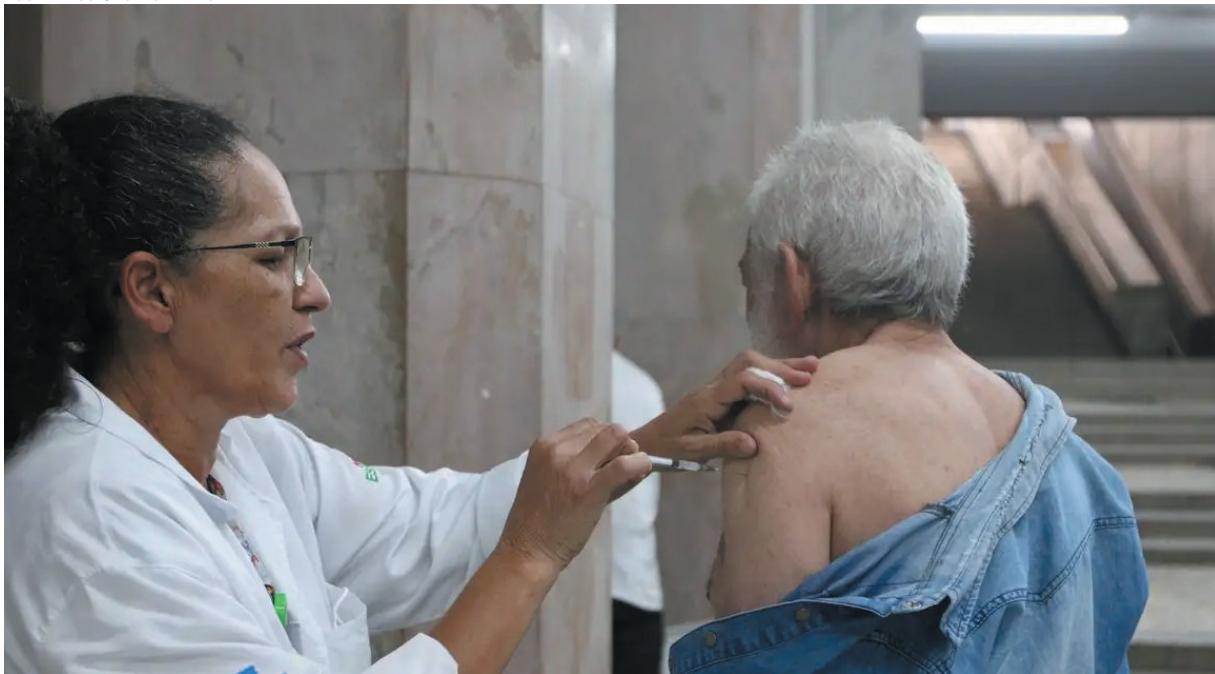
Na tendência de longo prazo, Minas Gerais registra aumento nos casos de Síndrome Respiratória Aguda Grave (SRAG)