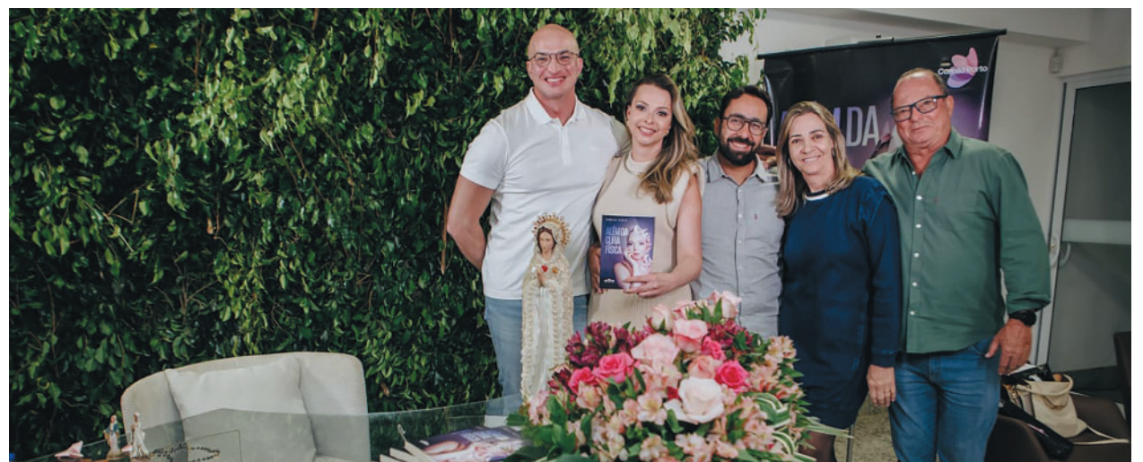
A escritora recebeu familiares e amigos