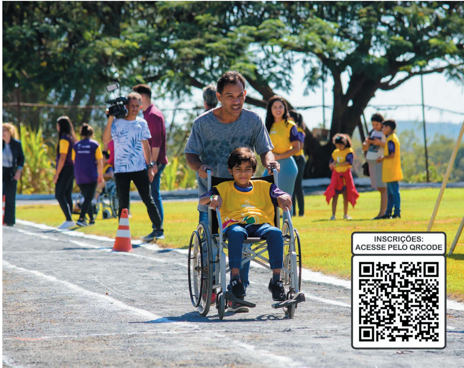
O festival é direcionado a crianças com deficiência e até 20% de crianças sem deficiência, sejam ou não praticantes de esportes paralímpicos

falta de capacitação desses profissionais. Este evento mais uma vez dará a oportunidade de todos conhecerem diversas modalidades paralímpicas, como o judô, atletismo, badminton e o vôlei sentado”, explica o professor.