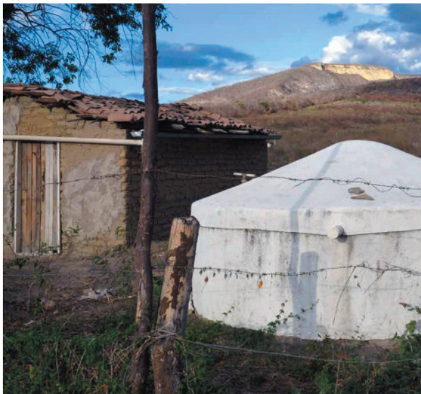
Região sofre com as consequências da seca