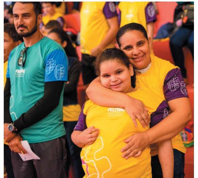
Objetivo é divulgar o esporte paralímpico