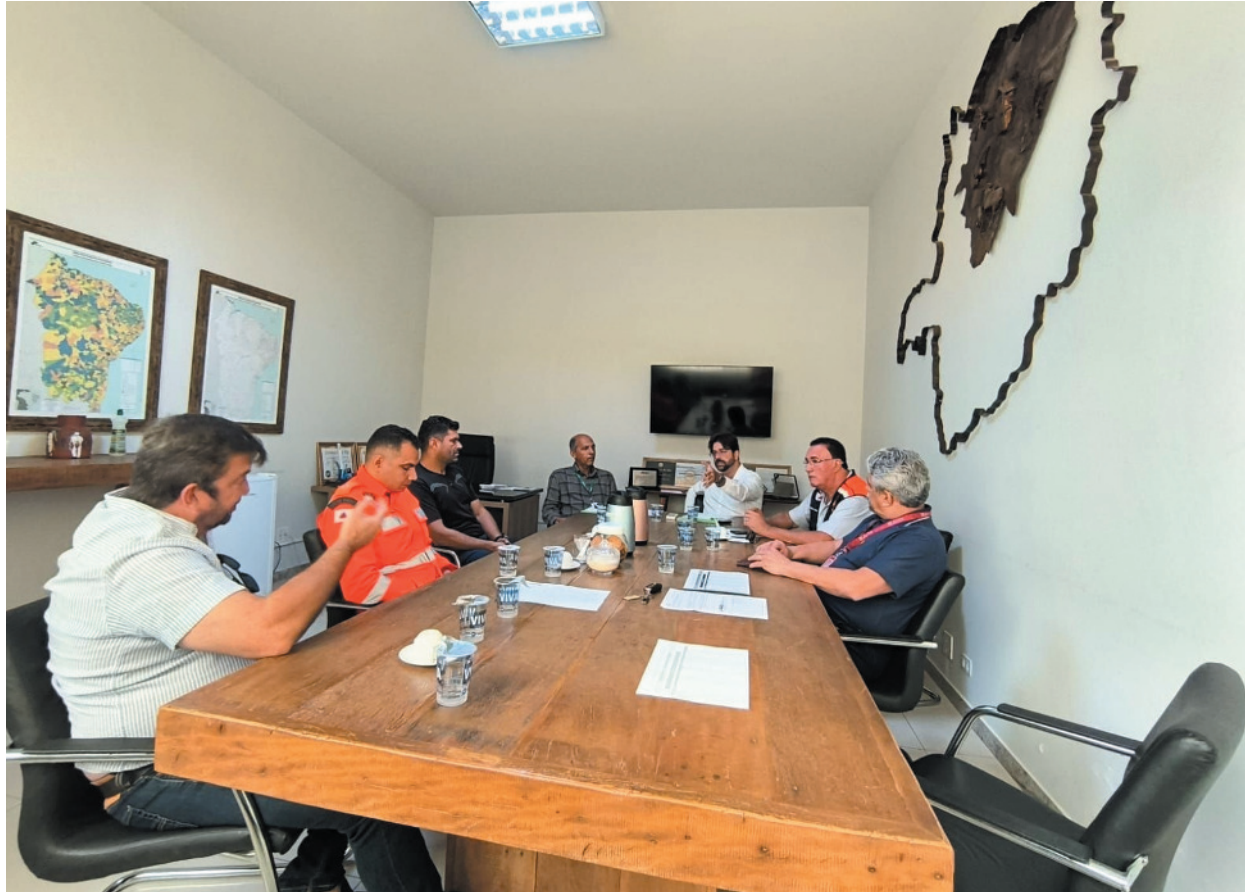
A reunião da AMAMS reuniu representantes para discutir ações urgentes no enfrentamento da crise hídrica no Norte de Minas